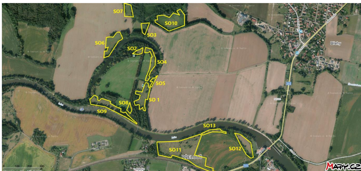
Obr. 2 Jednotlivá stanoviště Slavíkových ostrovů (zákres do podkladů z www.mapy.cz )

( Sanquisorba officinalis ) a hostitelské druhy mravenců rodu Myrmica . Uvádím charakteristiky jednotlivých ploch v tomto populačním okruhu.