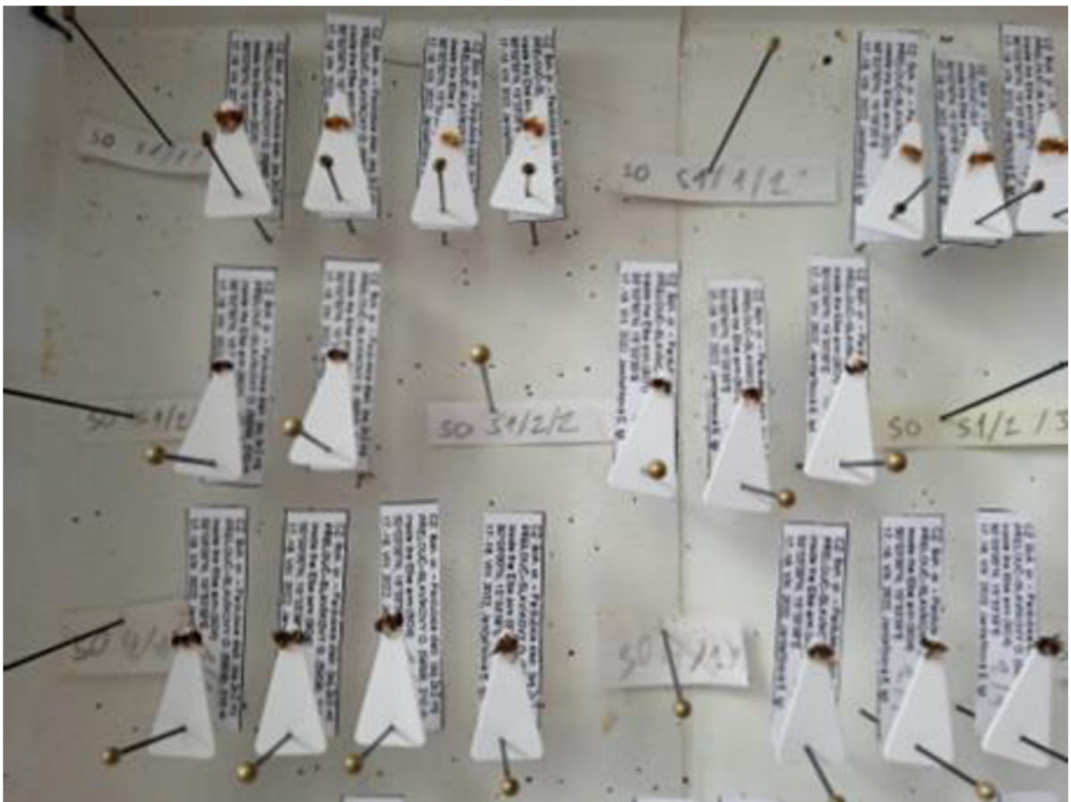
Obr. 7 Ukázka preparovaných mravenců (vlastní fotografie)

Sběr kukel se už neprováděl přes čtverce, protože nás už nezajímalo jejich rozmístění, ale šlo jen o sběr dat, které jsme potřebovali porovnat z hlediska časové náročnosti a zastoupení druhů. Z nalezeného mraveniště jsme nejprve odchytili několik dělnic, které jsme opět jako předtím vložili do ampule s lihem a očíslovali podle daného mraveniště pro pozdější určení. Pak se posbíralo tolik plodu, kolik bylo možné, a ten se vložil do prázdné ependorfky a ta byla očíslována shodně s vzorkem mravenců. Plod byl uložen v laboratoři do mrazicího boxu pro pozdější vyhodnocení a případný rozbor.