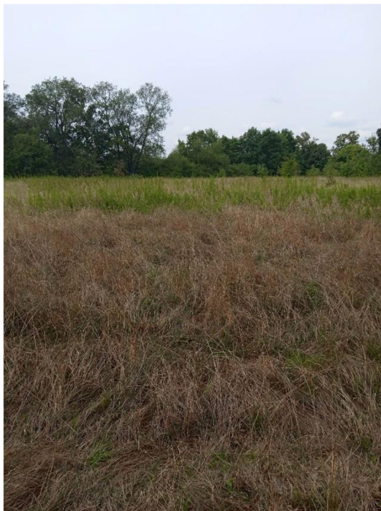
Obr. 5 Stanoviště z lokality Labišťata

Poslední oblastí, kterou jsem zkoumala, byla Labišťata. Labišťata jsou vzhledem krajiny podobná Slavíkovým ostrovům. Louky zde jsou také do jisté míry zarostlé, keři a lužním lesy. Nacházející se rovněž v blízkosti řeky Labe. Zemědělsky udržovaná půda se nachází i zde, ale ne v takové míře, jako u předchozí oblasti. Za období mého pobytu jsem nezaznamenala žádné kosení zdejších luk. Zde nebyla určována denzita mravenišť, ale proběhl zde pokus o shromáždění materiálu mravenčího plodu pro pozdější rozbor.