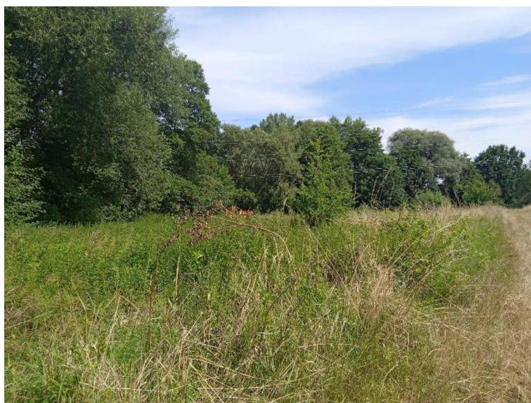
Obr. 1 Stanoviště z lokality Slavíkovy ostrovy

Oblast se nachází u řeky Labe a regulací odříznutého ramene (Slavíkovy ostrovy), u města Přelouč. Jedná se o louky, které se mísí s lužními lesy a břehovými porosty. Některé louky jsou bohužel často sečeny v období, které poškozuje jejich faunu a není přínosné pro zdejší populace některých druhů mravenců. Vyskytují se zde chráněné druhy modrásek očkovaný – Phengaris teleius (Bergsträsser 1779) a modrásek bahenní – Phengaris nausithous (Bergsträsser 1779), jejichž životní cyklus je vázaný na rostlinu s názvem krvavec toten