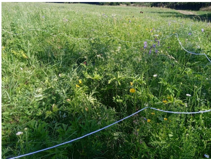
Obr. 6 V terénu vyznačená monitorovací čtverec

Materiál mravenců z lihu byl vypreparován nalepením na trojúhelníkové štítky a opatřen lokalizací. Poté byl vedoucím práce roztríděn a ve spolupráci s Dr. P. Wernerem určen do druhu s využitím běžných určovacích příruček (Czechowski et al. 2002, Seifert 2018). Po určení jsem výsledky přepsala do tabulek. U ploch, kde jsem zjistila hostitelské mravence jsem provedla přepočty a odhadla celkové množství mravenišť hostitelských druhů mravenců na rozlohu plochy. Tyto údaje je možno využít pro hodnocení území z hlediska kapacity prostředí (úživnosti) pro parazitické myrmekofilní modrásky.