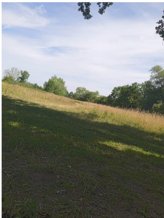
Obr. 3 Stanoviště z lokality Lohenice

Toto území se rozléhá mezi Přeloučí a nedalekou stejnojmennou vesnicí Lohenice. Rovněž jde o odříznuté říční rameno a louky v jeho okolí a okolí Labe, ale tentokrát se nejedná o zalesněnou oblast jako to je na Slavíkových ostrovech. Špatný dopad na tuto oblast má zemědělská činnost na sousedních polích, která se zde ve velké míře nachází.