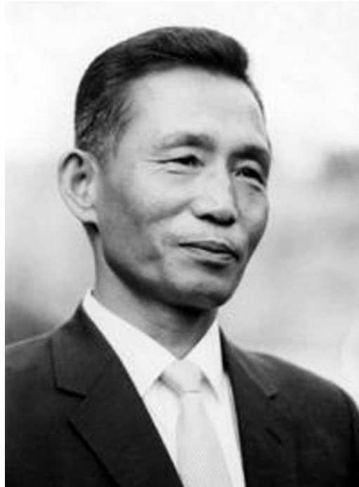
Obrázok 1. Park Chung Hee

Park Chung Hee sa teda dostal k moci, po relatívne pokojnom vojenskom puči, ktorý sa odohral 16. mája 1961. Od tohto dňa prakticky začína Parkova neprerušená vláda, ktorá trvala až do jeho zavraždenia v roku 1979. 36 Obdobie, ktoré trvalo takmer dve desaťročia sa dá rozdeliť na tri základné fázy 37 a spája sa s množstvom dramatických zmien, v rôznych oblastiach, ale tou najvýznamnejšou je práve ekonomická situácia v južnej časti Kórejského polostrova.