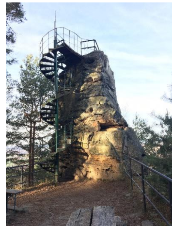
Obrázek 12 Vyhlídka Hlavatice (Autorka)

Skalní vyhlídka Hlavatice (obr. 12), dříve nazývaná také jako Zub času, či Napoleonova hlava, nám poskytne výhled na město Turnov, Kozákovský či Ještědský hřeben, Bezděz a Jizerské hory z výšky 380 metrů nad mořem. 119 Na rozhlednu vedou točité schody, které jsou zabudované ve skále. Pod vyhlídkou jsou umístěny lavičky, které mohou posloužit ke chvílce odpočinku. Během hlavní sezóny bývá v provozu také kiosek s drobným občerstvením.