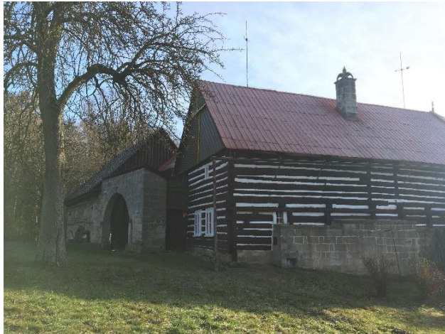
Obrázek 18 Kopicův statek

Následně budeme mírně stoupat příjemnou lesní stezkou přibližně 10 minut, díky stoupání se nám začnou nabízet malebné výhledy na skalní útvary. Stezka nás dovede až k vyhlídce U Lvička (bod č. 5 na mapě).