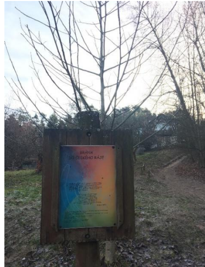
Obrázek 11 Brána do Českého ráje

Skalní vyhlídka Hlavatice (obr. 12), dříve nazývaná také jako Zub času, či Napoleonova hlava, nám poskytne výhled na město Turnov, Kozákovský či Ještědský hřeben, Bezděz a Jizerské hory z výšky 380 metrů nad mořem. 119 Na rozhlednu vedou točité schody, které jsou zabudované ve skále. Pod vyhlídkou jsou umístěny lavičky, které mohou posloužit ke chvílce odpočinku. Během hlavní sezóny bývá v provozu také kiosek s drobným občerstvením.