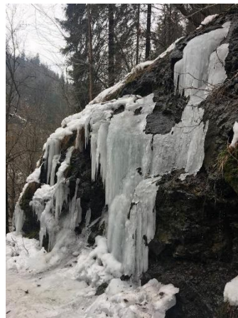
Obrázek 7 Riegrova stezka v zimě (Autorka)

Stezka není zpřístupněna pro cyklisty, pouze pro pěší. Otevřena je po celý rok, avšak v zimních měsících se musí dbát zvýšené opatrnosti, terén namrzá a klouže se. Nebezpečné mohou být i tající rampouchy, které visí ze skalních bloků podél stezky (viz. obrázek 7).