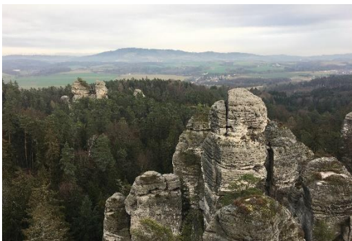
Obrázek 19 Výhled z vyhlídky u Lvička

Z vyhlídky (obr. 19) můžeme uvidět v dálce vrchol Kozákova, Javorníku, či Tatobitského vrchu. Z pohledu na skalní město, které je vidět na obrázku 20, můžeme poznat následující skalní útvary: zleva Cikán, Kapelník, Podmokelská a vpravo vrchol Panny. K vyhlídce vede kovová lávka, která umožňuje její jednodušší přístup.