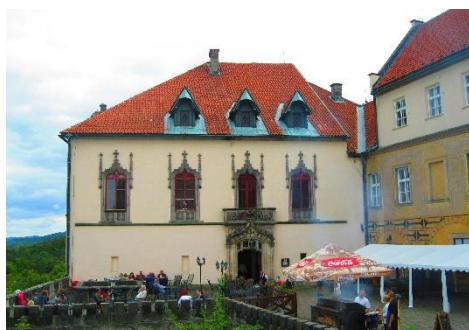
Obrázek 5 Nádvoří zámku Hrubá Skála

Pro veřejnost je zpřístupněna vyhlídková věž, nádvoří zámku (obr. 5) a některé zámecké interiéry. Při vstupu je možné si vybrat druh vstupného, levnější umožní navštívit nádvoří a vyhlídkovou věž, dražší i unikátní zámecké interiéry. 93