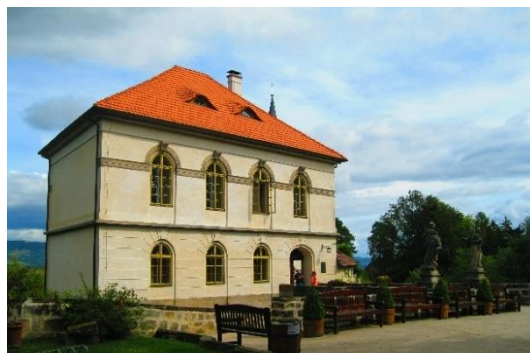
Obrázek 3 Klasicistní dům na Valdštejně

V současné době si mohou návštěvníci prohlédnout prostory klasicistního domu (obr. 3), romantického paláce, biliárního sálu, kaple sv. Jana Nepomuckého, středověké sklepení hradu a kočárovnu. 75