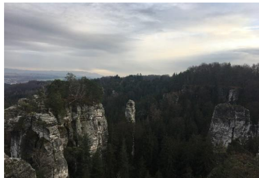
Obrázek 20 Výhled z vyhlídky U Lvička (Autorka)

O několik kroků dále dojdeme k jedné z nejhezčích vyhlídkových míst v Českém ráji, k vyhlídce Na Kapelu (bod č. 6 na mapě). K vidění se nabízí poutavý obraz skalního města. Odtud můžeme rozeznat skalní vrch Sfinga, Cikán, Maják a včele stojící osamocený vrch Kapelník (viz obr. 21).