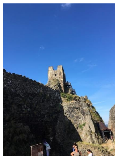
Obrázek 4 Pohled na věž Baba (Autorka)

Okolo roku 1428 se na hradě vyskytl mohutný požár, který poničil velkou část hradu. Přelomem let 1437-1438 se hradu zmocnili loupežníci ve vedení rytíře Kryštofa Šofa z Helfenburgu. Říká se, že na hradě zajali i samotného Otu z Bergova (který byl dosavadním vlastníkem hradu). V rukou zbojníků byly Trosky až do roku 1444, poté byl Šof se svou družinou donucen hrad opustit. 80