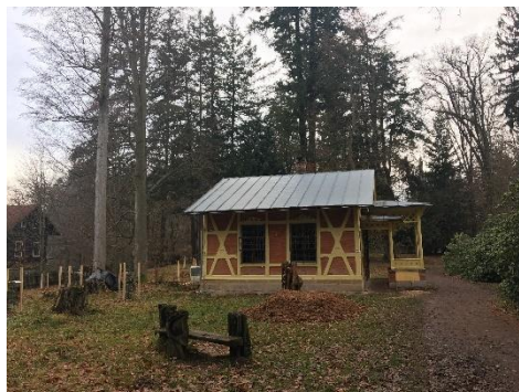
Obrázek 2 Budova informačního střediska

Arboretum se nachází nedaleko hradu Valdštejn. Tento lesní park byl založen v období první republiky Hansem Lexou z Aehrenthálu, který v té době vlastnil hruboskalské panství. Listnaté a jehličnaté stromy, které zde nechal vysadit, mají svůj původ v Severní Americe.