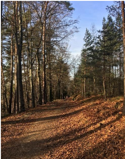
Obrázek 17 Cesta ke Kopicovu statku