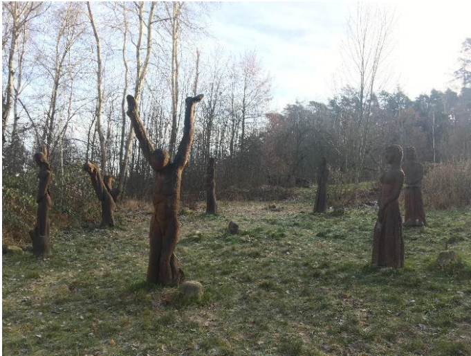
Obrázek 10 Dřevěné sochy při vstupu na Zlatou stezku (Autorka)