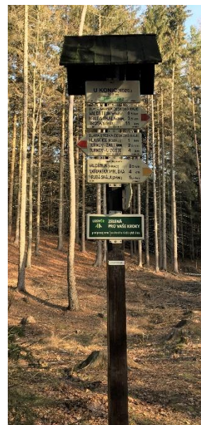
Obrázek 13 Rozcestník U Konic

O necelých 500 metrů dále se nachází další zastávka naší trasy, a to hrad Valdštejn. Před samotným vstupem do objektu je možné navštívit Hospodu Na Valdštejně, která se nachází na prostranství před mostem vedoucím k hradu. Kamenný most (obr. 14) je obohacen šesti sochami českých patronů. Pro prohlídku areálu je výhodné si zaplatit službu průvodce. S průvodci v tomto místě mám pouze kladné zkušenosti, proto bych tuto formu prohlídky hradu doporučila. Pro rodiny s dětmi hrad nabízí speciální průvodcovské služby. Hrad poskytuje tzv. prohlídky s loupeživým rytířem, či princeznou, které využívají pomoc dětí k najetí tajného pokladu a zlomení zlé kletby. Při exkurzi navštívíme kapli sv. Jana Nepomuckého (obr. 15), kde uvidíme sochu sv. Markéty, sv. Jana Nepomuckého, ale i ztvárnění sv. Vojtěcha. Dále na hradě můžeme navštívit kapličku sv. Jana Křtitele, klasicistní dům, Aehrenthalský palác, pozůstatky romantického paláce, a nakonec okouzlivou vyhlídku na Český ráj. Celá prohlídka by nám odhadem měla zabrat maximálně 1 hodinu.