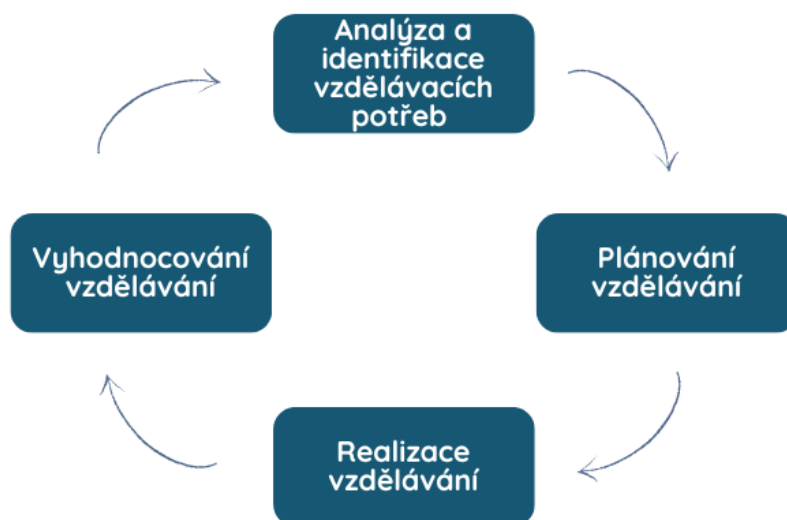
Obr. č. 1: Fáze systému vzdělávání (Bartoňková, 2010, s. 110, upraveno)

Jak již bylo řečeno, jedná se o neustále se opakující cyklus, což můžeme vidět také na obrázku výše. Zkušenosti z předchozích cyklů jsou pak využívány v dalších cyklech, díky čemuž se může vzdělávání soustavně zlepšovat. Do systému vzdělávání spadá orientace a adaptace pracovníka, doškolení, přeškolení i rozvoj (Bartoňková, 2010, s. 109–110). V rámci systematického vzdělávání pracovníků jsou klíčovými především fáze identifikace vzdělávacích potřeb, plánování vzdělávání a vyhodnocování výsledků vzdělávání a účinnosti vzdělávacího programu i metod. Jedná se o fáze, které rozhodují o podobě vlastního procesu vzdělávání a účinnosti v dalších cyklech vzdělávacího procesu (Koubek, 2006, s. 246).