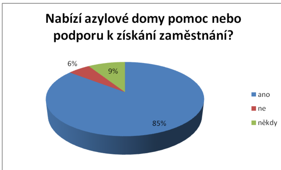
Graf č. 2

Celkem 85% (47 respondentů) uživatelů odpovědělo, že jim azylový dům poskytl pomoc nebo podporu, aby mohli získat zaměstnání, a dalších 9% (5 respondentů) uvedlo, že jim pomoc či podpora byla poskytnuta alespoň někdy. Pouhých 6% (3 respondenti) sdělilo, že jim tato pomoc či podpora nebyla azylovým domem poskytnuta.