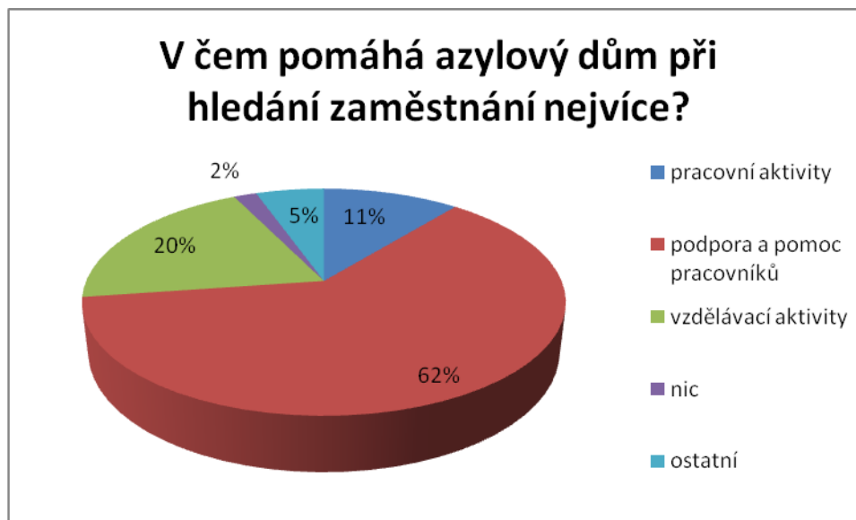
Graf č. 3

Větší polovině uživatelů azylových domů pomáhá při hledání zaměstnání nejvíce podpora a pomoc pracovníků (32 respondentů – tj. 62%). Jedna pětina uživatelů (11 respondentů – tj. 20%) odpověděla, že jim nejvíce pomáhají vzdělávací aktivity v azylovém domě (např. různé kurzy, skupiny pro nezaměstnané, volnočasové aktivity, přístup na počítač). 11% uživatelů (6 respondentů) se vyjádřilo, že jim nejvíce v azylovém domě pomáhají pracovní aktivity. Jeden uživatel (tj. 2%) odpověděl, že mu v azylovém domě při hledání zaměstnání nepomáhá nic. Zbývajících 5% uživatelů na tuto otázku napsalo, že neví (1 respondent), nebo neodpověděli (2 respondenti).