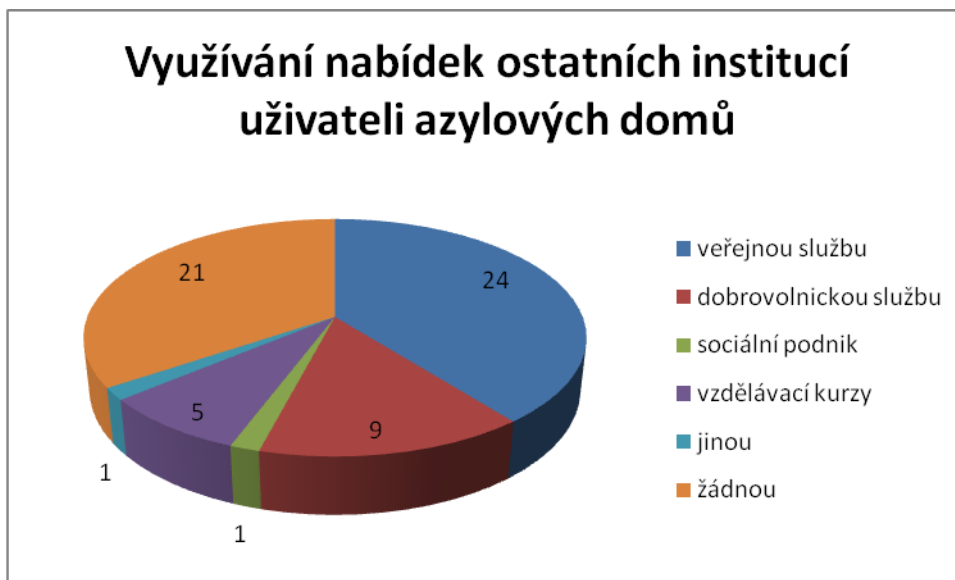
Graf č. 5

V odpovědi na otázku č. 5 mohli respondenti zvolit i více než jen jednu odpověď.