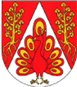
Obrázek 1 Znak obce Jičíněves