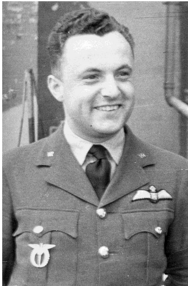
E. Fotografie Bedřicha Krátkorukého