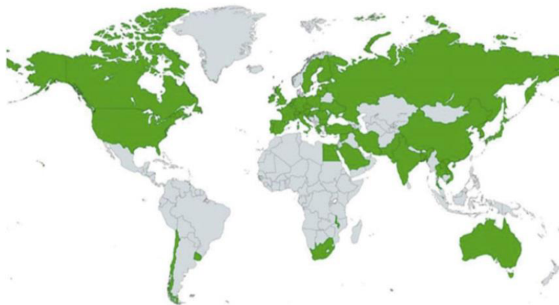
Krajiny produkujúce priemyselné konope

V súčasnosti je do svetového obchodu s konope zainteresovaných viac ako 30 krajín. Je to kvôli schopnosti pestovania v prostredí bez pesticídov a herbicídov a tomu že, konope je badateľne odolné voči hlodavcom, hubám a rôznym druhom burín. Má široký geografický rozsah pestovania a viacúčelové využitie (Karche T., Singh M.R., 2019). Podľa štatistík FAO (2018), 3 hlavné krajiny produkujúce konope podľa produkčnej oblasti sú Kanada (555 853 ha), Severná Kórea (21 247 ha) a Francúzsko (12900 ha). Vyžaduje si podobnú prípravu pôdy ako pre iné rastliny s pH 6 – 7,5. Dobre rastie na sypkých, dobre priepustných hlinitých pôdach s priemernou teplotou medzi 16 až 27°C (Faiz A., Zahidul I., 2022).