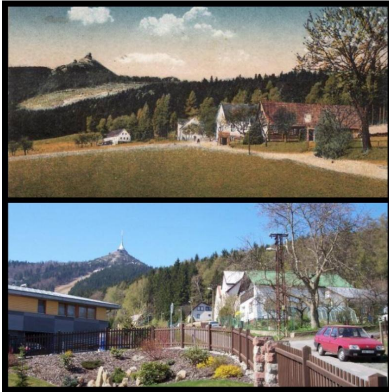
obr. č. 6: Konec Liberce

Horní obrázek působí více idylicky, rozlehlé louky dávají pocit volnosti. Barevné květiny se začínají probouzet na jaře a hluboký les za domem slibuje příjemné ochlazení. Stejně místo v jiném čase. Jiná kultura, jiné zvyky. Podle mne i rozdílný genius loci.