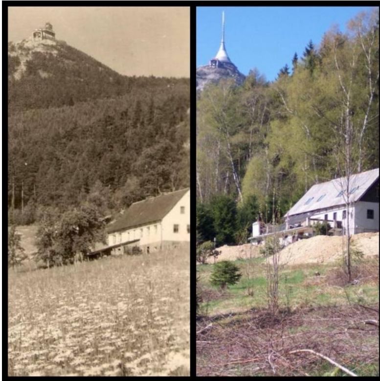
obr. č. 3: Horní Hanychov, samota

Rozlehlá pole, malé domky, které nejsou ve stráni skoro vidět, statky, které dávají příslib čerstvého mléka a vajíček, louky, které voní a hrají v létě tisíce barev. Krásné výhledy, které můžete zažít jen na úpatí sjezdovky pod Ještědem, kde se Hanychov nachází. Slunce, které je tak blízko, že máte pocit, že se ho můžete dotknout. Klid, soustředěnost a pomalé plynutí času ve vesnici, která je v této době nad městem, které je v pohybu. Široké cesty, které splývají s loukou. Žádné ostré ploty, které příkře dělí hranici pozemku. Jen dřevěné nenápadné plůtky, které zapadají do krajiny. Ovocné stromy voní kolem cest a člověk má pocit, že je uprostřed ráje. Horní Hanychov působí velmi idealisticky. Malá horská vesnička, na jejímž pozadí se vždy hrdě tyčí Ještěd. Místní obyvatelstvo je rozděleno na dva tábory. Na Čechy a na německou část obyvatel. Když popisujeme vesnici Horní Hanychov, musíme mít na paměti, že to je německá vesnička, v českém pojetí neexistuje, jelikož se později stala součástí Českého Liberce.