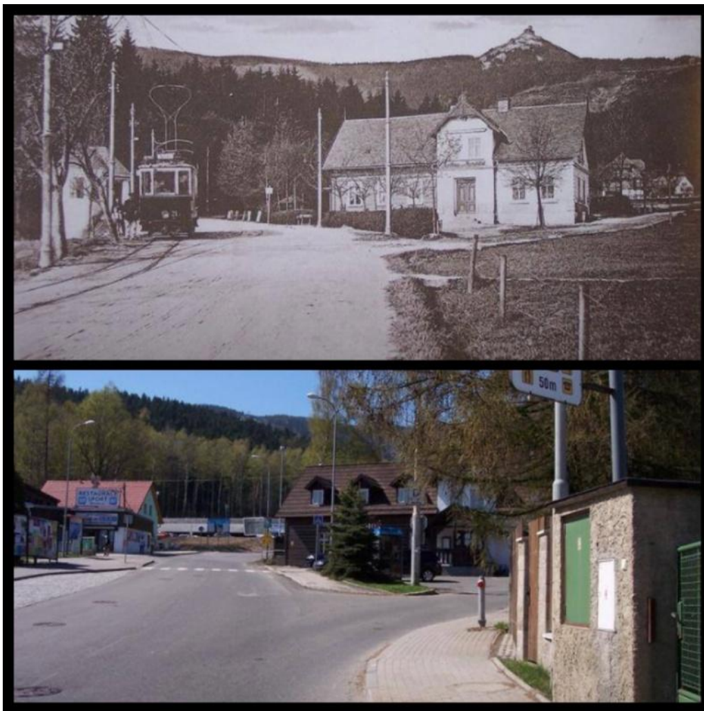
obr. č. 2: Liberec dříve a dnes

obohacovala zdejší krajinu. Dnes cítíme genia loci z historie, která je tu všude přítomná. Při analýze genia loci hraje velkou úlohu architektura. 60 „Člověk potřebuje symboly, tj. umělecká díla, která reprezentují životní situace“ 61 Na architektuře místa můžeme vidět dějiny. Architektura spadá do kategorie prostoru, který je úzce spjatý s charakterem místa. Charakter nám udává celkovou atmosféru Liberce. Jak již píšou na začátku, Liberec je město v pohybu, které prochází velkou změnou v dějinných epochách. 62