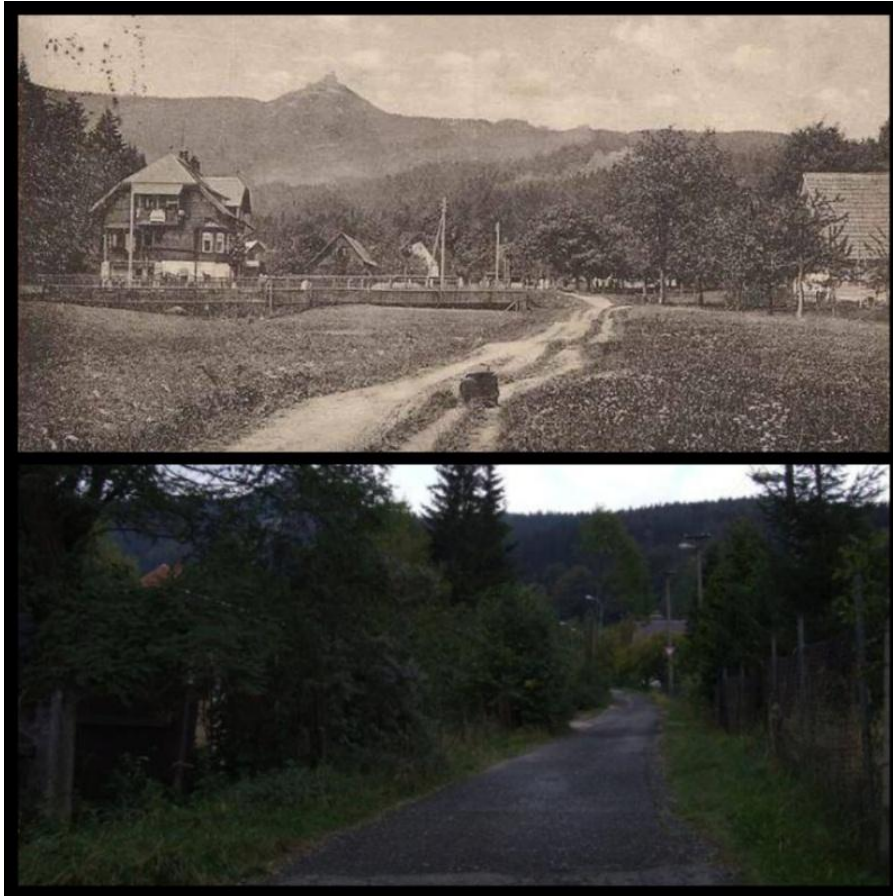
obr. č. 7: Cesta

Posledním obrázkem, na kterém bych ráda poukázala rozdílnost atmosféry stejného místa, je cesta. Udržované louky, prašná cesta a krásný domek. V dálce tyčící se Ještěd, bez své známé věže. Poklidná atmosféra samoty, idylická až skoro romantická krajina, ze které dýchá život. Když si prohlížím obrázek, mám pocit, jako kdybych čekala, až na prašné cestě uslyším koňská kopyta a povoz. Toto je jedna z mnoha tváří Reichenbergu. Na dolním obrázku ze současnosti je neudržovaná asfaltová cesta. Okolní stromy podél cest skrývají domek, který tam stojí dodnes. Není vidět ani Ještěd, dalo by se říci, že to je obyčejná cesta kdekoliv na světě. Úplně postrádá jakýkoliv náznak dřívější atmosféry či dokonce genia loci.