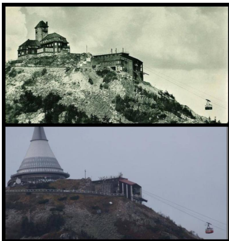
obr. č. 1: Pohled na Ještěd

Dále pak velké trhy, které jsou pro město typické, krásná radnice, rozlehlé vilky s krásnými zahrádky. Rozlehlé parky, ve kterých život jakoby utichl a zpomalil se. 53