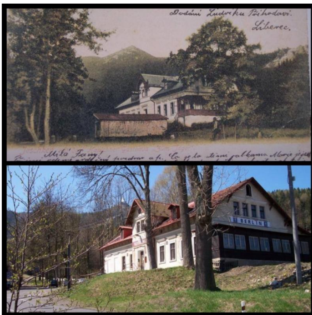
obr. č. 5: Železnice

Dalším obrázkem je konec Liberce. Duch místa na nás dýchá z obou obrázků. Horní část fotografie je záznam před druhou světovou válkou. Dolní část je z roku 2015. Jediným pojítkem obou obrázků jsou dva domky, které prošly velkou změnou, ale jsou stále na stejném místě. Ještěd v pozadí na dolním obrázku je zachycen tak, jak ho známe. Tím nezapomenutelným duchem Liberce je podle mne právě silueta věže, která tak dobře dotváří přírodní místo. Je skvělým ukončením daného kopce.