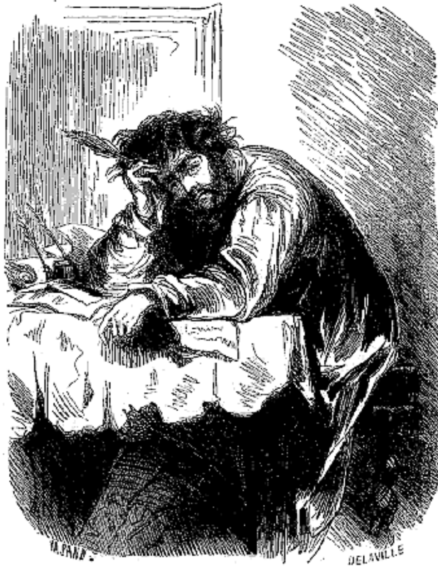
Horace... se livrait à des essais littéraires.