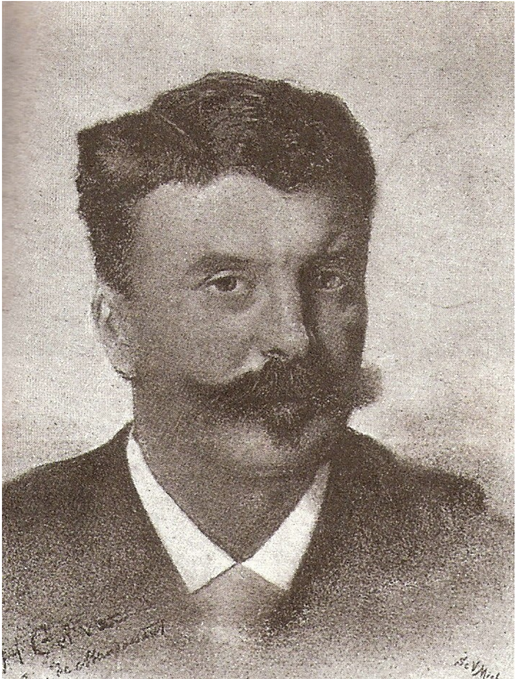
Annexe 7: Le portrait de Guy de Maupassant par Gervex