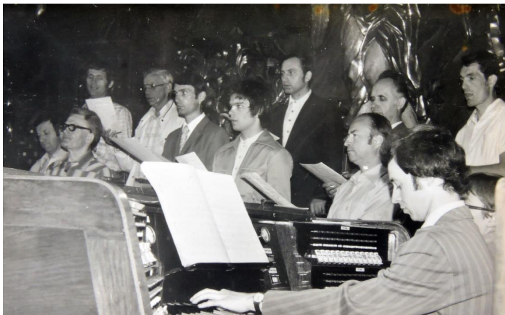
Obrázek 4: Fotografie z 2. 6. 1985 z provedení Missa in G od Františka Ignáce Antonína Tůmy v kostele sv. Jakuba v Praze