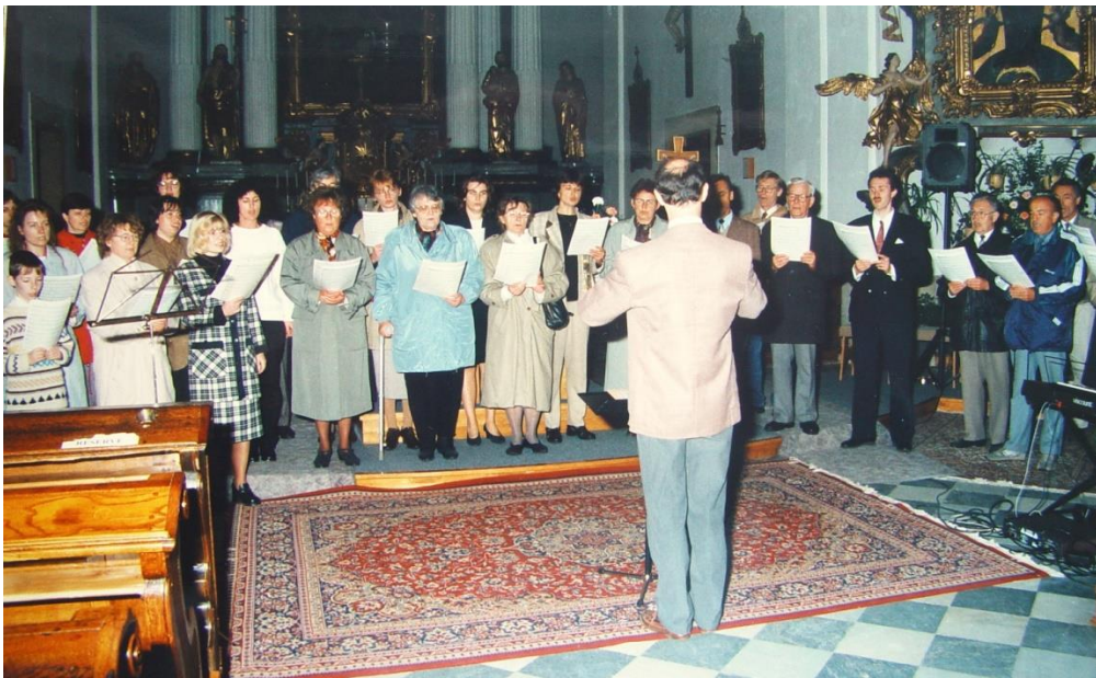
Obrázek 6: Vystoupení chrámového sboru v kostele Nanebevzetí Panny Marie v Ústí nad Orlicí v roce 1996