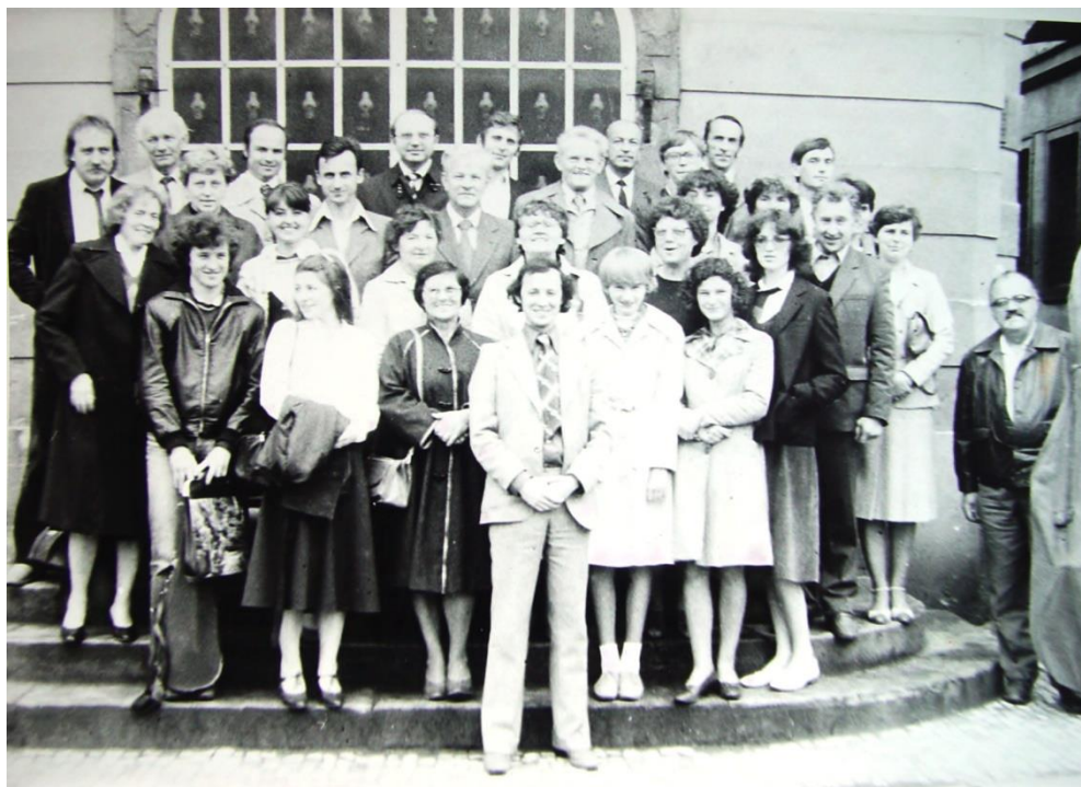
Obrázek 3: Chrámový sbor u kostela sv. Jakuba v Praze 2. 6. 1985