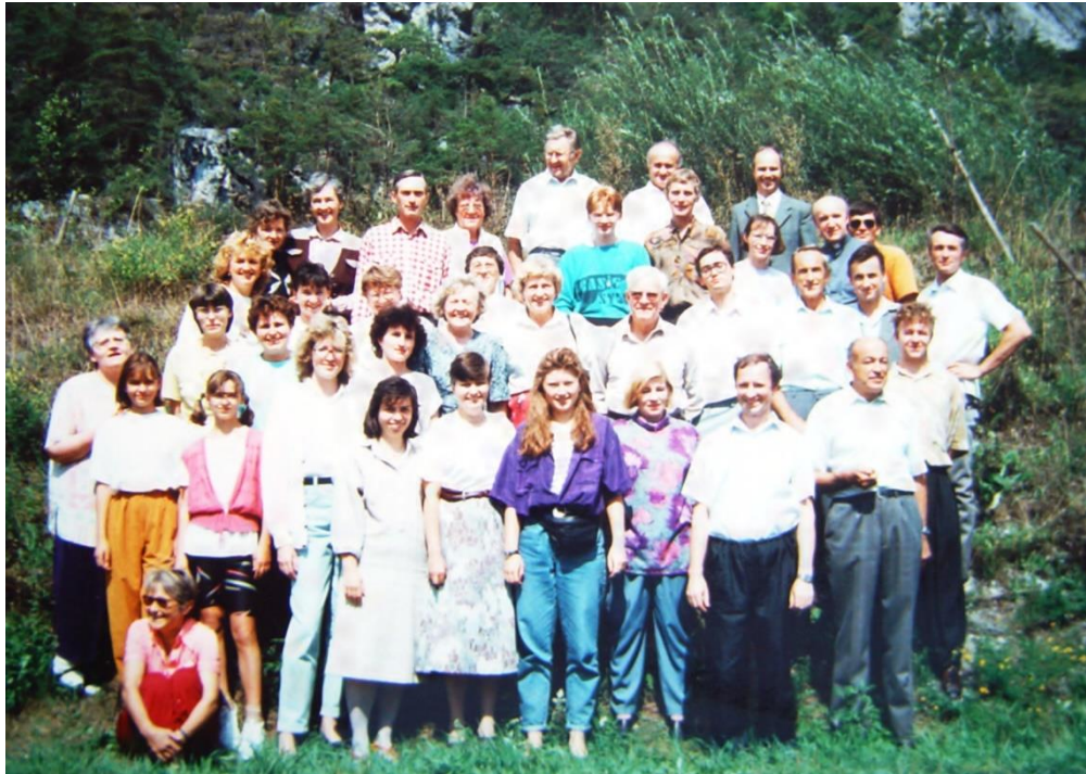
Obrázek 5: Společná fotografie sboru ze zájezdu do Švýcarska v roce 1994