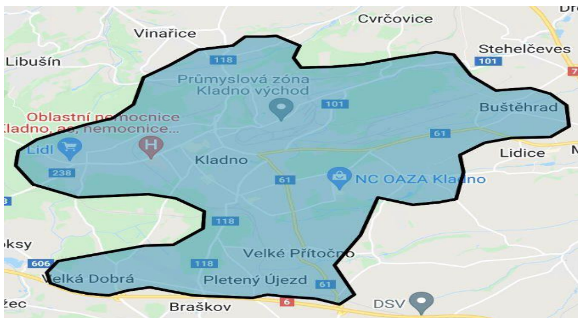
Obrázek 1: Rozvozová zóna