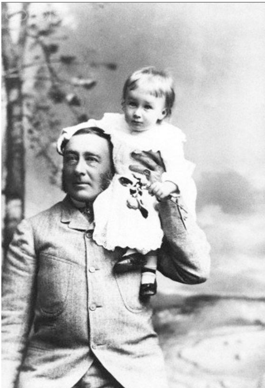
Příloha č. 1: Franklin Delano Roosevelt na rameni svého otce Jamese Roosevelta.

Zdroj: Nigel BLUNDELL, Franklin Delano Roosevelt , s. 7.