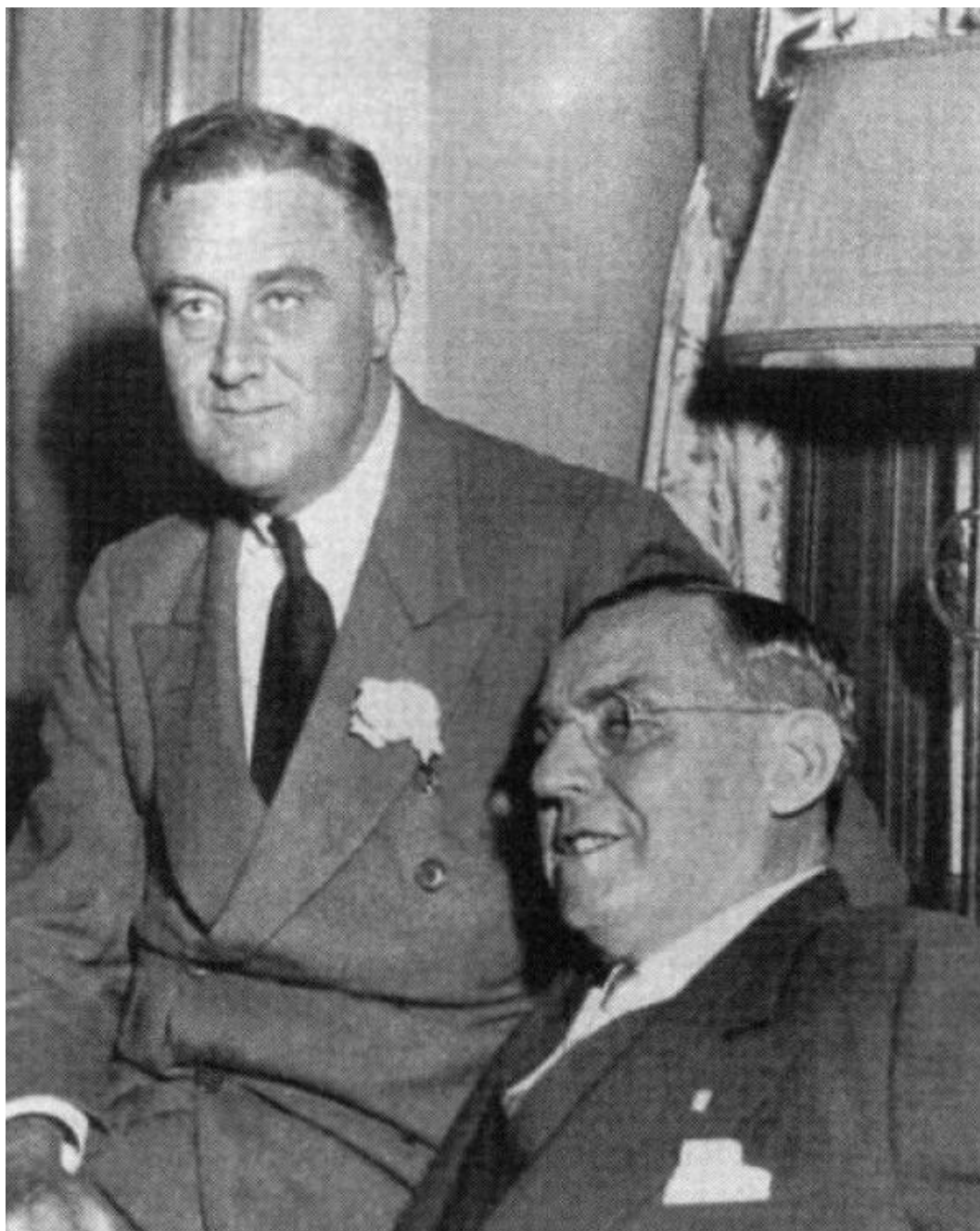
Příloha č. 8: F. D. Roosevelt s Antonínem Čermákem v roce 1932.