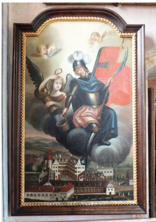
12. Neznámý autor, sv. Florián, 30. léta 18. století, olej, plátno, 110x65 cm, zámek Velké Losiny, kaple sv. Anděla Strážce