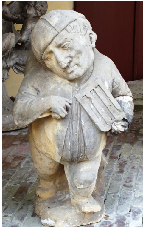
25. Neznámý autor, trpaslík hrající na rošt, 1742-1760, pískovec, zámek Velké Losiny, nádvoří