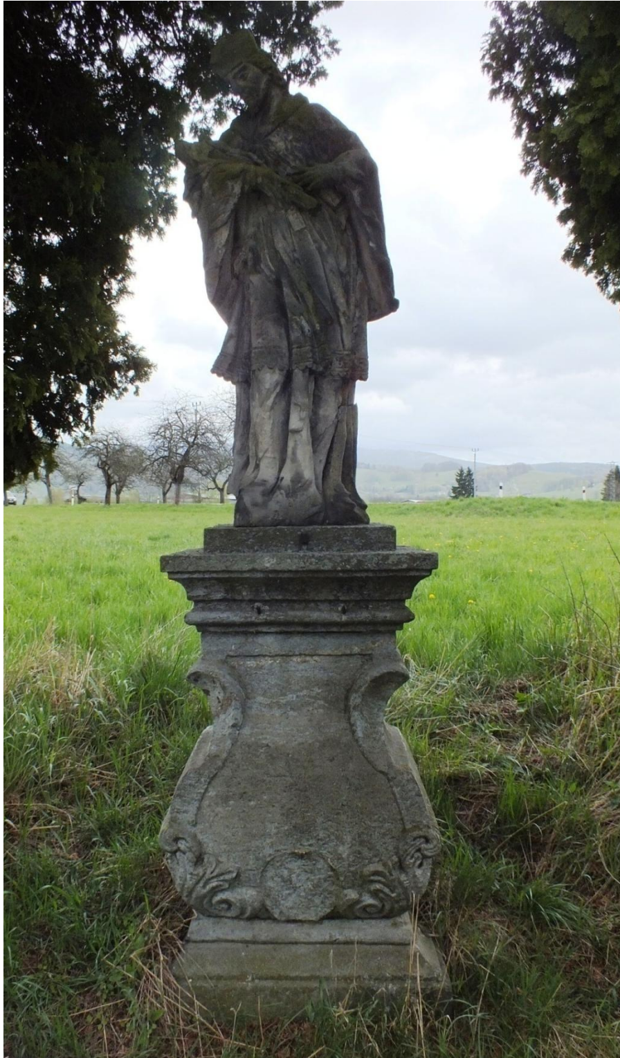
29. Sebald Kappler?, sv. Jan Nepomucký, 1734, pískovec, 165 cm, Velké Losiny, ulice Bukovská