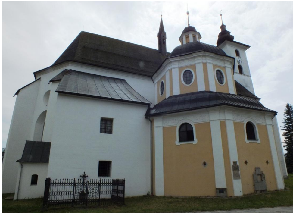
9. Neznámý autor, kaple sv. Kříže, 1725, Velké Losiny, kostel sv. Jana Křtitele, severní strana lodi