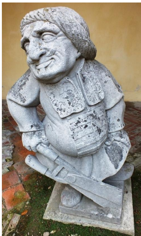
23. Neznámý autor, trpaslík se zahradními nůžkami, 1742-1760, pískovec, zámek Velké Losiny, nádvoří