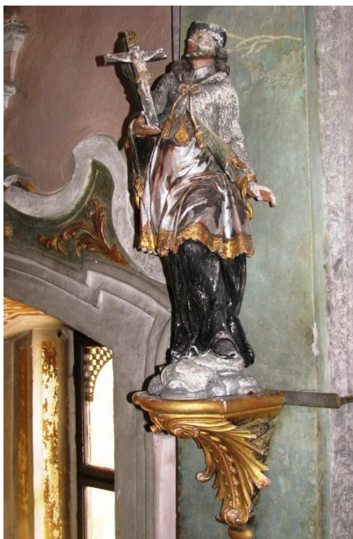
42. Neznámý autor, sv. Jan Nepomucký, 40. léta 18. století, zámek Velké Losiny, kaple Panny Marie Starobrněnské