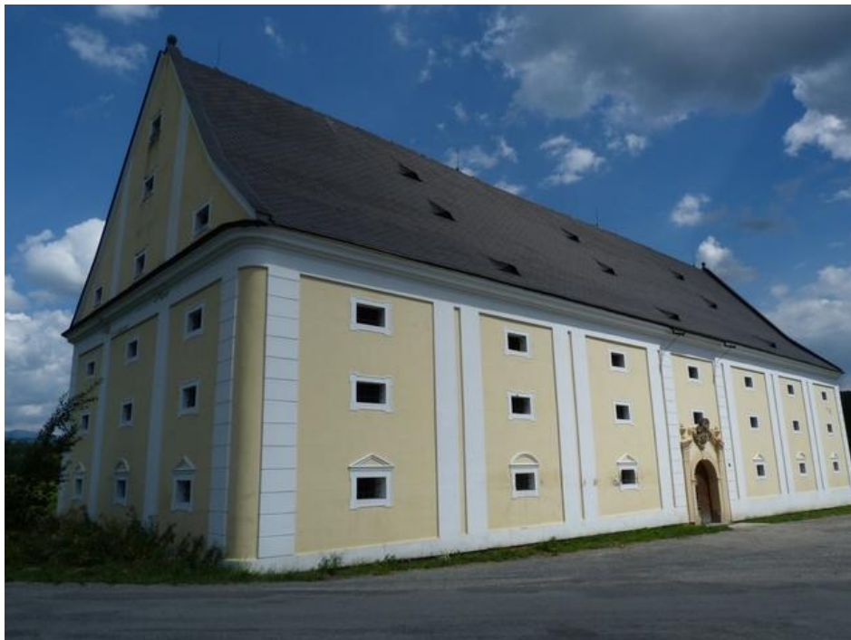
10. Neznámý autor, sýpka, 1729-1730, Velké Losiny, směr Žárová, jižní průčelí