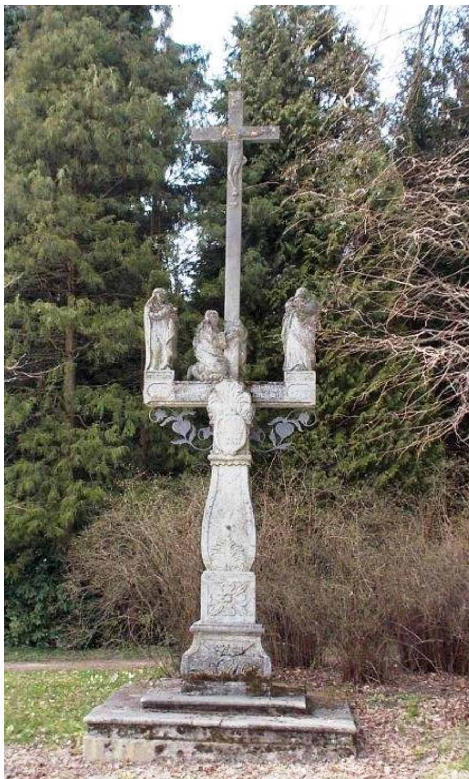
8. Sebald Kappler, Kalvárie, 1725, krupník, Velké Losiny, ulice Komenského