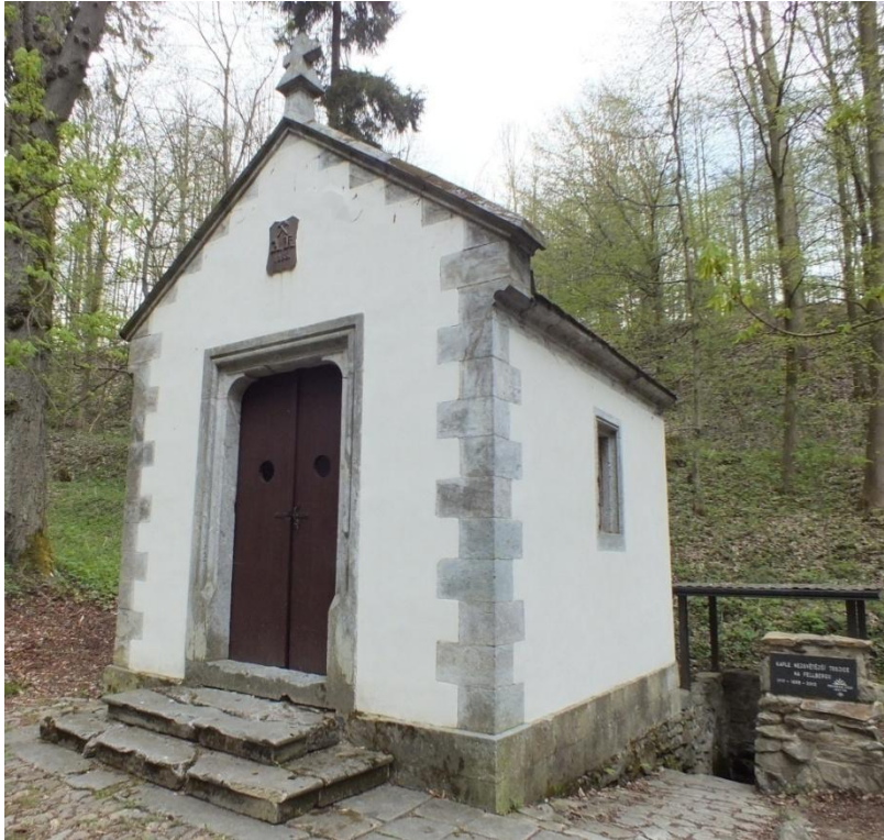
4. Neznámý autor, kaple Nejsvětější Trojice, 1717, Maršíkov, na svahu Kožušné