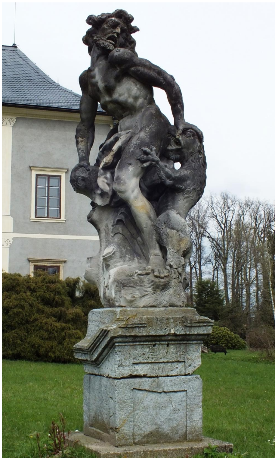
16. Jan Jiří Lehner, alegorie Bolesti, 1734, pískovec, okolo 230 cm, zámek Velké Losiny, park