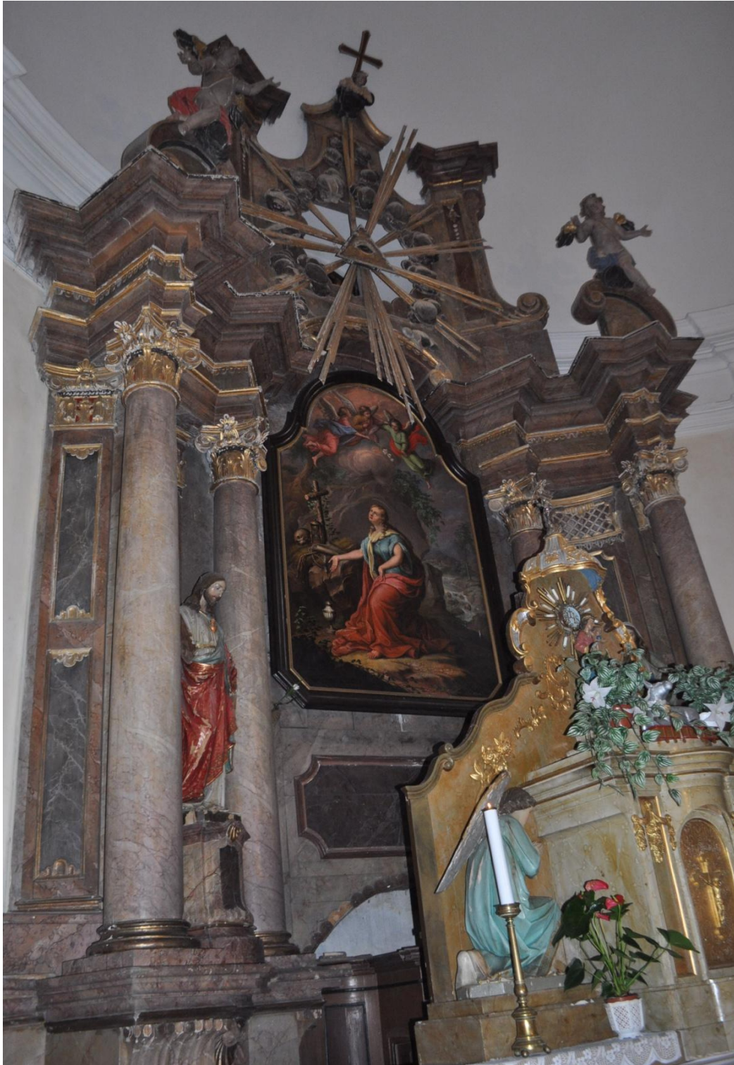
59. Ignác Raab (přemalba Antonín Aust), sv. Máří Magdaléna, po roce 1777, olej, plátno, Pusté Žibřidovice, kostel sv. Máří Magdalény