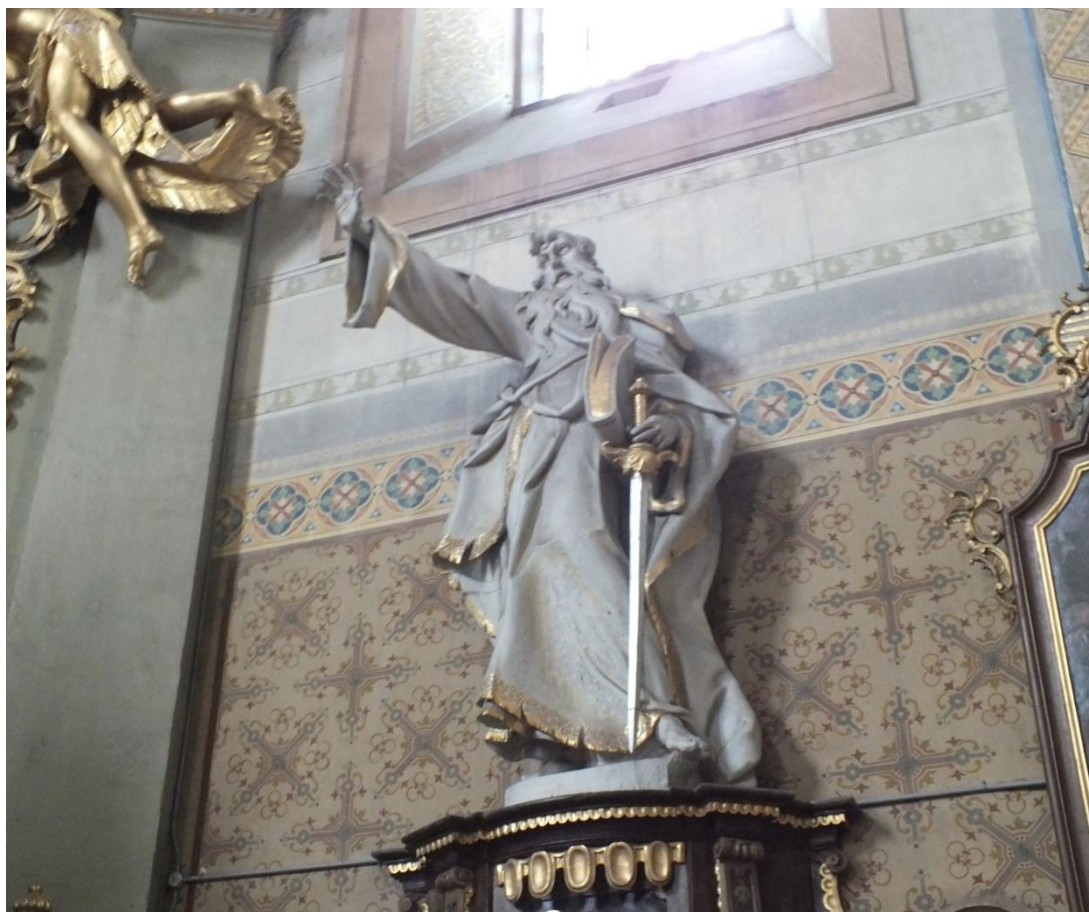
53. Franz Ignaz Günther, sv. Pavel, 1751-1753, Kopřivná, kostel Nejsvětější Trojice, presbytář