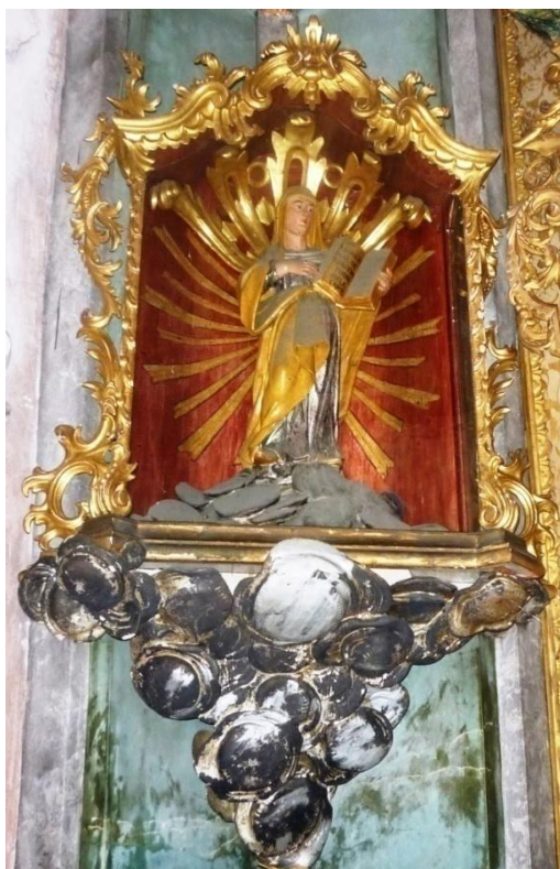
40. Neznámý autor, sv. Anna, 40. léta 18. století, zámek Velké Losiny, kaple Panny Marie Starobrněnské