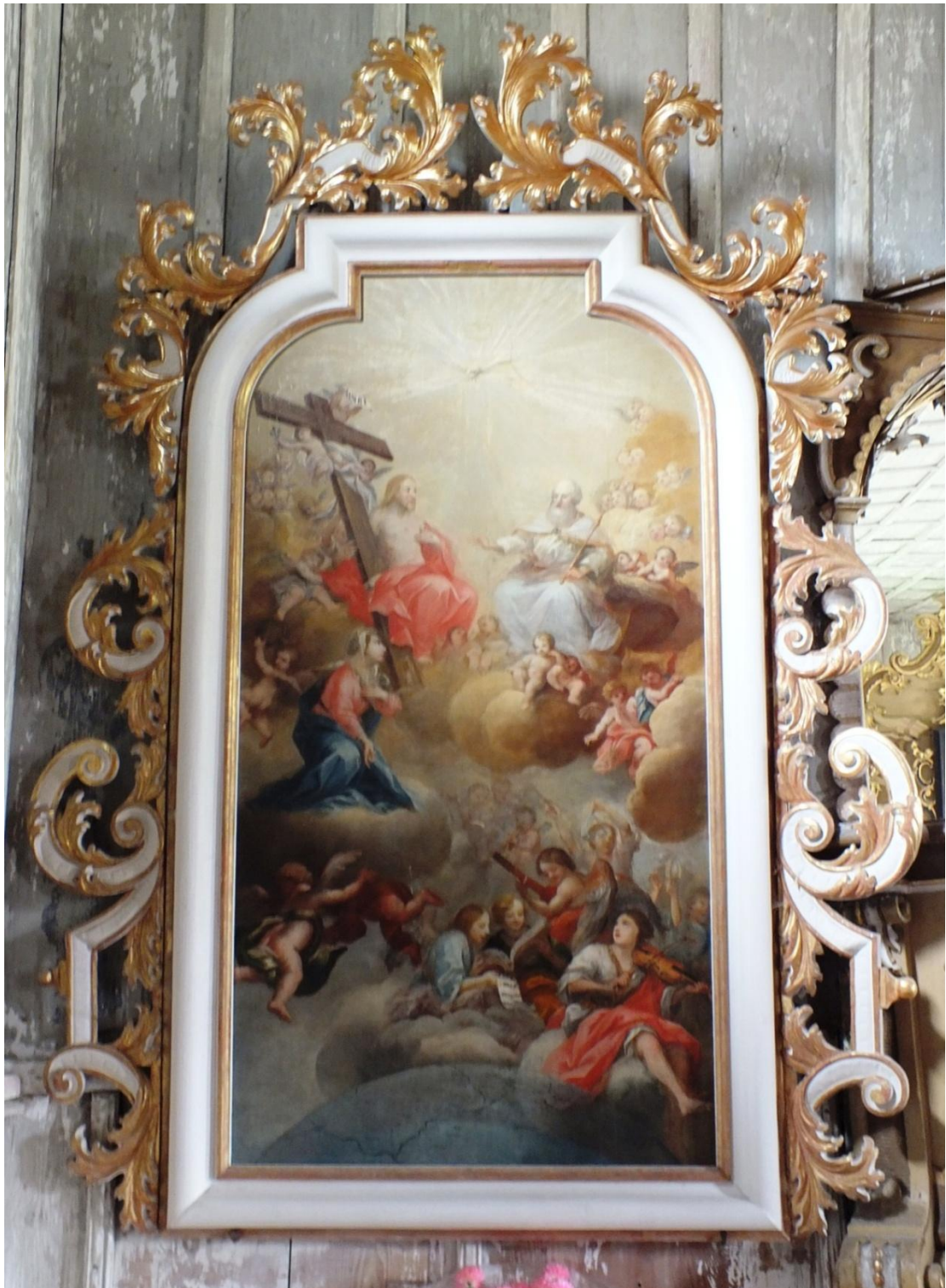
6. Neznámý autor, Nejsvětější Trojice, 1720, olej, plátno, 210x107 cm, Maršíkov, kostel sv. Michaela