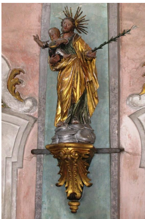
43. Neznámý autor, sv. Josef s Ježíškem, 40. léta 18. století, zámek Velké Losiny, kaple Panny Marie Starobrněnské