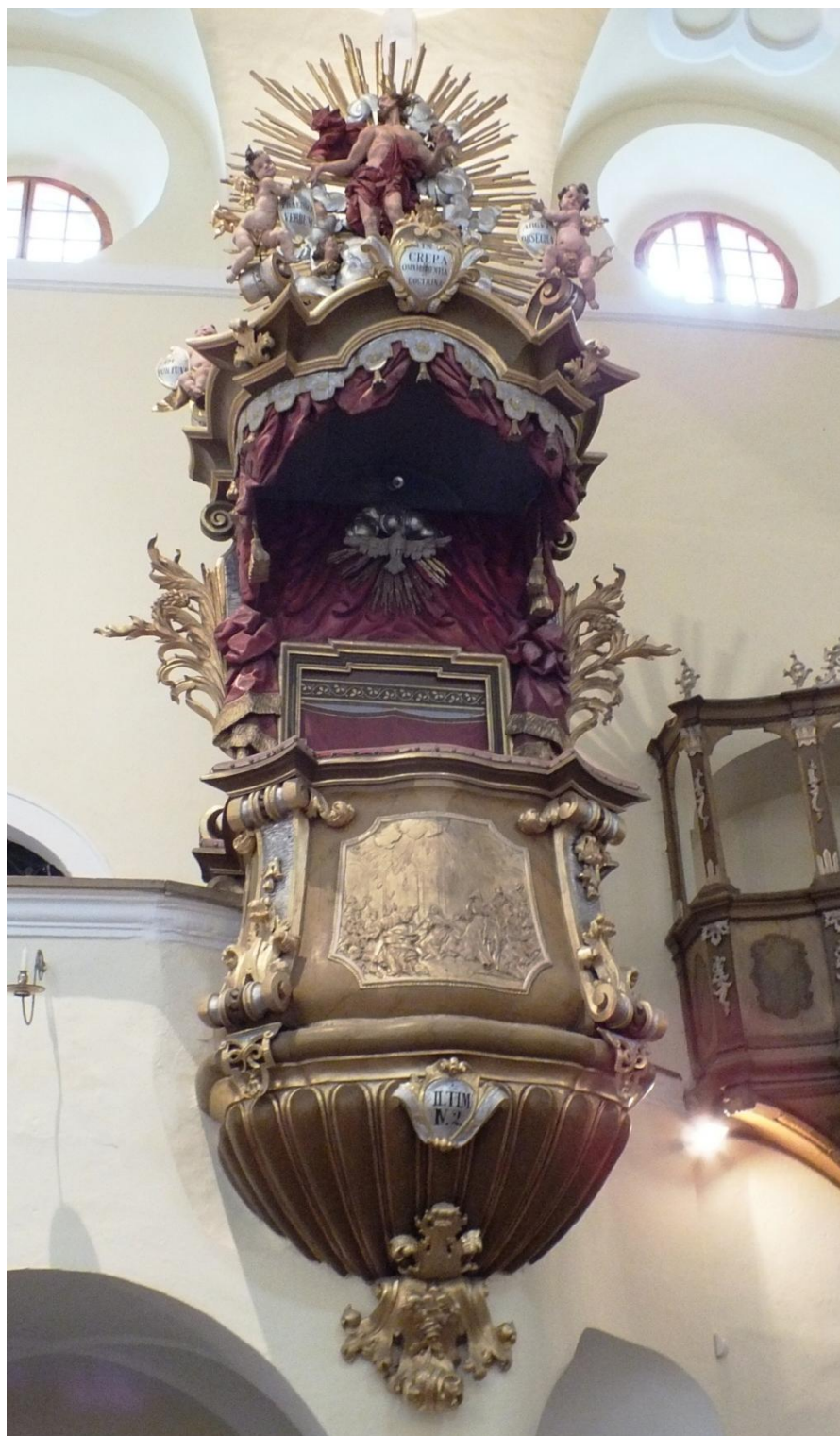
27. Jiří Antonín Heinz, kazatelna, 1734, 650 cm, Velké Losiny, kostel sv. Jana Křtitele