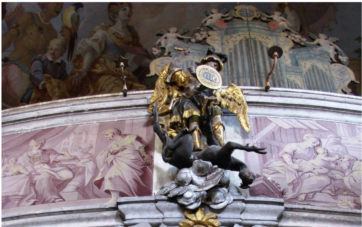
39. Antonín Winterhalder, archanděl Michael, 1742, zámek Velké Losiny, kaple Panny Marie Starobrněnské