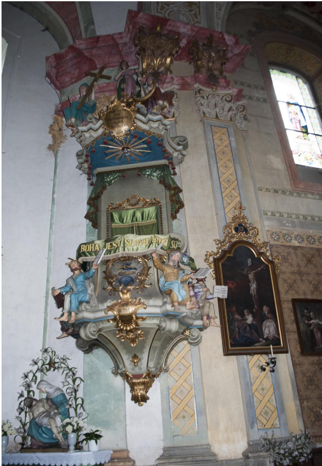
58. Neznámý autor, kazatelna, polovina 50. let 18. století, Kopřivná, kostel Nejsvětější Trojice