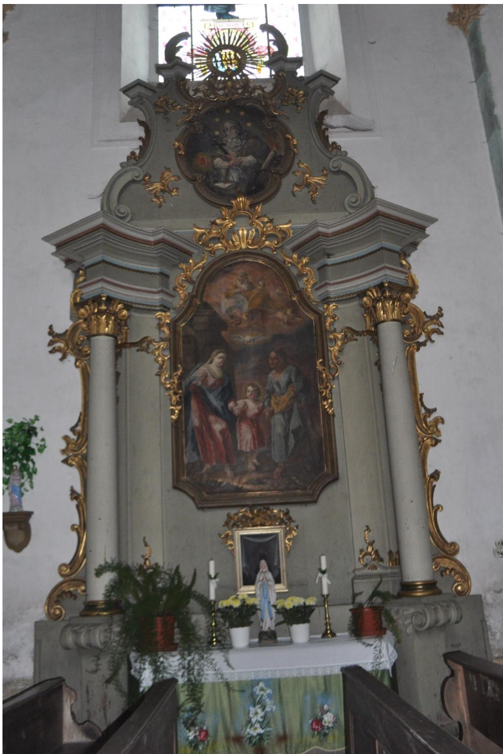
55. Jakub Zink, sv. Rodina a sv. Jan Nepomucký, 50. léta 18. století, olej, plátno, Kopřivná, kostel Nejsvětější Trojice