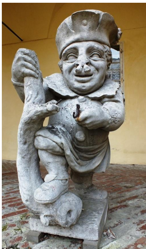
22. Neznámý autor, trpaslík s řepou, trpaslík opírající se o kmen 1742-1760, pískovec, zámek Velké Losiny, nádvoří