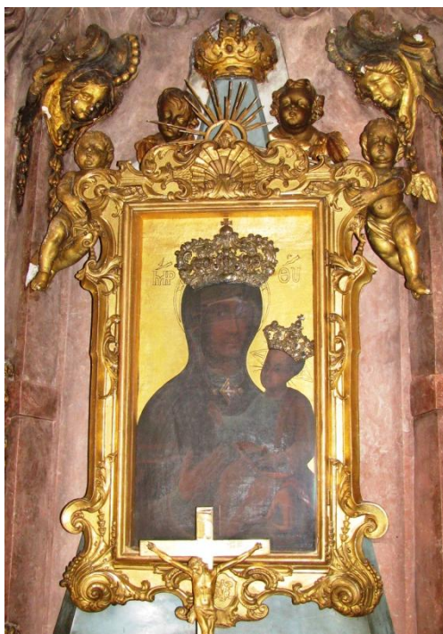
32. Neznámý autor, Panna Marie Starobrněnské, 40. léta 18. století, olej, plátno, zámek Velké Losiny, kaple Panny Marie Starobrněnské