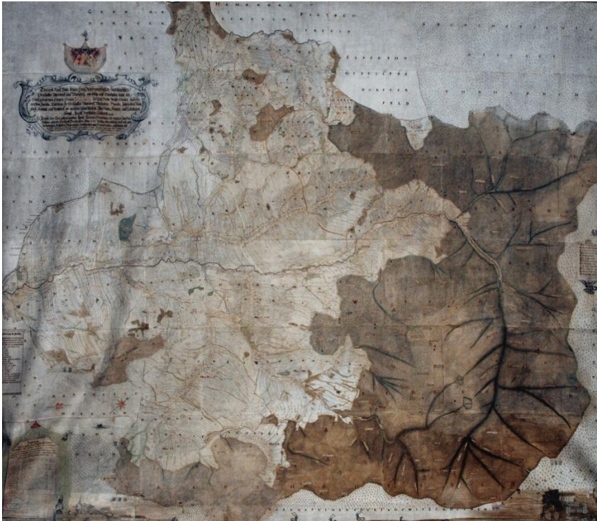
31. Christoph Glaubitz, mapa, 18. března 1739, papír, tuš, 336x287 cm, zámek Velké Losiny, vstupní sál