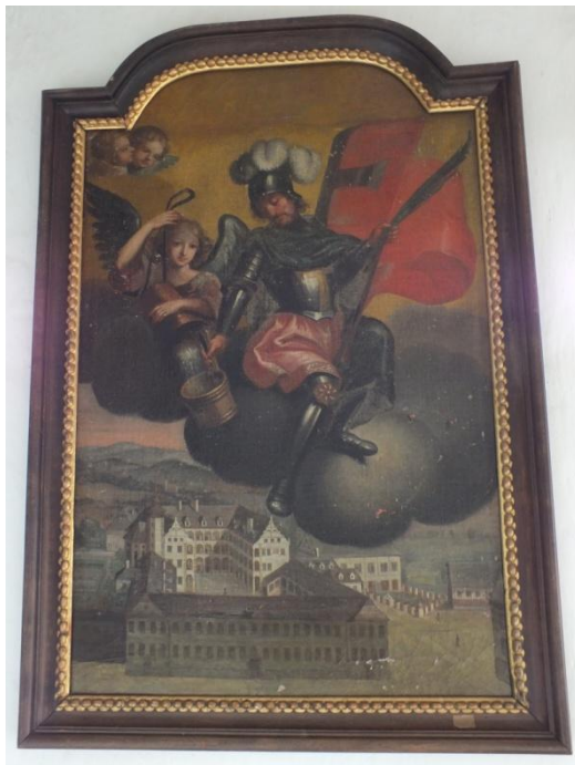
13. Neznámý autor, sv. Florián, 30. léta 18. století, olej, plátno, 104x65 cm, zámek Velké Losiny, chodba mezi vysokým zámkem a empírovým křídlem