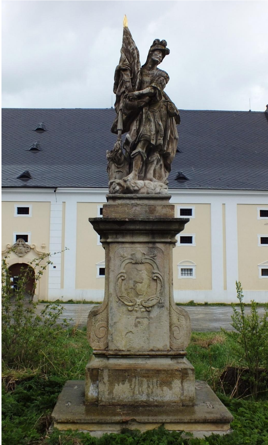
11. Neznámý autor, sv. Florián, 1729-1730, pískovec, 230 cm, Velké Losiny, směr Žárová, před sýpkou