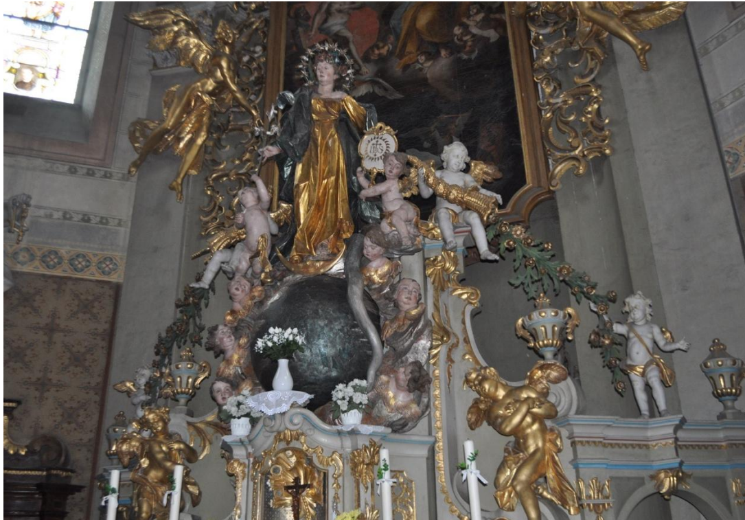
52. Franz Ignaz Günther, detail oltáře Panny Marie Immaculaty, 1751-1753, Kopřivná, kostel Nejsvětější Trojice, presbytář