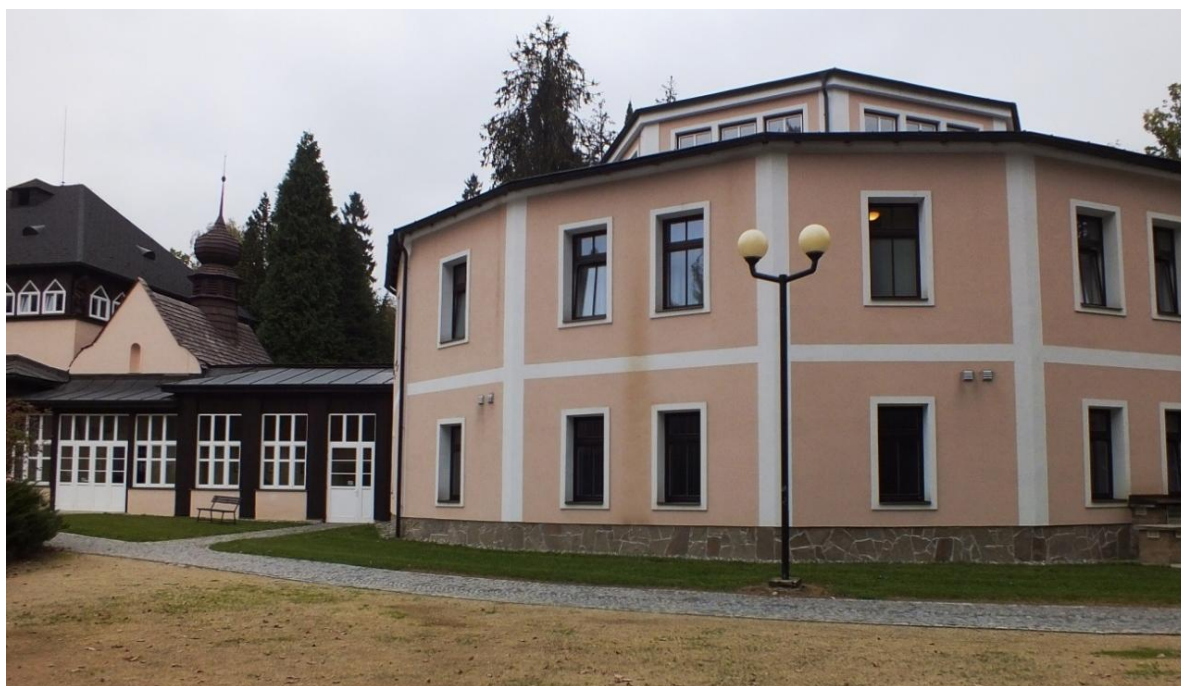
35. Neznámý autor, lázeňská budova, 1741, Velké Losiny, lázeňský park