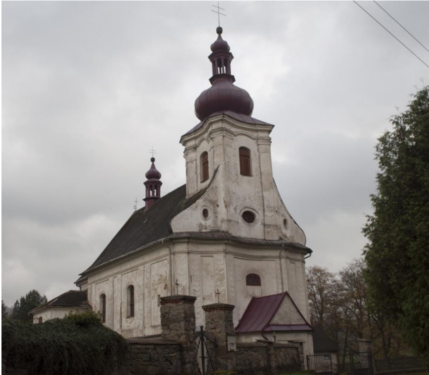
30. Neznámý autor, kostel sv. Máří Magdalény, 1735, Pusté Žibřidovice