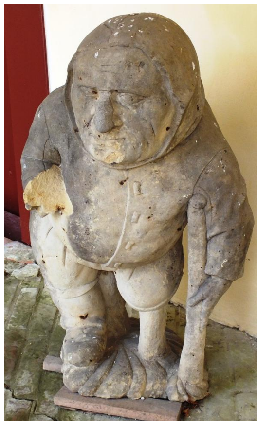
26. Neznámý autor, trpaslík s vědrem, trpaslík v kápi opírající se o hůl, 1742-1760, pískovec, zámek Velké Losiny, nádvoří