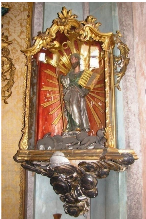
41. Neznámý autor, sv. Jáchym, 40. léta 18. století, zámek Velké Losiny, kaple Panny Marie Starobrněnské