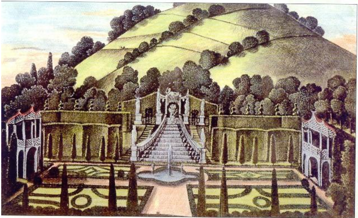
14. L. Dittman, pohled na velkou kaskádu ve velkolosinské zámecké zahradě, okolo roku 1800, Vlastivědné muzeum v Šumperku