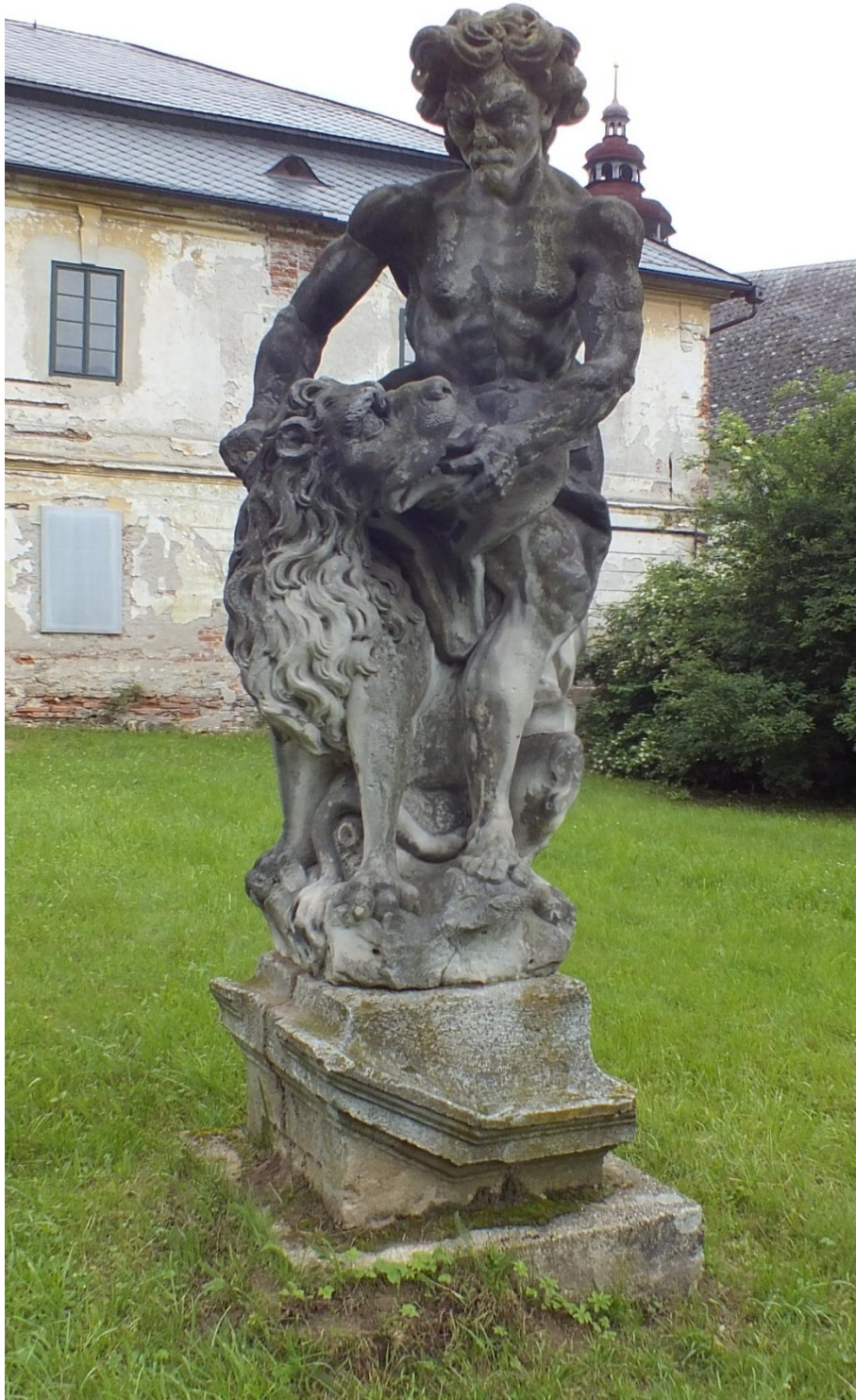
17. Jan Jiří Lehner, alegorie Síly, 1734, pískovec, okolo 223 cm, zámek Velké Losiny, park