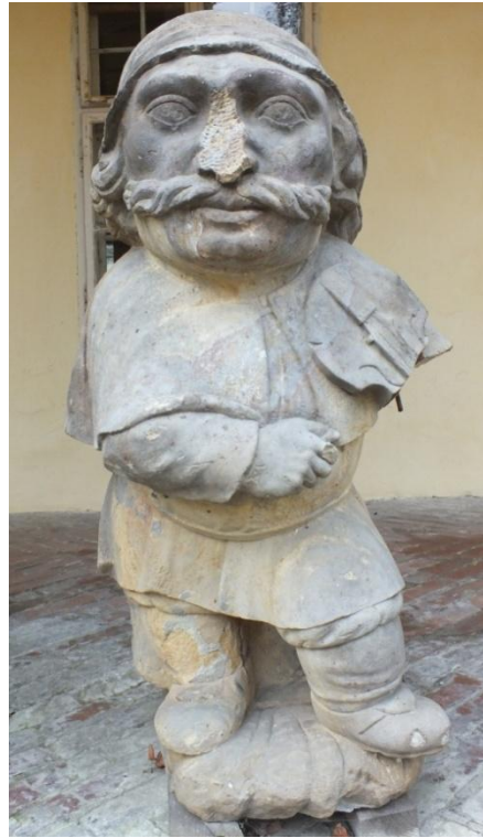
24. Neznámý autor, trpaslík hrající na dudy, trpaslík s houslemi, 1742-1760, pískovec, zámek Velké Losiny, nádvoří