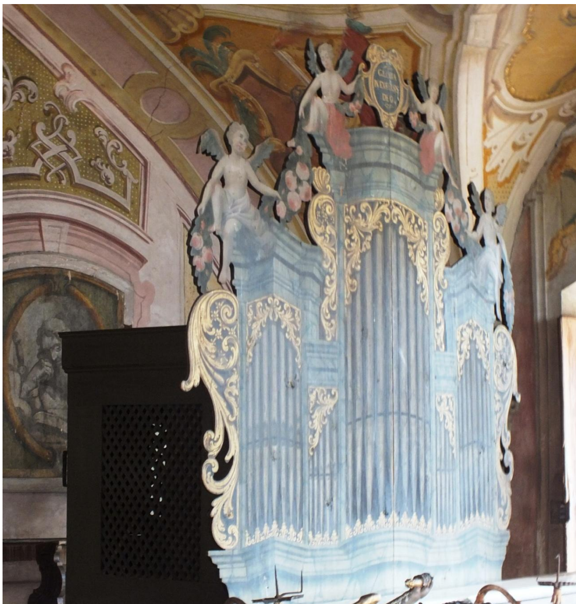
7. Neznámý autor, varhany, 1723, zámek Velké Losiny, kaple Panny Marie Starobrněnské, hudební kruchta