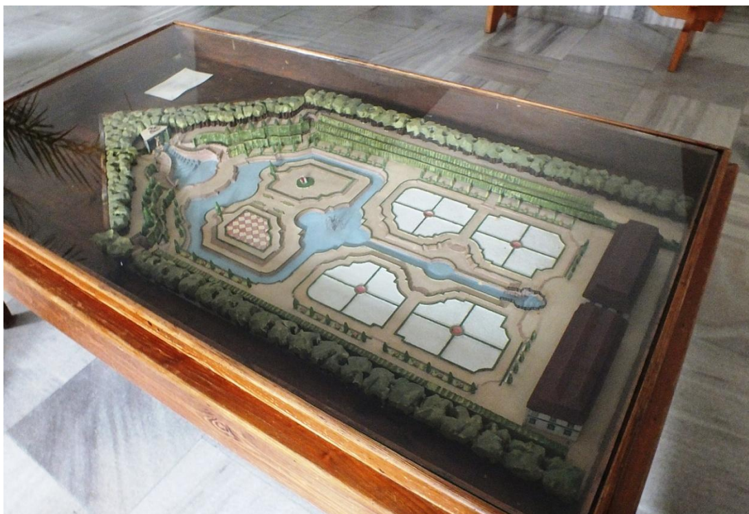
15. Neznámý autor, model zahrady, okolo roku 1800, zámek Velké Losiny, vestibul