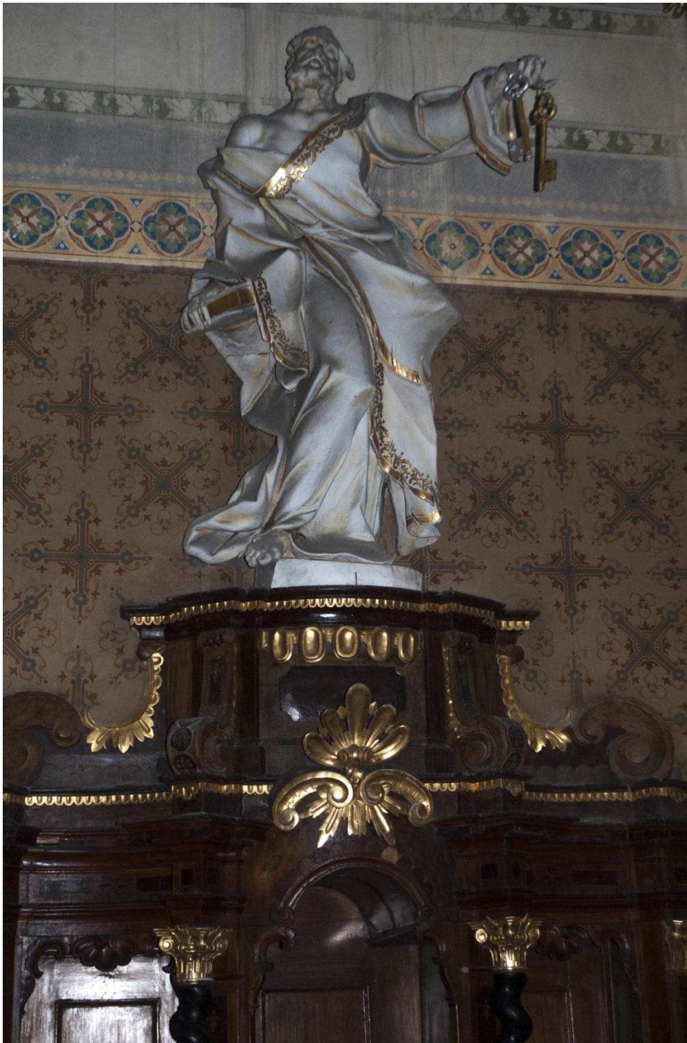
54. Franz Ignaz Günther, sv. Petr, 1751-1753, Kopřivná, kostel Nejsvětější Trojice, presbytář