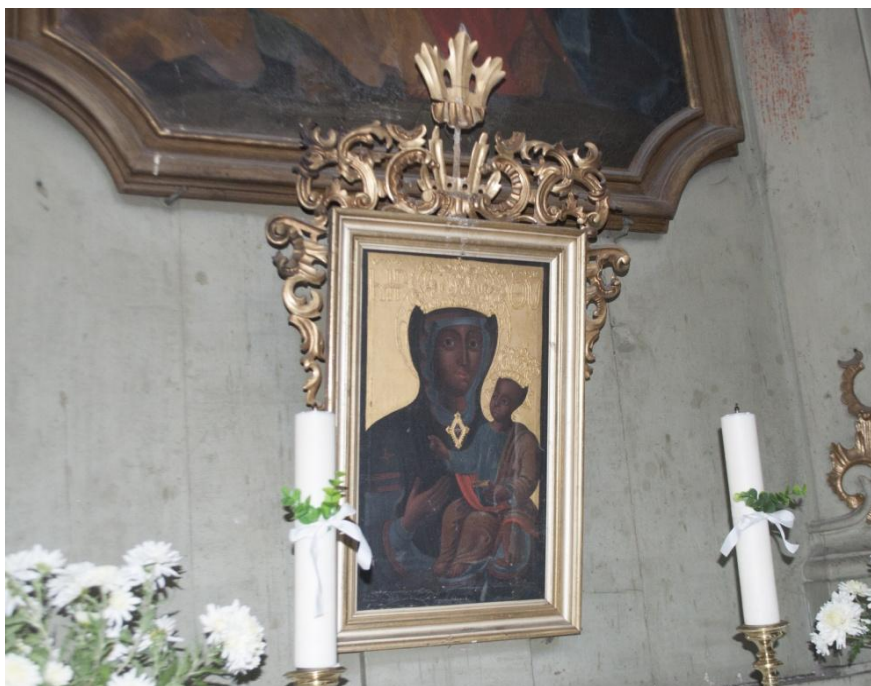
34. Neznámý autor, Panna Marie Starobrněnské, 40. léta 18. století, olej, plátno, Kopřivná, kostel sv. Nejsvětější Trojice