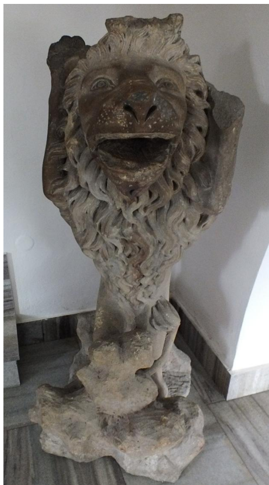
21. Neznámý autor, lvi, 40. léta 18. století, pískovec, zámek Velké Losiny, vestibul