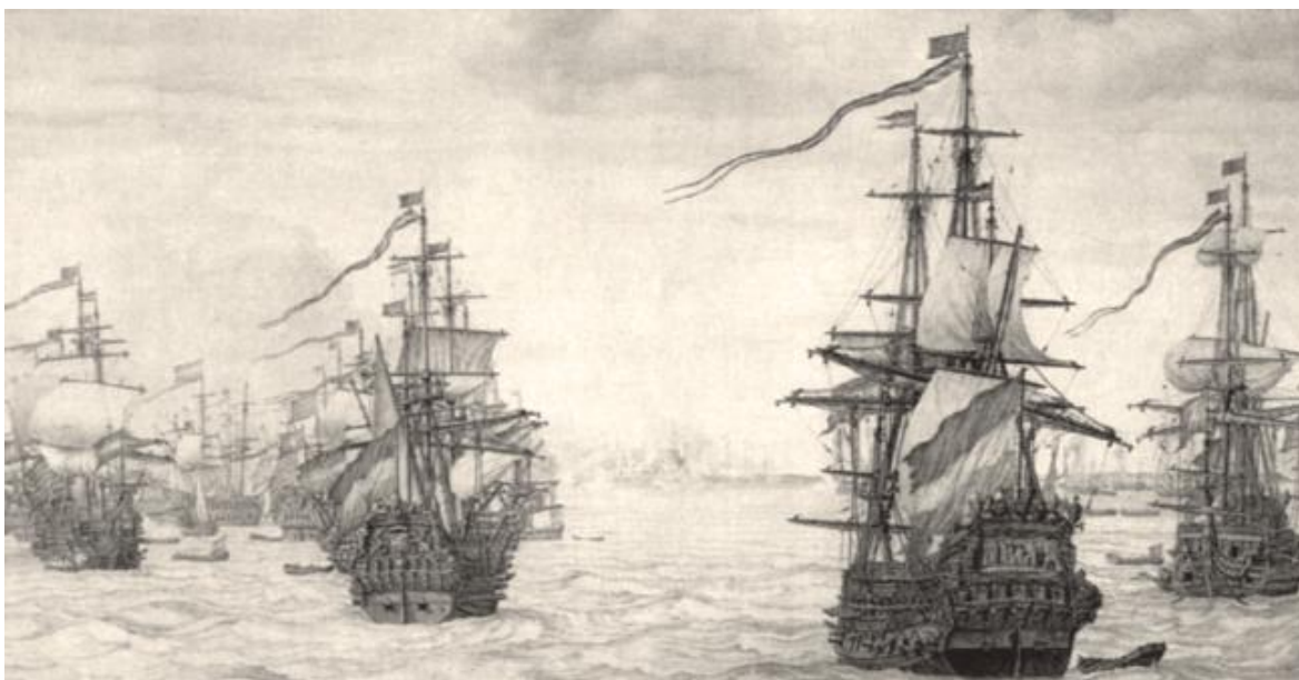
Obrázek 7: nájezd Nizozemců na Harwich, grisaille Willem van de Velde 343