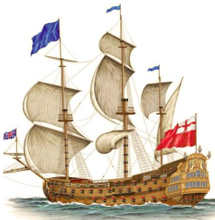
Obrázek 1: HMS St. Andrew, loď první kategorie, postavená 1670, nesla 96 děl 337