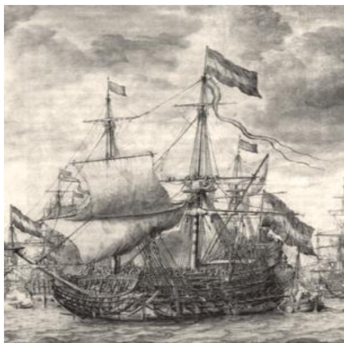
Obrázek 2: Eendracht, postavená 1653, nesla 76 děl, zničená u Lowestoftu 1665 338