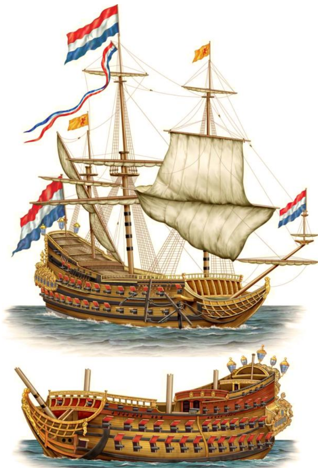
Obrázek 5: Eendracht, postavená 1653, zničená v bitvě u Lowestofu 1665 341