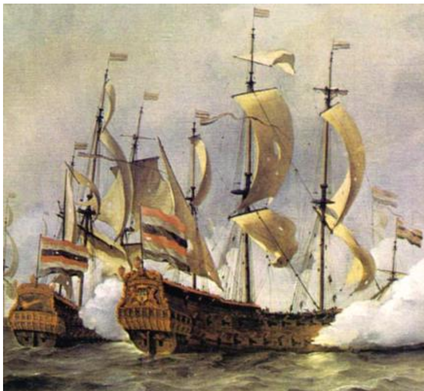
Obrázek 4: Hollandia, nesla 80 děl, postavená 1654 340