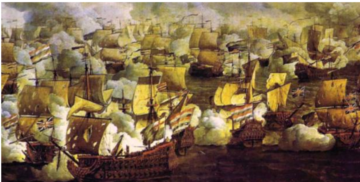
Obrázek 6: Bitva u Texelu 1673, malba Willem van de Velde mladší 342