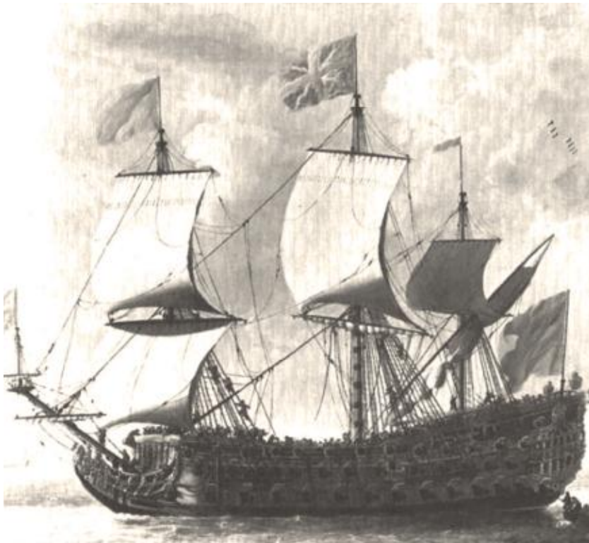
Obrázek 3: HMS Royal Charles, postavená 1655, loď první kategorie, 82 děl, zajatá Nizozemci na Medway 1667 339