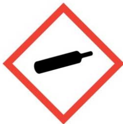
plyny pod tlakem