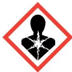
látky nebezpečné pro zdraví