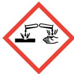
koorzivní a žíravé látky