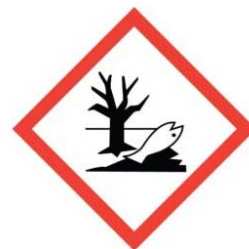
látky nebezpečné pro životní prostředí