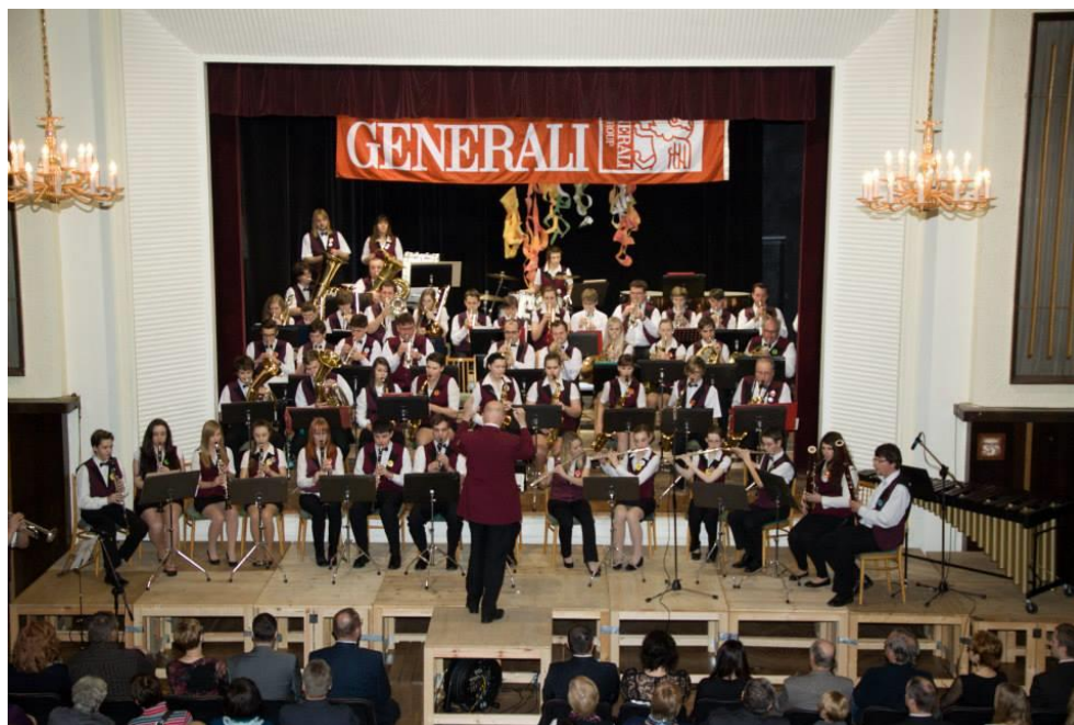
Obrázek 4 - vystoupení Novoročního koncertu z roku 2015