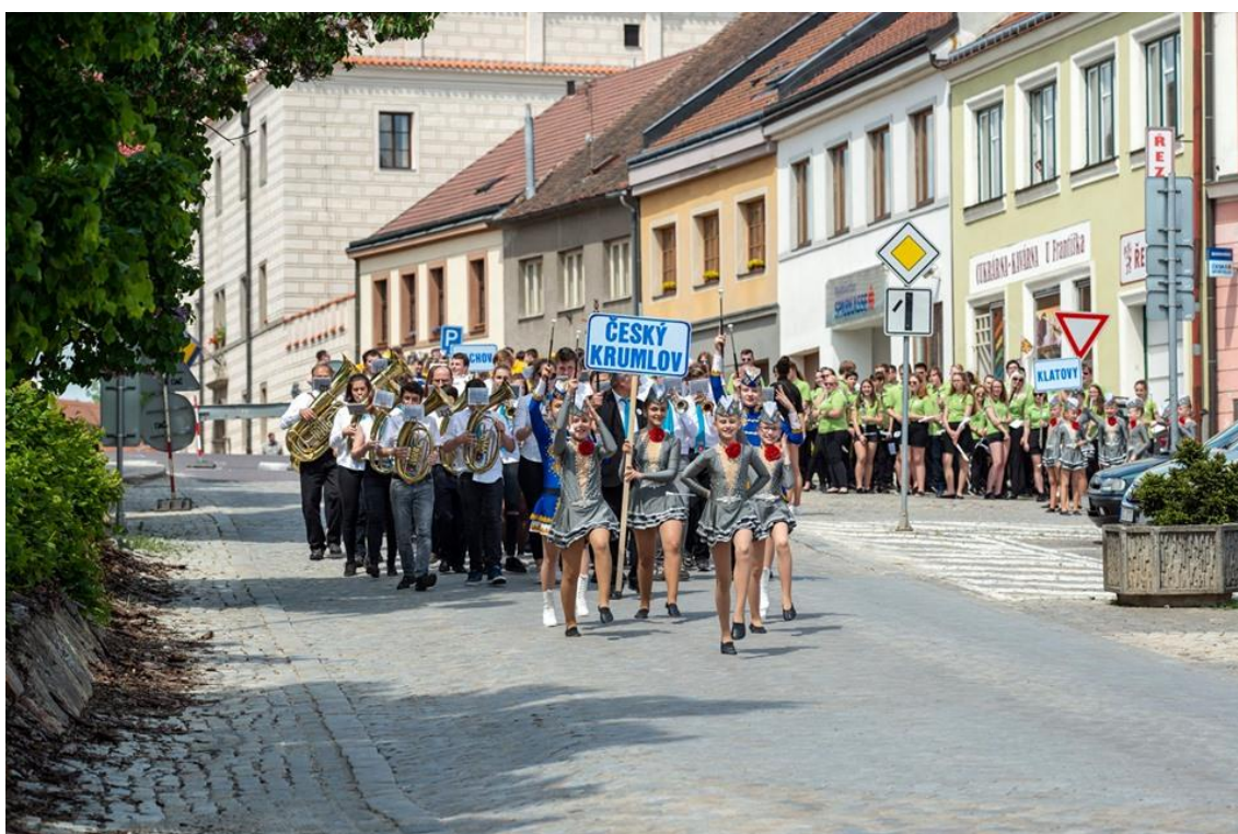
Obrázek 7 - nastoupení orchestrů na Palackého náměstí v Dačicích v rámci festivalu Fest Band 2019