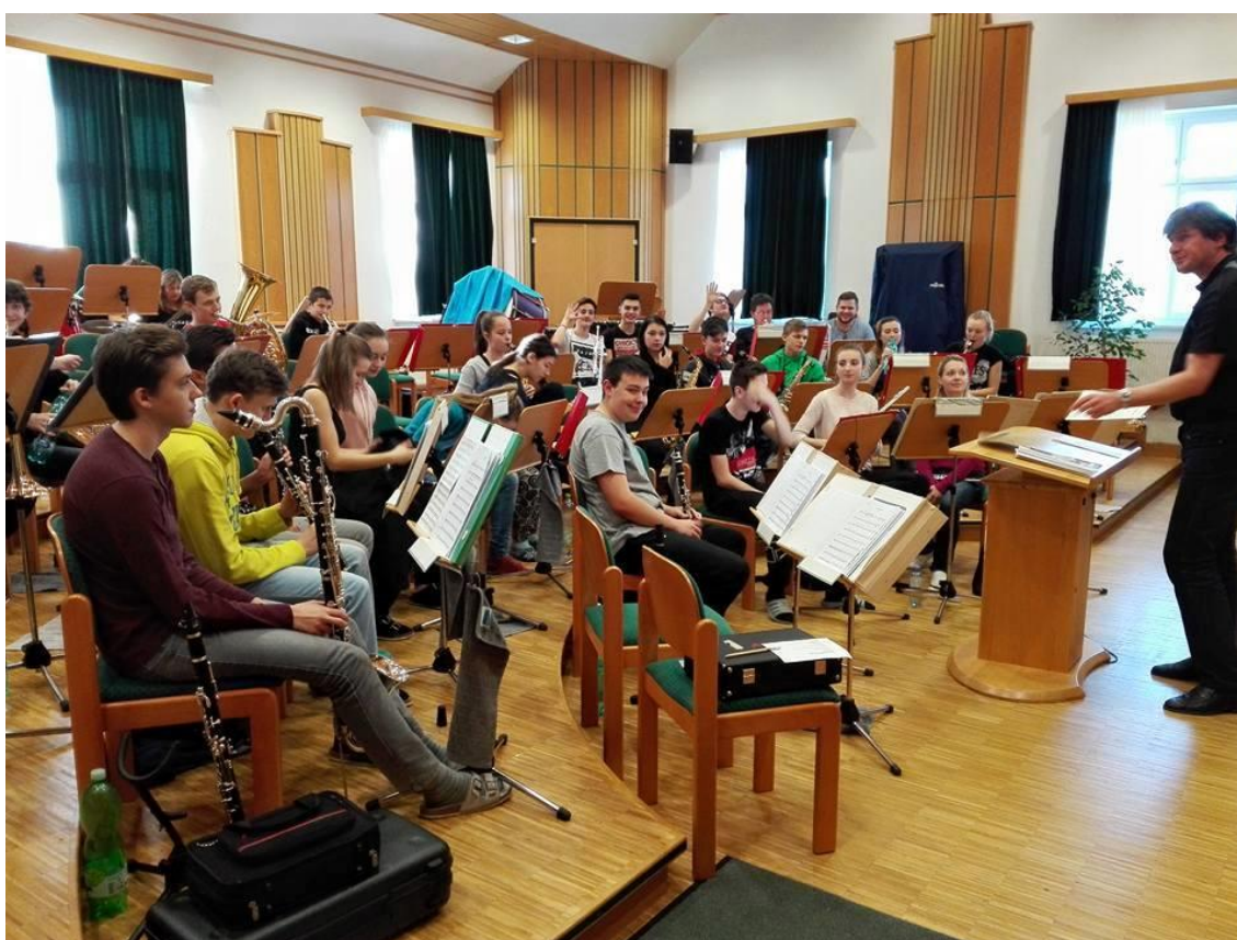
Obrázek 6 - soustředění orchestru v rakouském městečku Langau v roce 2017