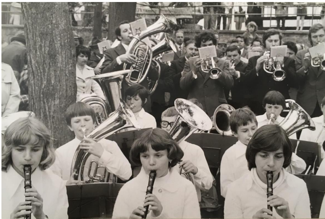
Obrázek 2 - vystoupení orchestru v roce 1978