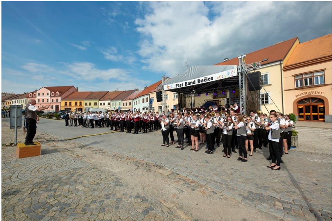
Obrázek 9 - závěrečná část festivalu Fest Band Dačice 2019 při Monsterkoncertu