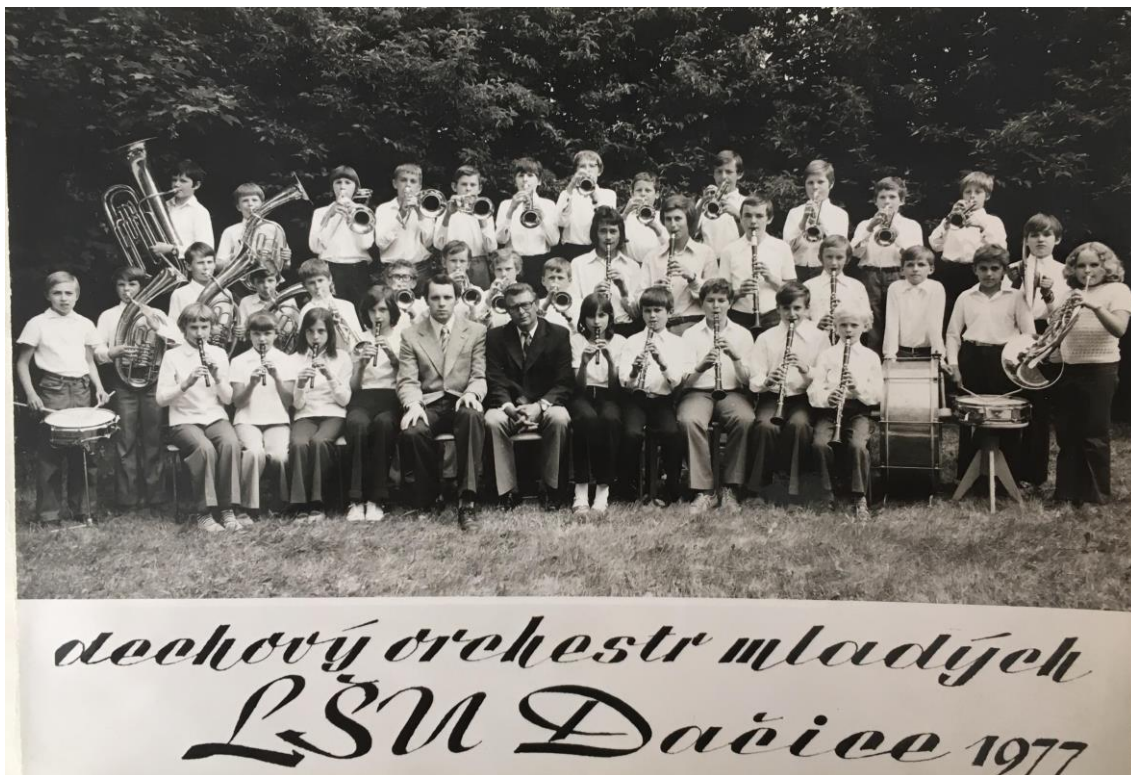
Obrázek 1 - fotografie členů a dirigentů v roce 1977