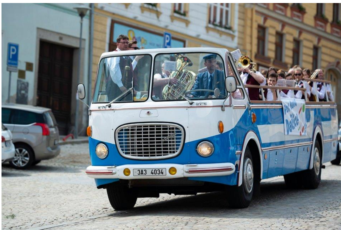
Obrázek 8 - okružní jízda Cabriobusu v rámci festivalu Fest Band 2019