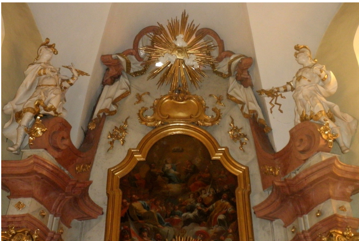
Obr. 11, Václav Böhm, oltář Věch svatých, 60. léta 18. století, kostel Věch svatých, Metylovice (autor: Lucie Janotová)