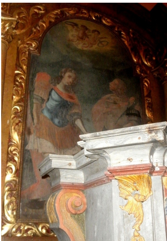
Obr. 2, oltář kaple sv. Jana a Pavla, mezi lety 1720-1730, Budkov