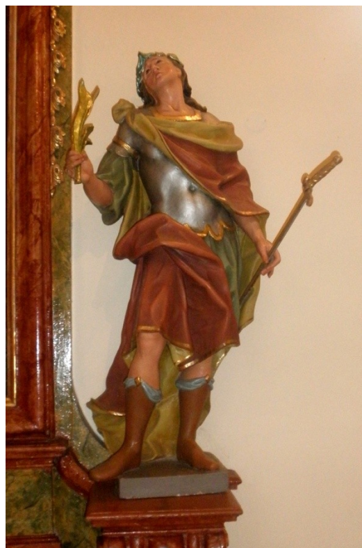
Obr. 3 a 4, oltář sv. Františka z Assisi, asi mezi lety 1740-46, kostel sv. Šebestiána a Rocha, Archlebov (autor: Lucie Janotová)