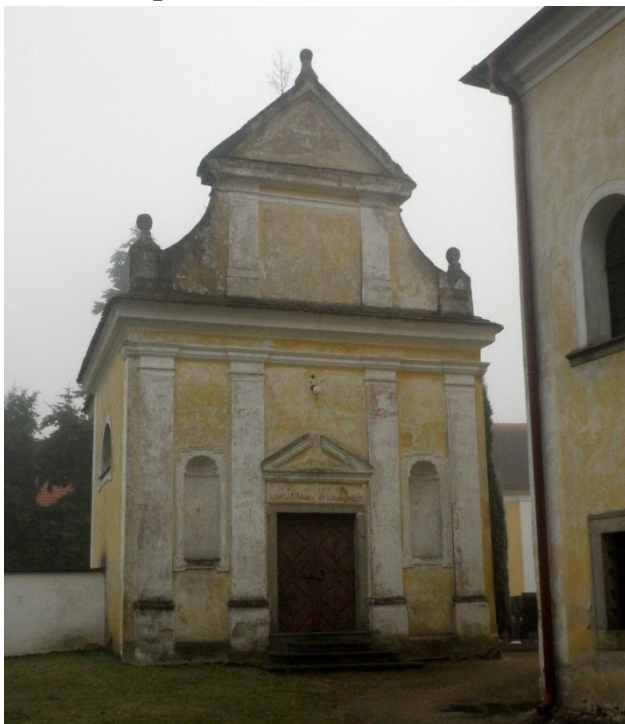
Obr. 1, kaple sv. Jana a Pavla, mezi lety 1720-1730, Budkov