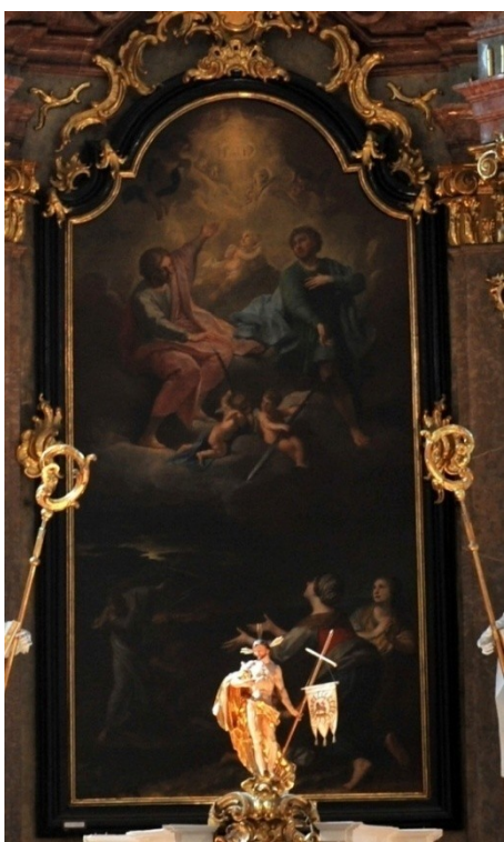
Obr. 10, Jan Nepomuk Steiner, sv. Jan a Pavel, 1770, kostel sv. Jana a Pavla, Místek