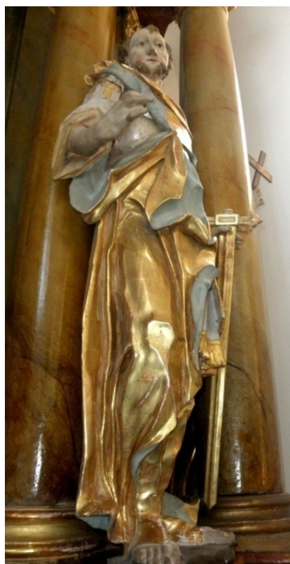
Obr. 5 a 6, oltář sv. Jiljí, 60. léta 18. století, kostel sv. Jiljí, Dolní Dunajovice (autor: Lucie Janotová)