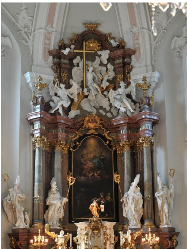
Obr. 9, Václav Böhm, oltář sv. Jana a Pavla, kolem roku 1770, kostel sv. Jana a Pavla, Místek