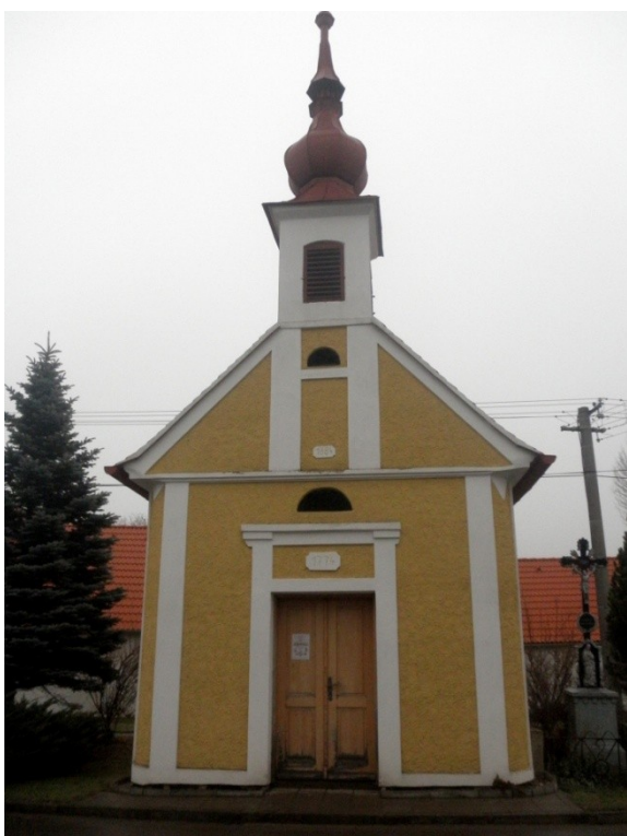
Obr. 16, kaple sv. Jana a Pavla, 1774, Oponěšice (autor: Lucie Janotová)