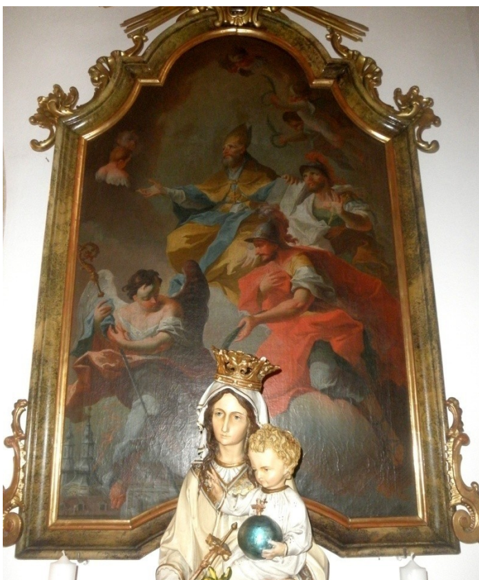
Obr. 19, Ignáz Mayer st., Sv. Augustýn s Janem a Pavlem, před rokem 1784, kostel sv. Václava, Lovčičky (autor: Lucie Janotová)