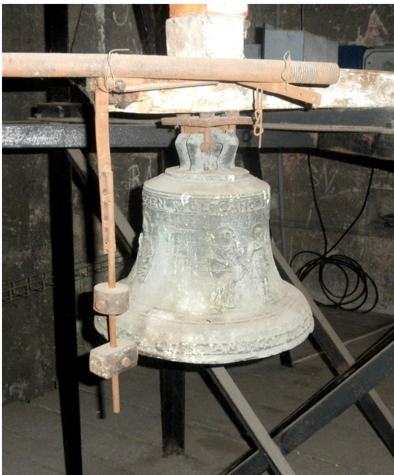
Obr. 24, Wolfgang Jan Sarkander Straub, zvon s reliéfem sv. Jana a Pavla, 1797, kostel sv. Jakuba Většího, Místek (autor: Lucie Janotová)