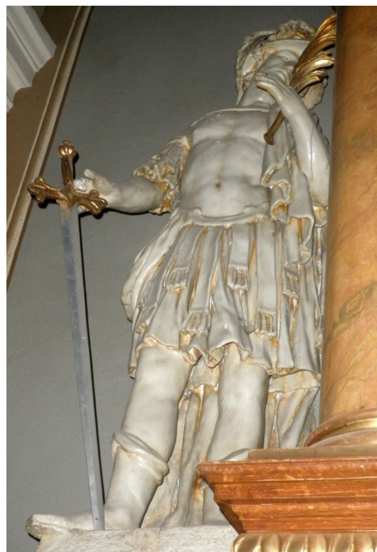
Obr. 12 a 13, kaple Anděla strážce, 60. léta 18. století nebo 19. století, kostel sv. Michala, Dyjákovice (autor: Lucie Janotová)