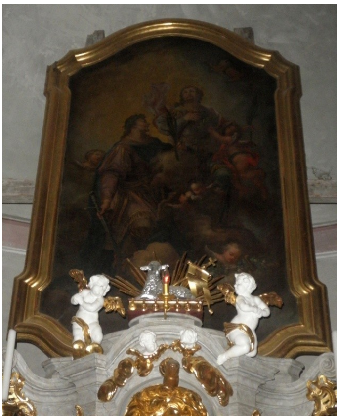
Obr. 15, asi Ignác Raab, sv. Jan a Pavel, před rokem 1786, kostel sv. Jana a Pavla, Citonice (autor: Lucie Janotová)