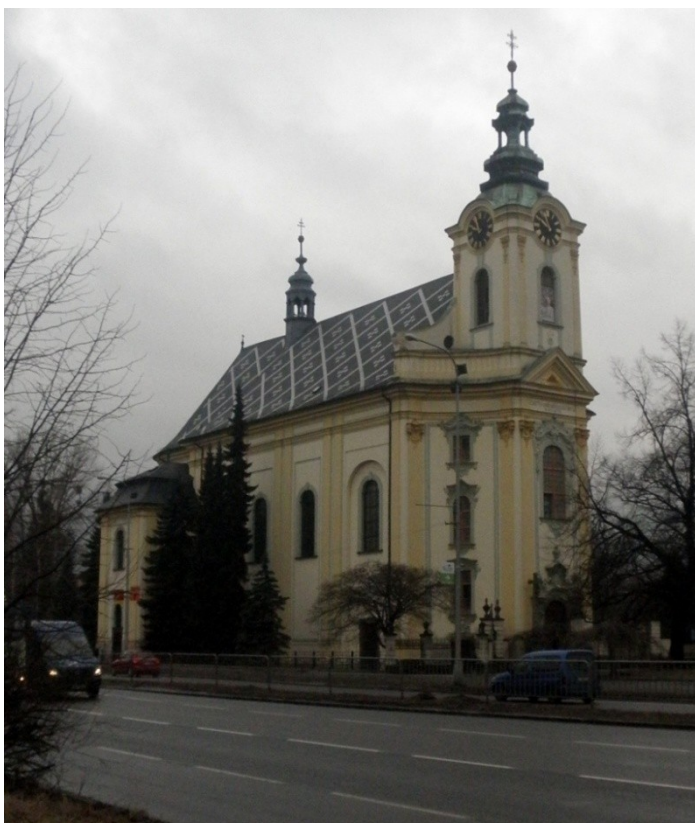
Obr. 7, Josef Ignác Cyranim z Boleshausu, kostel sv. Jana a Pavla, 1763-67, Místek (autor: Lucie Janotová)