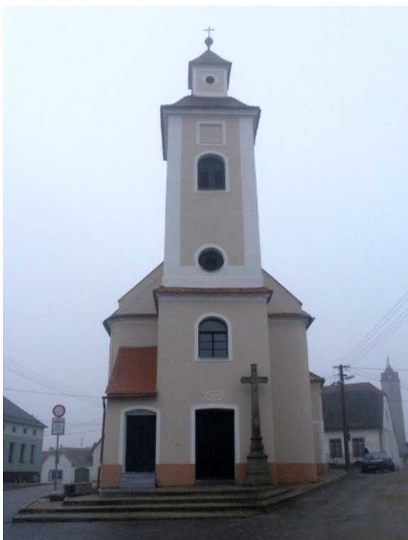
Obr. 14, kostel sv. Jana a Pavla, 1768-69, Citonice (autor: Lucie Janotová)