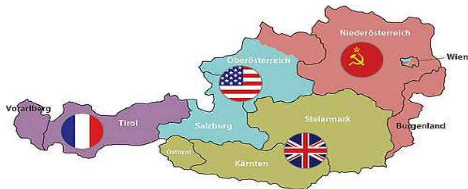
Bild 1: Karte mit Besatzungszonen in Österreich nach dem Zweiten Weltkrieg: Online. In: Dostupné z: https://www.demokratiewebstatt.at/angekommen-demokratie-und-sprache-ueben/ein-neustart-die-zweite-republik [cit. 2024-03-16].