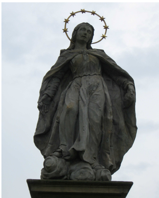
Obr. č.5–socha Panny Marie na jižním konci města Uničova

Socha na jižním konci města zachycuje Pannu Marii čelem obrácenou k městu a rozvírající svůj plášť; že se jedná o ochranné gesto, je více než zřejmé. Podobně je tomu i u vedut v majetku Mužského muzea v Uničově, na nichž je zobrazena Panna Marie Ochránitelka v naší šíři nad městem.