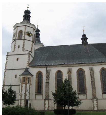
Obr. č. 1a2 – uničovský kostel Nanebevzetí Panny Marie