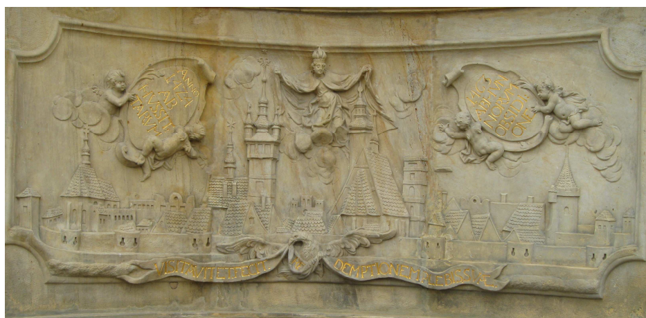
Obr. č.4–reliéf vpravo řízemí uničovského mariánského sloupu – veduta města Pannou Marií Ochránitelkou