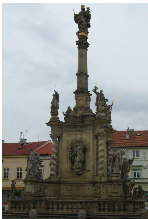
Obr. č.3–mariánský sloup v Uničově