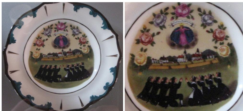
Obr. č.8a9–talíř s výjevem z uničovské mariánské legendy (vlevo) a detail výjevu (vpravo)

Ikonografických památek, které by se vztahovaly přímo k mariánské svíčkové slavnosti je opravdu poskrovnu. Všehovšudy se jedná pouze o dva porcelánové talíře v majetku Muzejského muzea Uničov. Talíře pocházejí z druhé poloviny 19. století a na jejich vnitřní straně je zachycen totožný výjev z uničovské mariánské legendy: pohled naměřeno, nad nímž se vznáší Panna Marie, a před ní klečí čtyři ženy a čtyři muži, kteří se modlí Panně Marii a žádají ji o pomoc.