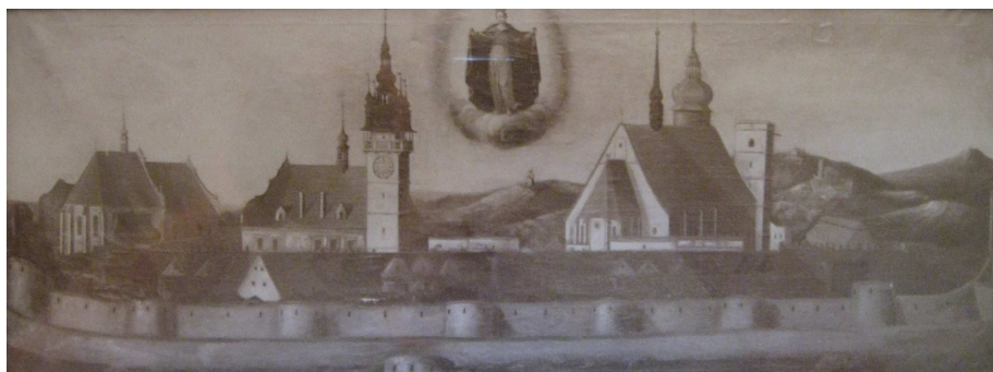
Obr. č.6–veduta města Uničova z roku 1750