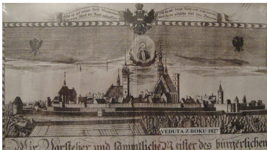
Obr. č.7–vedutam města Uničov z roku 1827