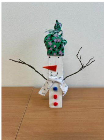
Sněhulák, hotový výrobek