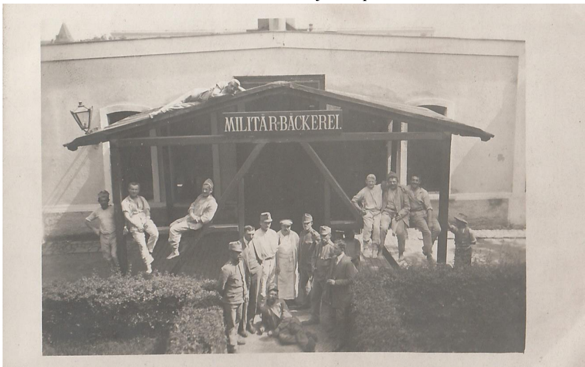
Vojenská pekárna, 1914-1918