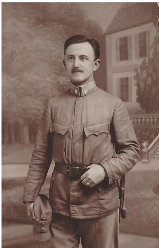
Viktor Kautzký, rok 1918, Nikopole