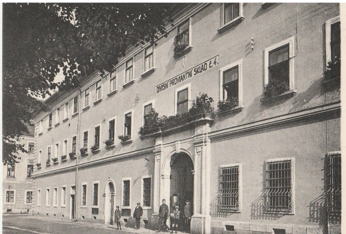
Divizní proviantní sklad č. 4 – Slávkův rodný dům / Dnes muzeum