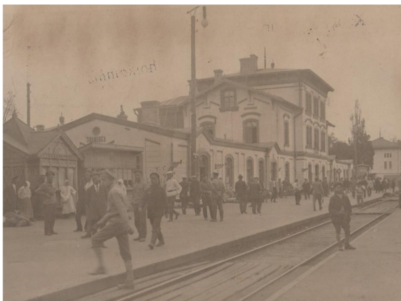
Nádražní stravovna, rok 1918, Nikopole