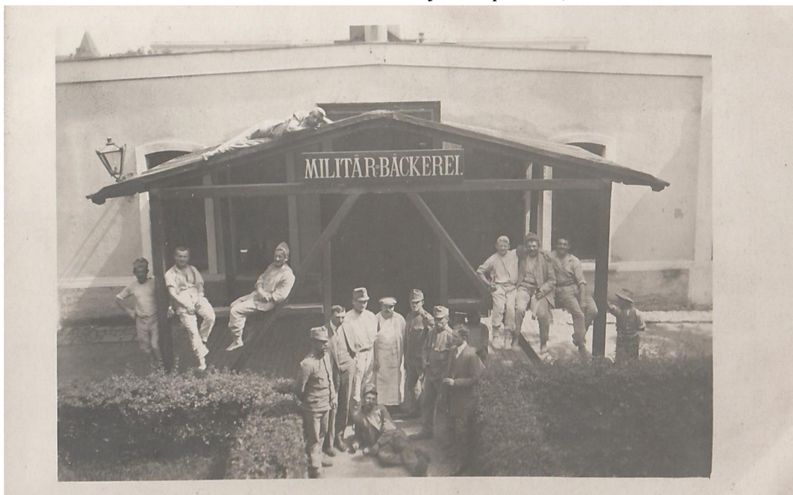
Vojenská pekárna, 1914-1918