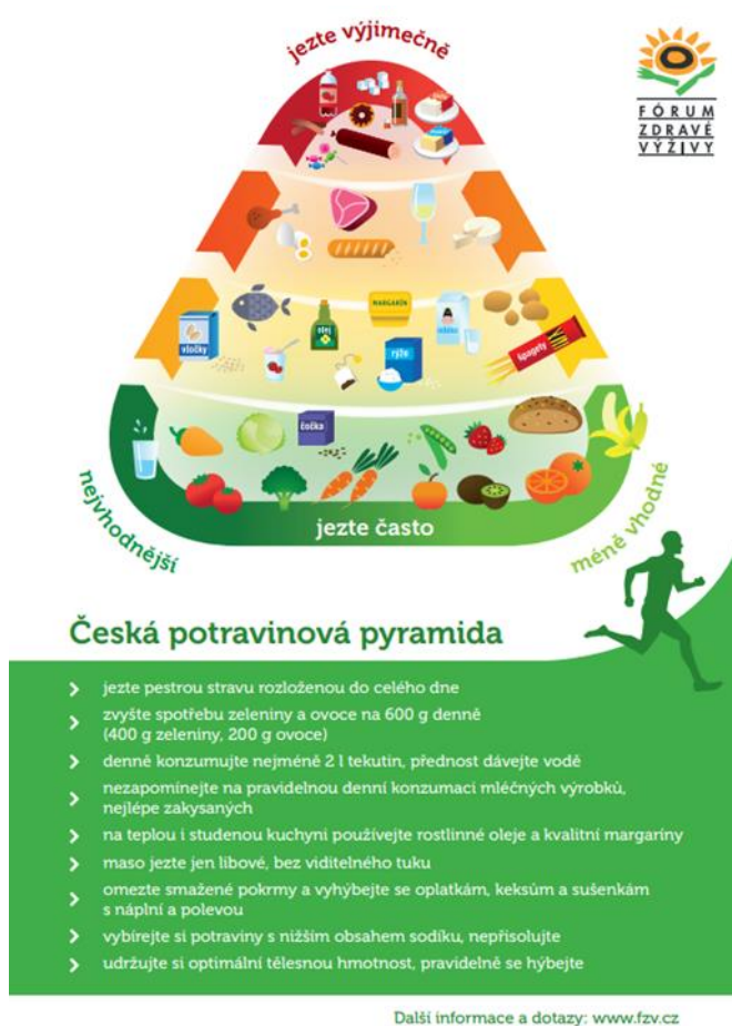
Obrázek 1: Potravinová pyramida 2013 (Fórum zdravé výživy 2013)

Fórum zdravé výživy uvádí, že potravinové pyramidy nemají sloužit jako přesný návod, dle kterého je třeba si nastavit jídelníček, ale pouze soubor doporučení, ze kterých si vzít příklad, aby se předcházelo zdravotním problémům a nezhoršoval se dále stav obyvatelstva. Je proto důležité, aby byly čitelné a nedocházelo k misintrepretaci. (www.fzv.cz 2024)