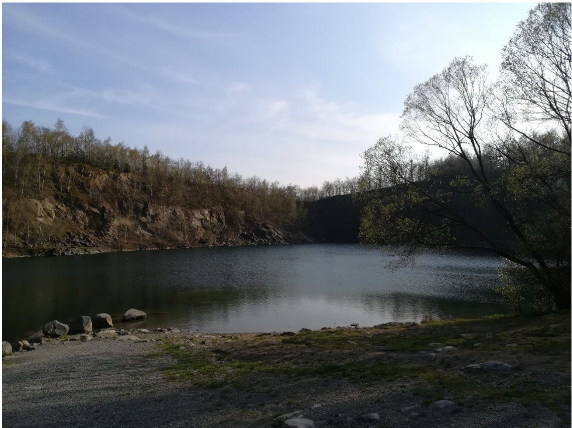
Obr. č. 18 – Zatopený lom Výkleky

Tento zatopený lom (Obr. č. 17) navštěvují desítky lidí denně. V letních měsících jsou počty mnohonásobně větší. Bohužel je to pro lom velká ekologická zátěž. Není však v silách obce tomuto předejít, jelikož obec není majitelem lomu. Pořádají se zde alespoň dobrovolnické akce pro sběr odpadu. Taktéž pod hladinou lze nalézt spoustu věcí, které do vodního prostředí nepatří. Některé z těchto věcí slouží pro potápěče jako atrakce. V blízkosti zatopeného lomu se nachází další lom, ve kterém se stále aktivně těží. Mohl by to být další faktor znečištění. Mohlo by jít např. o znečištění ovzduší nebo znečištění výfukovými plyny. Je to pouze předpoklad, neboť se těží až 1,5 km od obce. Lokalitu jsem si vybrala proto, abych prozkoumala, jací bezobratlí živočichové se zde vyskytují a zda výskyt nalezených druhů odpovídá dané lokalitě.