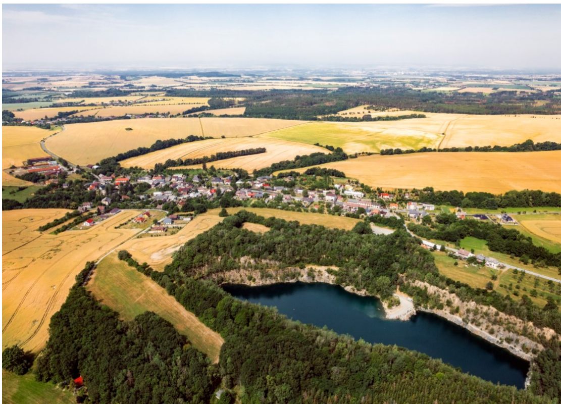
Obr. č. 1 - Letecký pohled na obec Výkleky a lom 2019