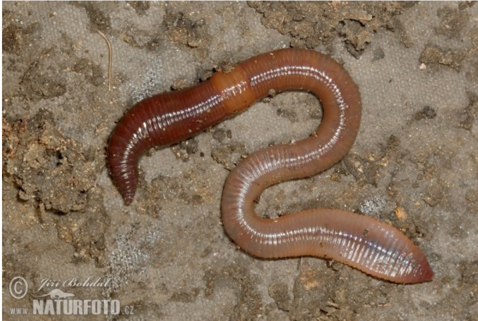
Obr. č. 8 – Žížala