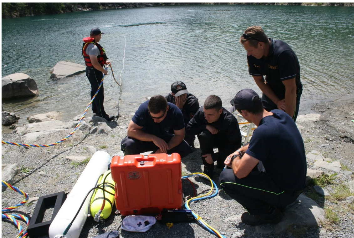
Obr. č. 3 – Výcvik potápěčů HZS

záchranných složek České republiky (Obr. č. 3). Např. v roce 2019 zde probíhal výcvik potápěčů ZS Olomouckého kraje, PSP Wroclaw a PSP Opole (online, cit. 2021-04-27, dostupné z: www.hzscr.cz ).