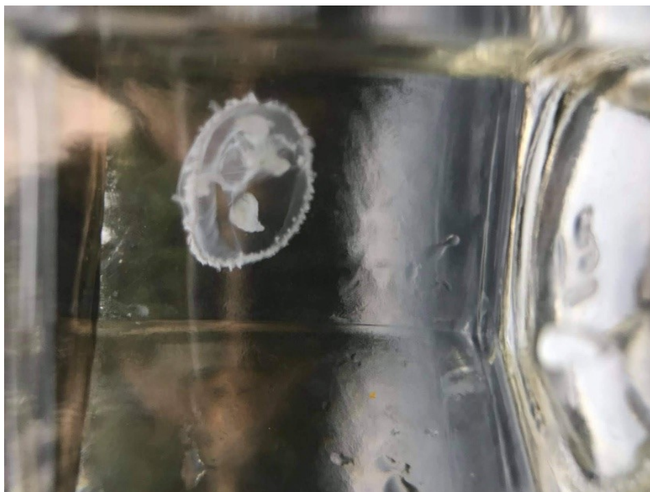
Obr. č. 7 – Medúzka sladkovodní