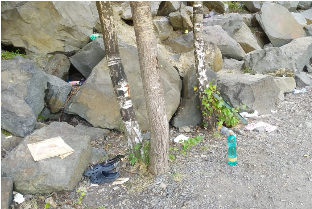
Obr. č. 5 – Odpad v okolí lomu Výkleky

Po sesbírání odpadků je mohli dobrovolníci přinést zpět k závoře, a obec Výkleky zajistila likvidaci posbíraných odpadků. Obec se o lom a jeho okolní krajinu stará, a to proto, že se lom nachází na katastru obce a tak je pro obec vizitkou udržovat okolní krajinu v čistotě. Vedení obce se setkává s kritikou, že je lom zaneřáděn odpadem, i když má lom své vlastníky. Dle slov starostky obce je lom velkou ekologickou zátěží pro celou obec.