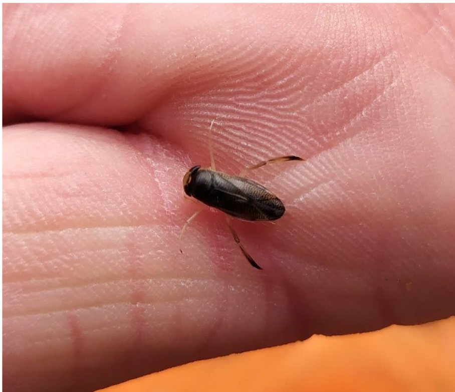
Obr. č. 10 – Klešťanka obecná (O. Kuzhel, 2020)

Klešťanka obecná ( Sigara falleni ) je vodní ploštice (Obr. č. 10). Často se plete s jinou vodní plošticí – znakoplavkou obecnou ( Notonecta glauca ). Klešťanky ( Corixidae ) se mohou živit dokonce i řasami. Rod Sigara se živí rostlinnou potravou (Smrž, 2013). Jejich velikost se pohybuje okolo 8 mm. V době rozmnožování sameček láká samičku zvukem, který vzniká při tření předních nohou o hlavu. Při pohybu ve vodním prostředí plavou hřbetní stranou nahoru na rozdíl od znakoplavek, které plavou břišní stranou nahoru (Kůrka, 1999). Aby se mohly nadechnout, musí se vynořit hlavou, naopak znakoplavky se vynořují zadečkem. Jsou dobrými letci a vzlétnout mohou rovnou z vodní hladiny. Klešťanek je v České republice 28 druhů (Anděra, 2003).