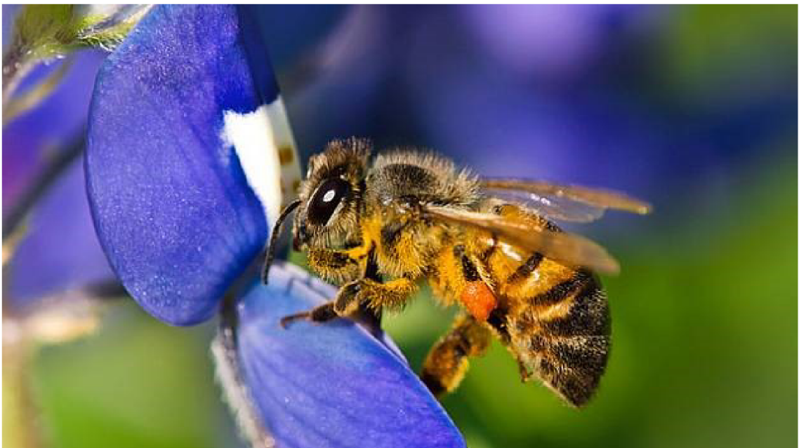
Obr. č. 16 – Včela medonosná

Včela medonosná ( Apis mellifera ) patří do řádu blanokřídlí ( Hymenoptera ) a čeledi včelovití ( Apidae ). Je cca 12 až 20 mm velká. Živí se šťávami rostlin. Má ústní ústrojí lízací. Larvy se živí pylem, který přináší včely v „košíčkách“. Larvy žijí v útvarech, které jsou z vosku. Včely medonosné (Obr. č. 16) patří mezi hmyz sociální. Jsou užitečné, proto jsou i člověkem chované (Smrž, 2013). Včely vytváří komunitu, kdy každá včela má svou funkci. V čele je královna. Dělnice jsou nejpočetnější skupinou v hnízdě. Ty během svého života vykonávají funkce jako je sběr pylu, sběr nektaru, starají se o čistotu úlu a také krmí larvy. Trubci vznikají z vajíček, které nejsou oplozené (Zahradník, 2007). Včely jsou velmi citlivé na škodlivé látky, proto jsou velmi významnými bioindikátory. Vlivem používání pesticidů v zemědělství, působí tyto látky i na včely, jelikož včely sbírají pyl a nektar, který pesticidy obsahuje, i když v malém množství (online, cit. 2021-05-04, dostupné z: https://energie21.cz ).