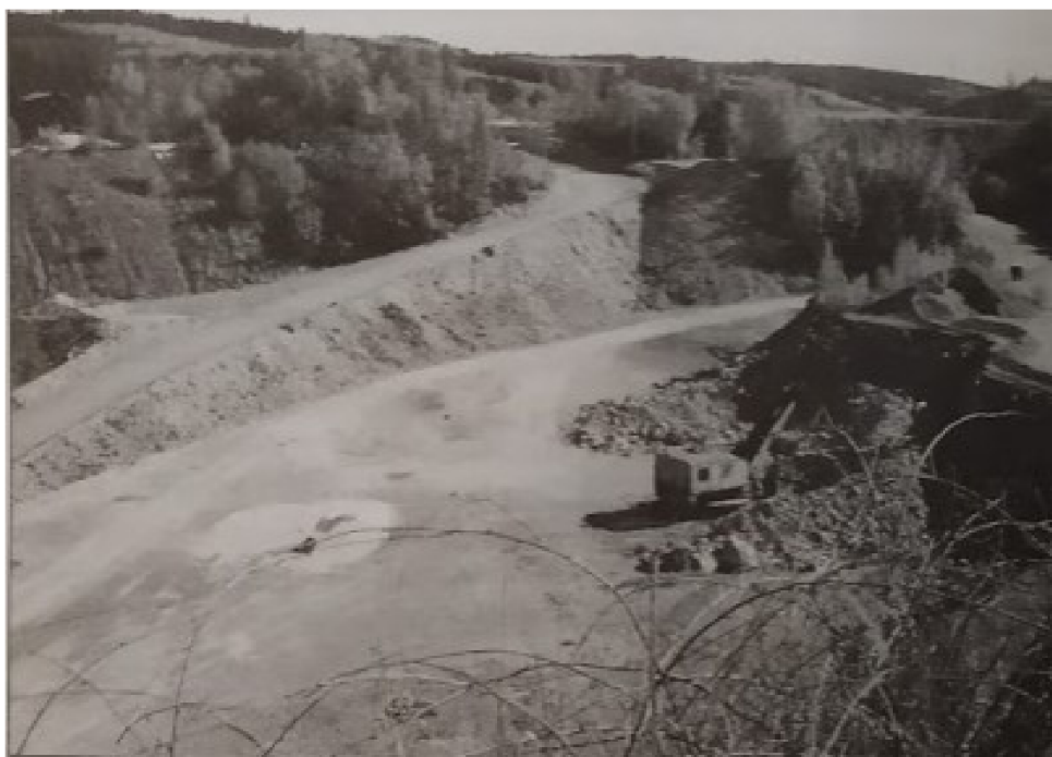
Obr. č. 2 –Těžba v předním lomu