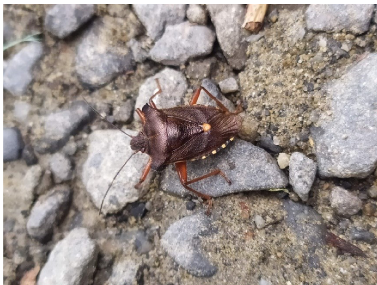
Obr. č. 12 – Kněžice rudonohá

Kněžice rudonohá ( Pentatoma rufipes ) je běžně se vyskytující druh. Jejich velikost je okolo 12 – 15 mm. Laloky štítu po stranách mají na koncích trn. Blanitá křídla mají uložena pod polokrovkami na zadní straně těla. Kněžice rudonohá (Obr. č. 12) má hnědou lesklou barvu. Štítek je s oranžovou špičkou. Nohy mají tyto kněžice zbarvené do červena. Podobná této kněžici rudonohé je kněžice červenonohá ( Pentatoma rufipes ), ta však nemá trn na laloku a má jasnější zbarvení. Tato kněžice je hojná a vyskytuje se po celé Evropě, dále v Indii a v Číně. Živí se vysáváním pupenů nebo výhonků rostlin. Může se živit i vysáváním mrtvého hmyzu, larev nebo vajíček. Jsou to dobří letci. Vajíčka kladou na větve nebo na listy dřevin (online, cit. 2021-04-25, dostupné z: https://www.researchgate.net/publication/337975820_Mekkysi_Mollusca ).