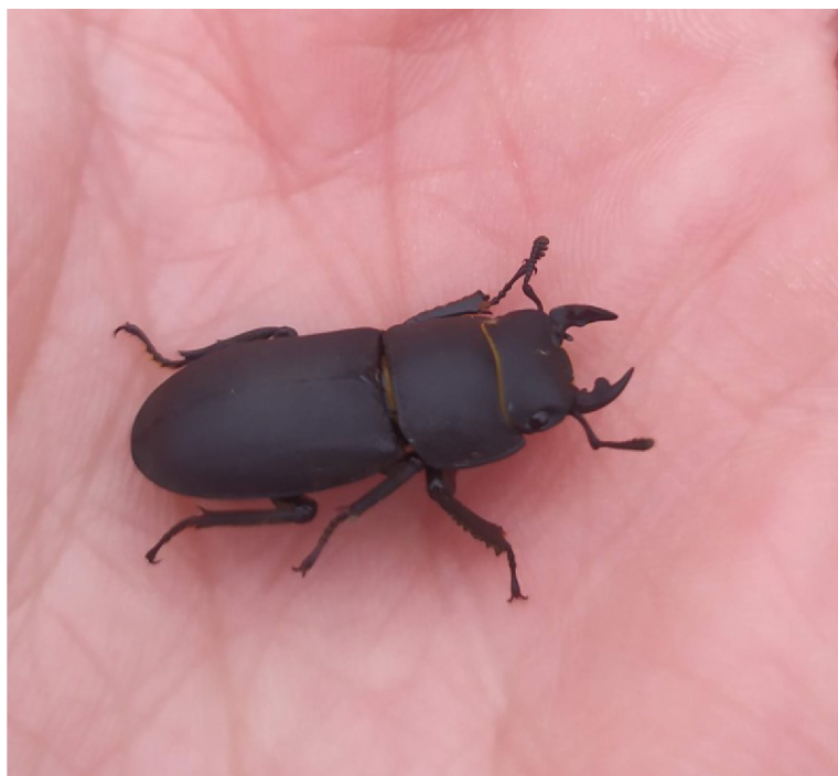
Obr. č. 15 – Roháček kozlík

Roháček kozlík ( Dorcus parallelipideus ) patří do čeledi roháčovití ( Lucanidae ). Stejně jako u ostatních druhů zde existuje pohlavní dimorfismus, rozdíly však nejsou tak výrazné. Samička má oproti samečkovi menší kusadla, která jsou mírně zakřivená a mají malý zub na vnitřní straně. Sameček má kusadla zakřivená podstatně více a má na vnitřní straně velký a pevný zub. Larvy roháčka se vyvíjí v rozkládajícím se dřevě nemocných stromů, např. jasanu ( Fraxinus sp. ), dubu ( Quercus sp. ) nebo dokonce i v borovici ( Pinus sp. ) (Zahradník, 2007). Jsou cca 19 až 32 mm velké. Dospělý roháček kozlík (Obr. č. 15) je zbarvený do černa. Povrch těla je bez ochlupení. Ochlupení se objevuje pouze na nohách. Aktivní mohou být jak ve dne, tak v noci. Potravou pro ně jsou listy nebo míza listů. Poslední dobou jeho počty ubývají. Nalézt je můžeme přibližně od dubna do srpna. Jejich vývoj trvá cca dva až tři roky (online, cit. 2021-05-06, dostupné z: http://www.naturabohemica.cz ). Vyskytují se v listnatých lesích, především vyhledávají lesy dubové a bukové. Jsou rozšířeni i v severní Africe nebo Malé Asii (Zahradník, 2007).