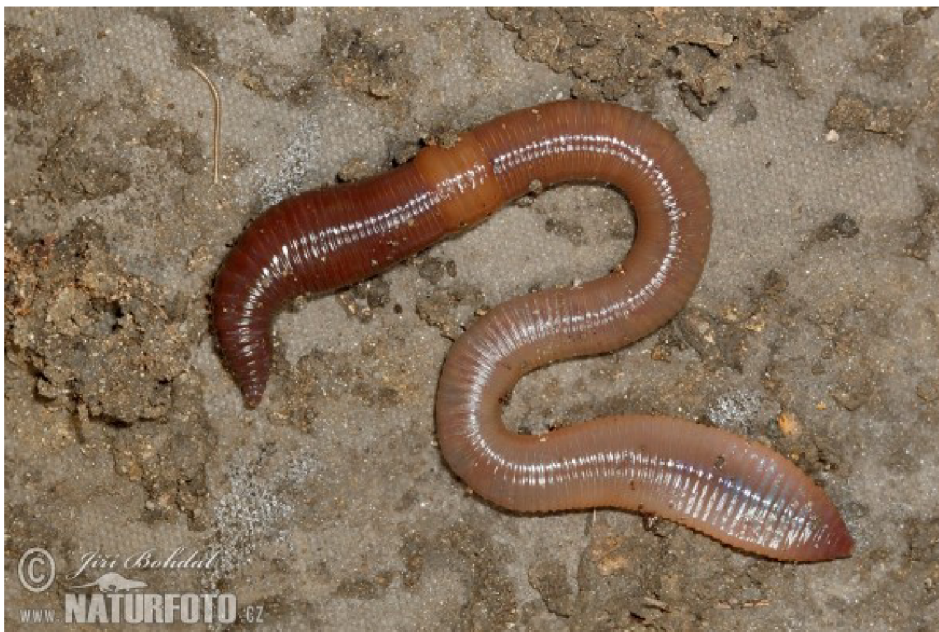
Obr. č. 8 – Žížala