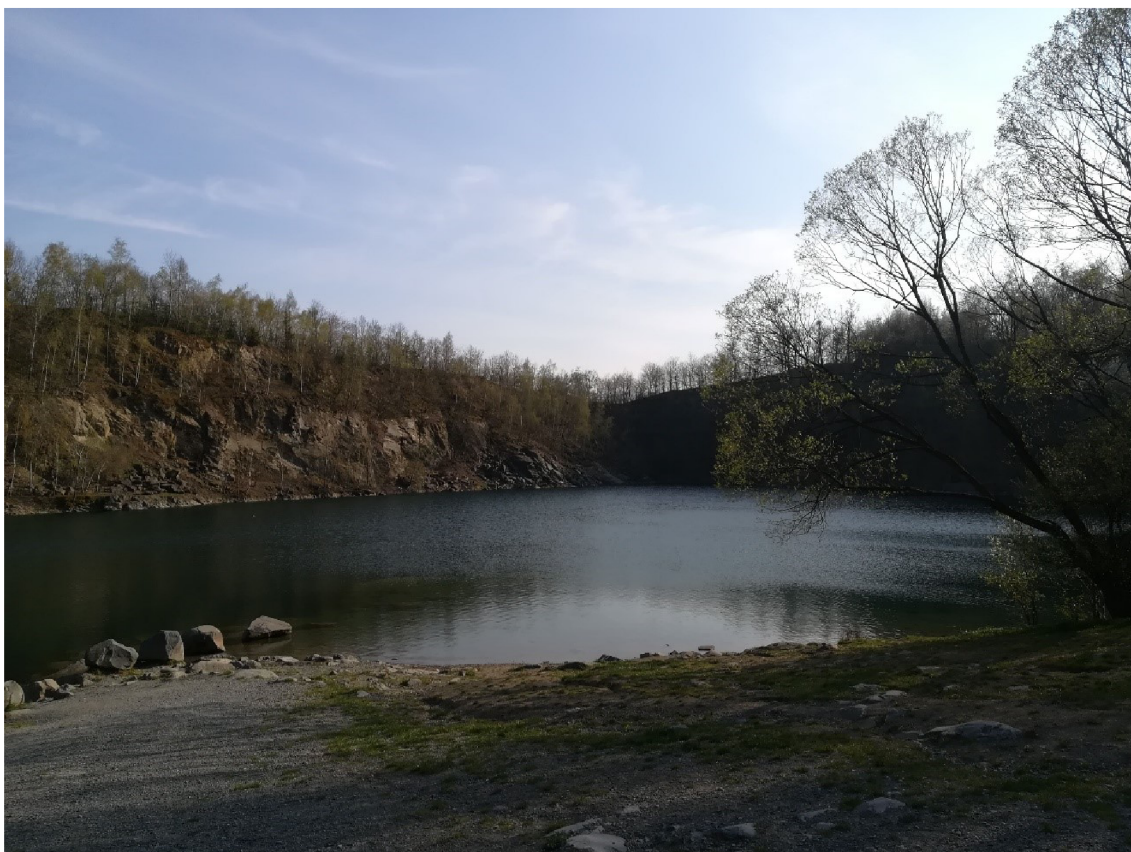
Obr. č. 18 – Zatopený lom Výkleky

Tento zatopený lom (Obr. č. 17) navštěvují desítky lidí denně. V letních měsících jsou počty mnohonásobně větší. Bohužel je to pro lom velká ekologická zátěž. Není však v silách obce tomuto předejít, jelikož obec není majitelem lomu. Pořádají se zde alespoň dobrovolnické akce pro sběr odpadu. Taktéž pod hladinou lze nalézt spoustu věcí, které do vodního prostředí nepatří. Některé z těchto věcí slouží pro potápěče jako atrakce. V blízkosti zatopeného lomu se nachází další lom, ve kterém se stále aktivně těží. Mohl by to být další faktor znečištění. Mohlo by jít např. o znečištění ovzduší nebo znečištění výfukovými plyny. Je to pouze předpoklad, neboť se těží až 1,5 km od obce. Lokalitu jsem si vybrala proto, abych prozkoumala, jací bezobratlí živočichové se zde vyskytují a zda výskyt nalezených druhů odpovídá dané lokalitě.