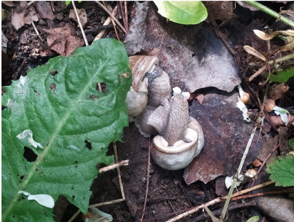
Obr. č. 9 – Hlemýžď zahradní

v nízkých porostech atp. Vyhledávají vlhká stanoviště, jelikož je vlhké prostředí pro ně zásadním limitujícím prvkem pro život (Švitorka, 1991).