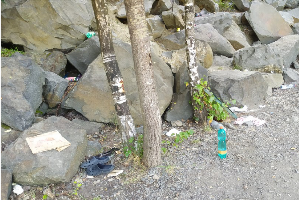
Obr. č. 5 – Odpad v okolí lomu Výkleky (2020)

Po sesbírání odpadků je mohli dobrovolníci přinést zpět k závoře, a obec Výkleky zajistila likvidaci posbíraných odpadků. Obec se o lom a jeho okolní krajinu stará, a to proto, že se lom nachází na katastru obce a tak je pro obec vizitkou udržovat okolní krajinu v čistotě. Vedení obce se setkává s kritikou, že je lom zaneřáděn odpadem, i když má lom své vlastníky. Dle slov starostky obce je lom velkou ekologickou zátěží pro celou obec.