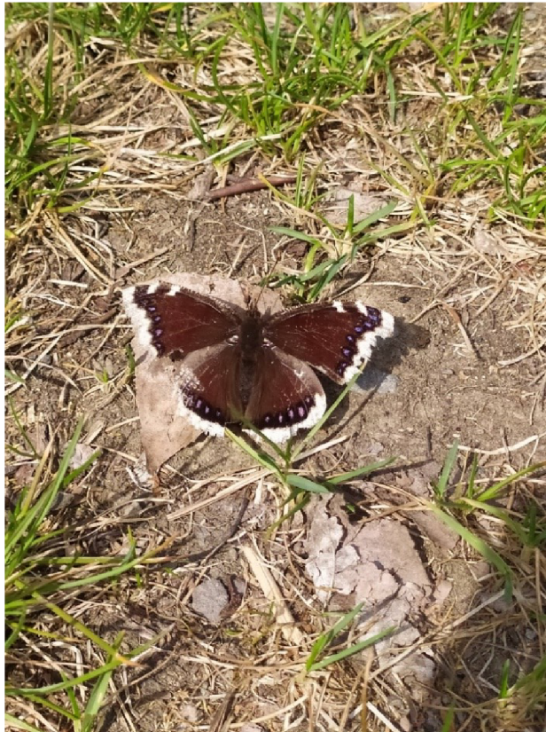
Obr. č. 13 – Babočka osiková

se látkami. Mezi tyto látky mohou patřit např. mršiny nebo ovoce, které kvasí. Přibližně čtyři týdny trvá u baboček osikových larvální vývoj. U motýlů je proměna dokonalá (Hanel, 2003). Babočky osikové (Obr. č. 13) jsou rozšířeny po celé České republice. Nejčastěji ji najdeme v lese, dále se objevuje u řek nebo na loukách. Babočky osikové nejsou ohroženým druhem (online, cit. 2021-05-04, dostupné z: http://motyli.net ).