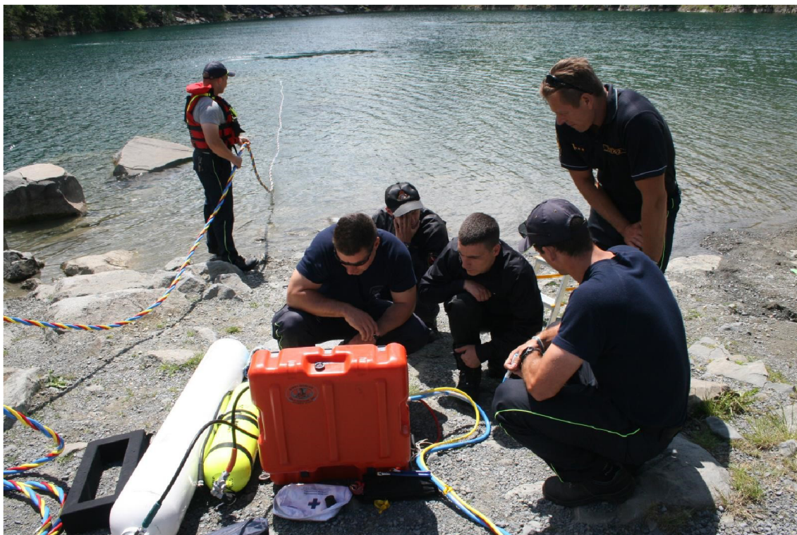
Obr. č. 3 – Výcvik potápěčů HZS

záchranných složek České republiky (Obr. č. 3). Např. v roce 2019 zde probíhal výcvik potápěčů ZS Olomouckého kraje, PSP Wroclaw a PSP Opole (online, cit. 2021-04-27, dostupné z: www.hzscr.cz ).