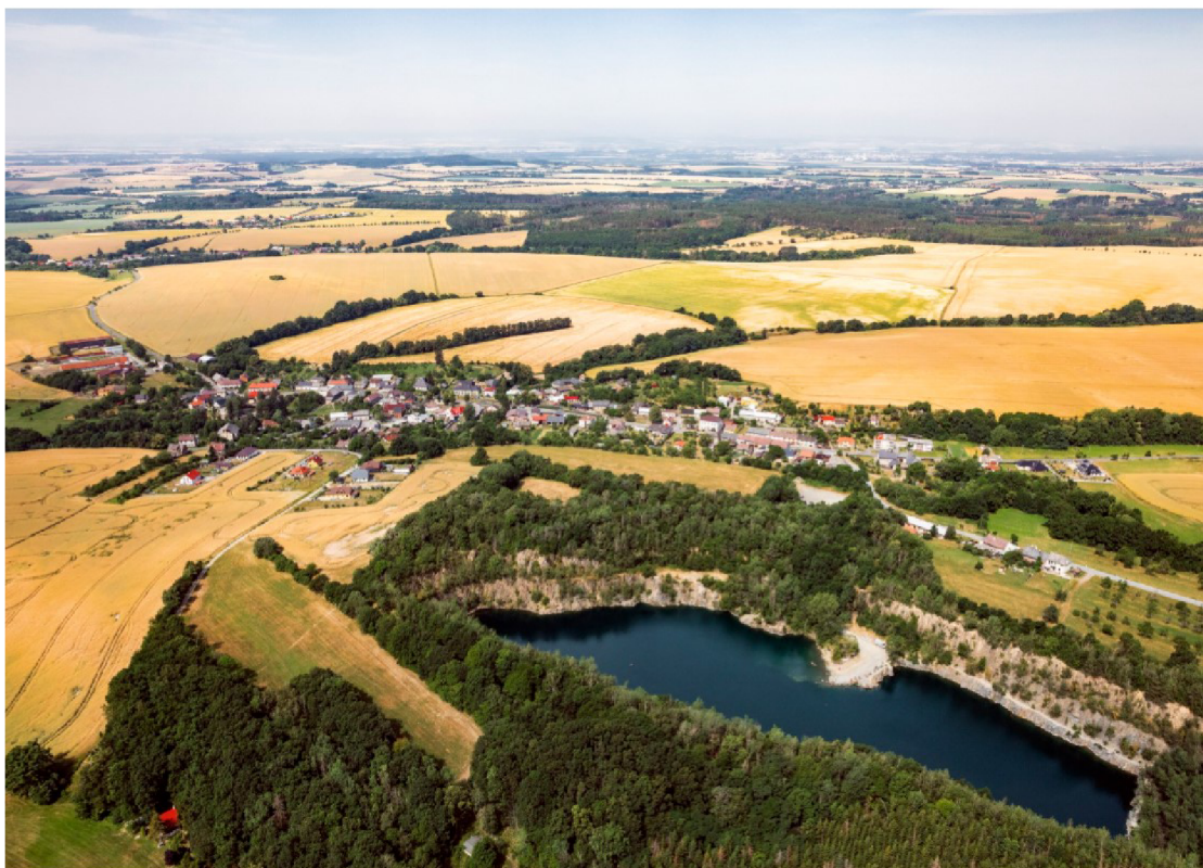
Obr. č. 1 - Letecký pohled na obec Výkleky a lom 2019