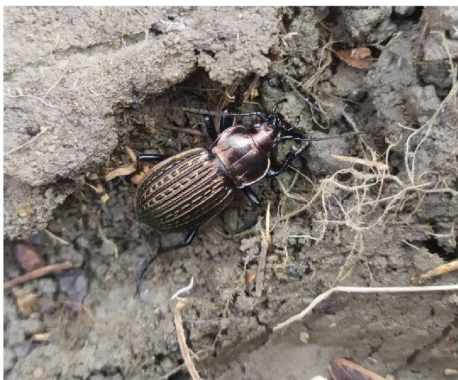
Obr. č. 14 – Střevlík Ullrichův

Střevlík Ullrichův (Obr. č. 14) je cca 20 až 34 mm velký. Může se zaměňovat s jemu podobným střevlíkem měděným ( Carabus cancellatus ) nebo střevlíkem zrnitým ( Carabus granulatus ). Liší se od sebe tím, že střevlík zrnitý není na první pohled tak robustní. Střevlík měděný má červený první článek tykadla a bývá větší jak střevlík Ullrichův (Trnka, 2009). Osidluje přirozené, do jisté míry přirozené stanoviště nebo i dobře obnovené krajiny. Objevuje se v okolí tekoucích vod, lomů, na loukách, pastvinách (Farkáč, 2006). Přes den je schovaný pod kameny. Je to dravec a loví převážně v noci. Larvy jsou stejně jako dospělci dravé (Trnka, 2009). Tento druh střevlíka patří mezi druhy ohrožené (online, cit. 2021-05-27, dostupné z: https://www.mzp.cz ). Střevlík je vhodný jako bioindikátor (Farkáč, 2009).