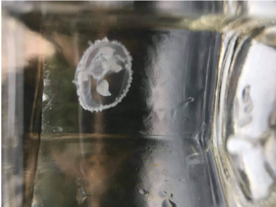
Obr. č. 7 – Medúzka sladkovodní