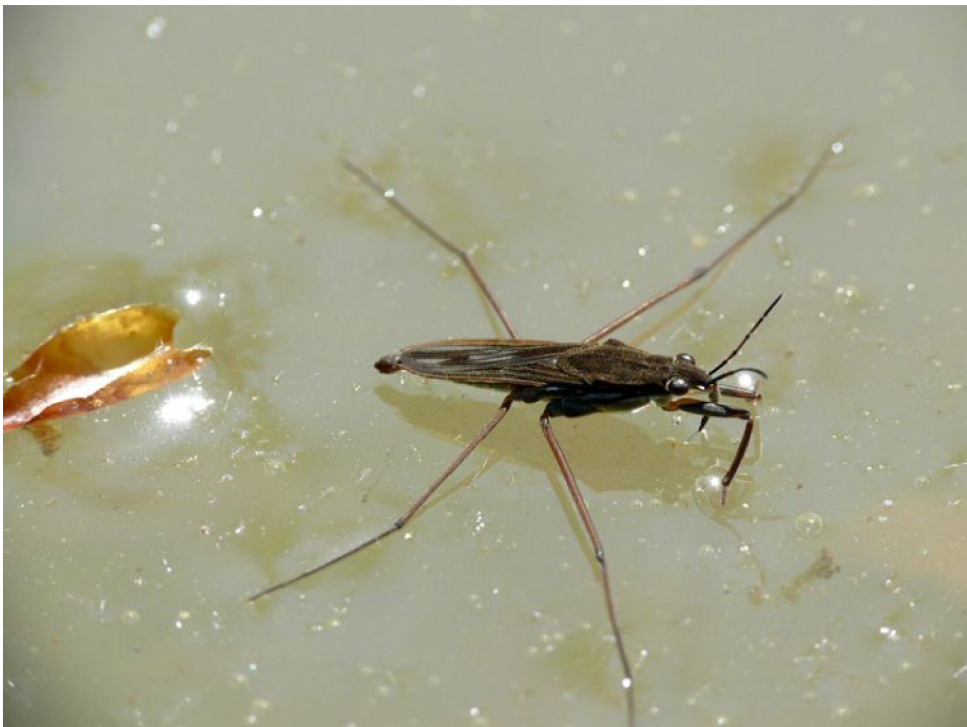
Obr. č. 11 – Bruslařka obecná (zdroj: Herman, 2010)

Bruslařka obecná ( Gerris lacustris ) patří mezi vodní ploštice (Obr. č. 11). Končetiny má přizpůsobené k tomu, aby se mohla pohybovat po vodní hladině. K tomuto pohybu slouží také břišní strana těla, která je nesmáčivá. Je dravá a živí se drobnými živočichy, kteří spadli na vodní hladinu. (Smrž, 2013). Pohybuje se po zadních a prostředních nohách. Přední nohy slouží bruslařkám k uchopení potravy (Hanel, 2003). Tělo bruslařky je podlouhlé, v prostřední části širší, v přední a zadní části se ztenčuje. Bruslařky jsou 8 – 10 mm velké. Vyskytují se hojně na vodách stojatých. Není výjimkou, že se vyskytují ve velkém počtu. Jsou to dobří letci (Javorek, 1978).