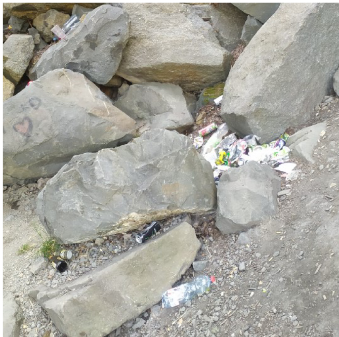
Obr. č. 6 – Odpad v okolí lomu Výkleky