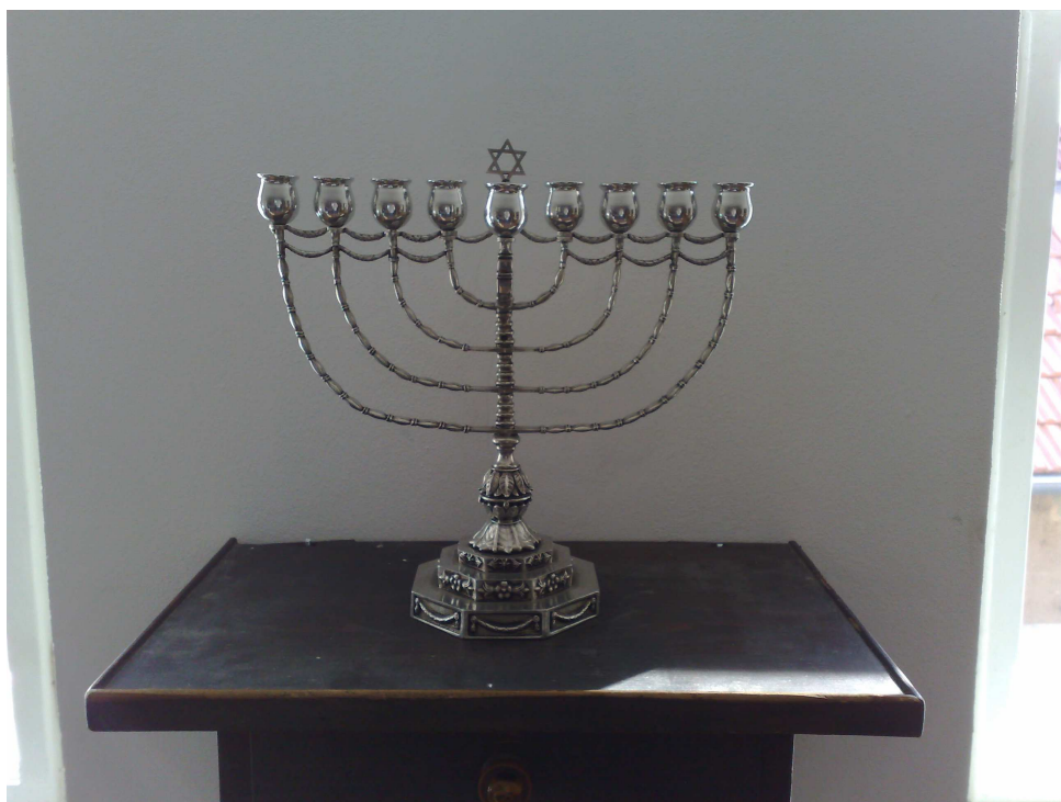
Obr. 6 - židovský devítiramenný svícen 114