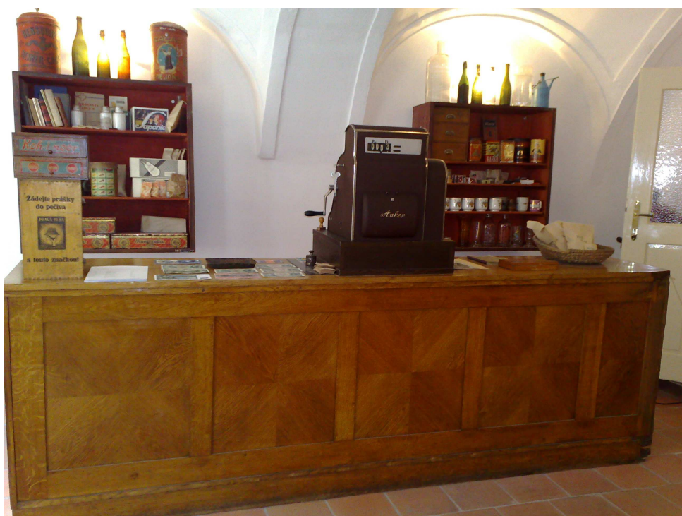
Obr. 7 – židovský obchod 115