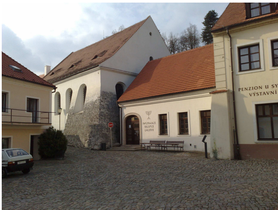
Obr. 2 – zadní synagoga 110