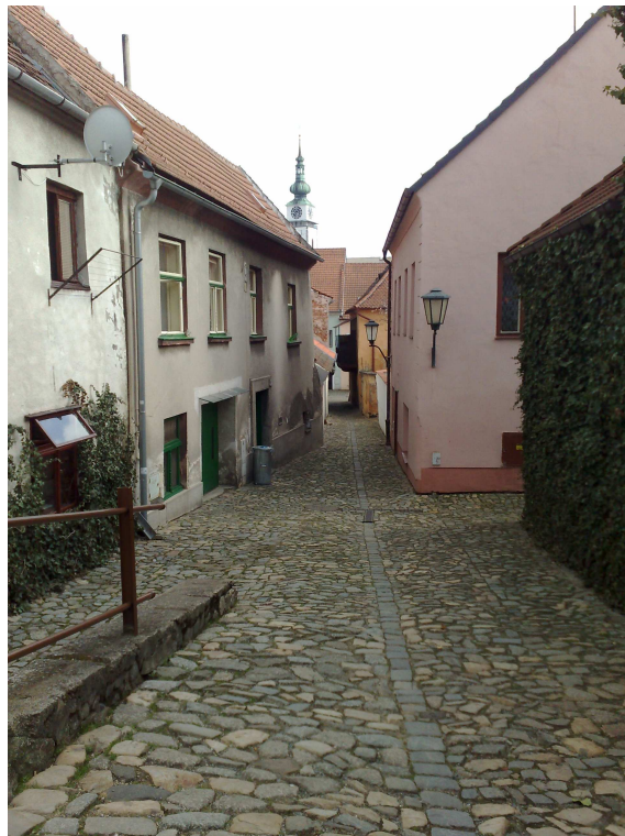
Obr. 9 – Židovská čtvrť (dnes) 117