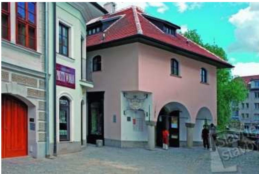
Obr. 1 – židovská brána

Židovskou bránu představoval rozlehlý domovní komplex v jihozápadním rohu ghetta, kterým procházel klenutý průchod. Tento židovský dům se jako jediný nacházel na samém rozhraní židovského a křesťanského prostředí 109 .