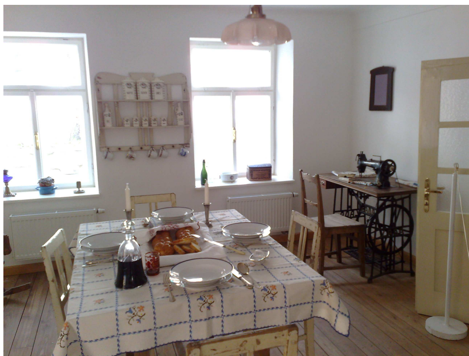
Obr. 5- jídelna muzeum 113