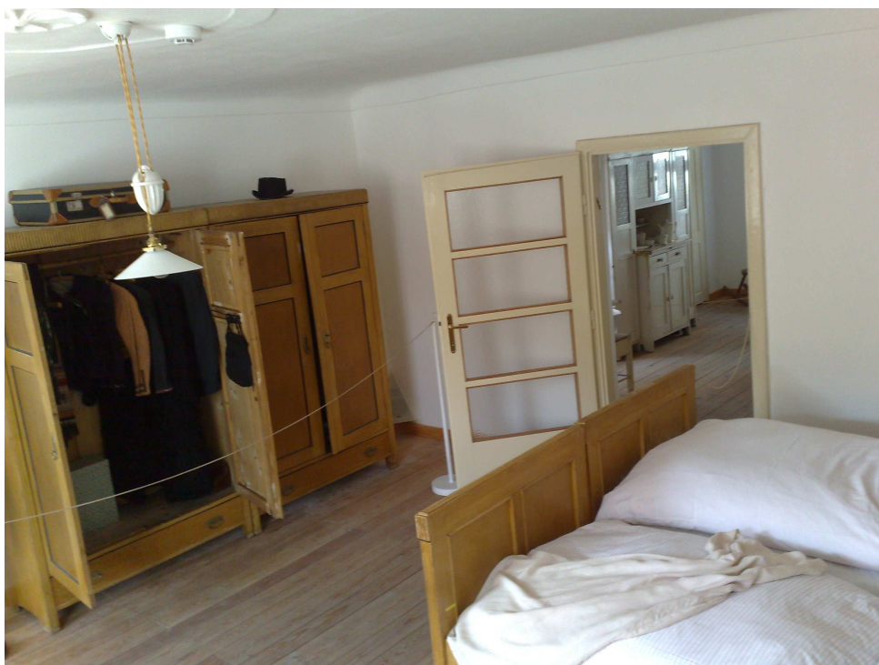
Obr. 4 – ložnice muzeum 112