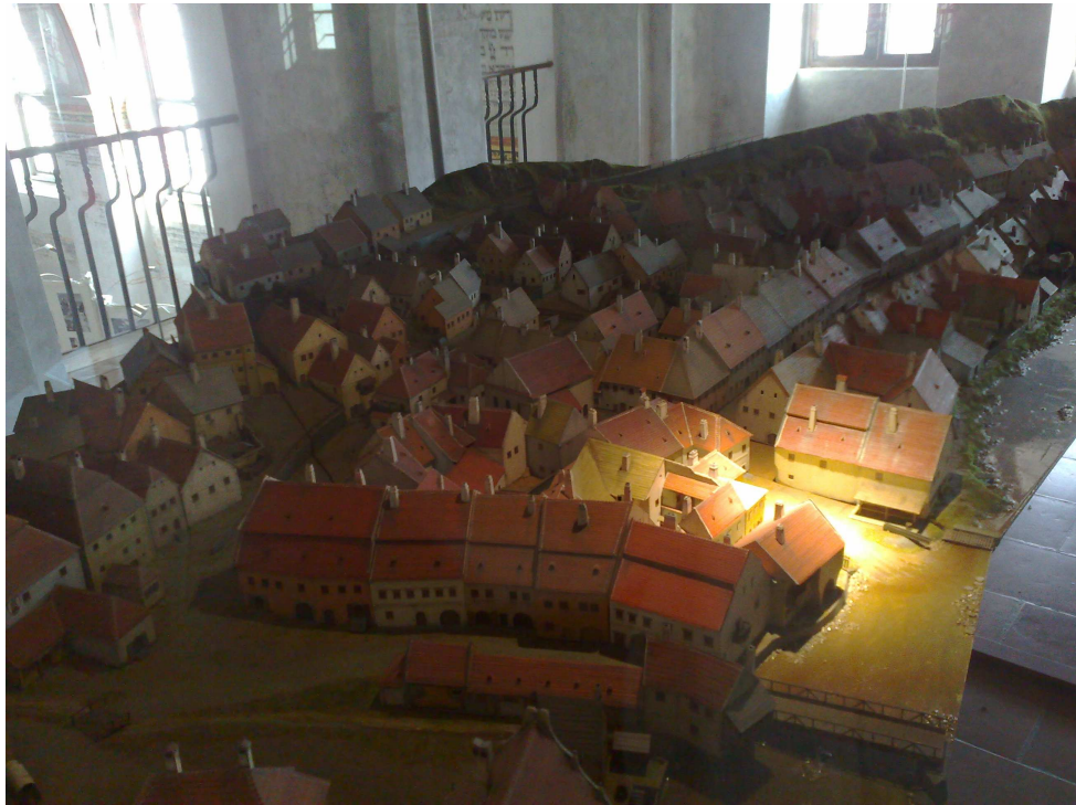
Obr. 8 – model ghetta 116