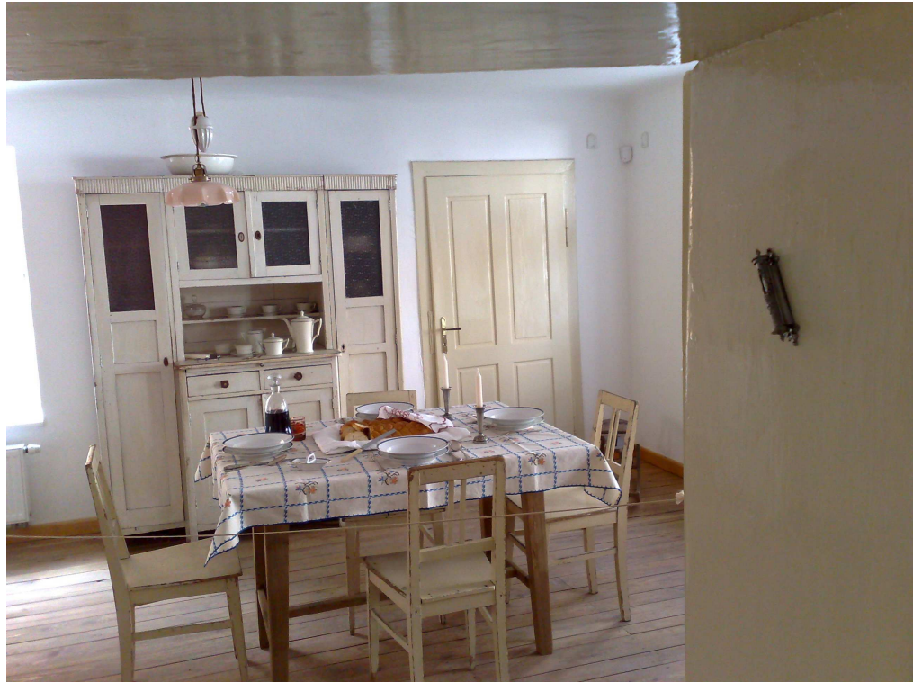
Obr. 10. mezuzá 118

Mezuzá – je malá schránka, kterou Židé umísťujú na rám dverí ve svých domech. Schránka obsahuje pergamen s pasážemi z Tóry