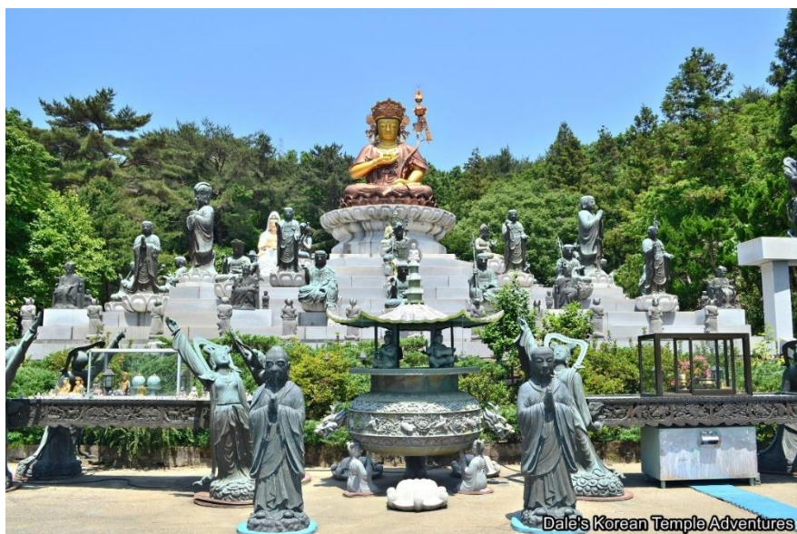
Obrázek 12: Poustevna Čongjonam

Čongjonam má jednu z nejkrásnějších venkovních svatyní zasvěcených bóddhisattvovi posmrtného života Džičangbosalu v celé Koreji. Uprostřed svatyně stojí velká zlatá socha věnovaná vyobrazení Džičangbosalu. Před touto centrální sochou se nachází kadidelnice s dračí základnou, která nejde díky svým detailům přehlédnout (Dale's Korean Temple Adventures, 2020).