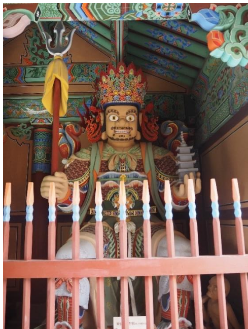
Obrázek 7: Král severu Vaisravana, zdroj: vlastní fotografie, 2023

Poslední král je králem severu a jmenuje se Vaisravana ( Damun čonwang-다문천왕 ). Význam jeho jména je „ten, který vše slyší“. V dlani levé ruky drží relikvie Buddhy a v pravé ruce oštěp. Jako vůdce strážců světových stran je nejsilnějším strážcem Dharmy, má kontrolu nad vodou a deštěm a také jako ochránce materiálního bohatství a duchovní prosperity propůjčuje hodnotu opatrného zacházení s materiálními věcmi a štědrostí (Weekly Wisdom Blog, 2021).