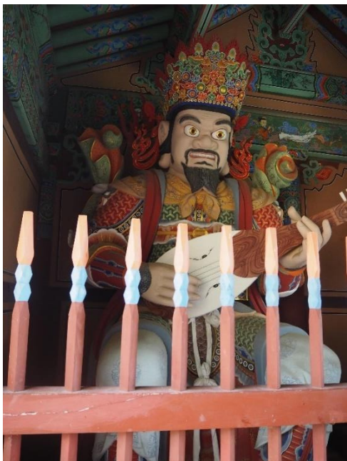
Obrázek 5: Král východu Dhrtarastra, 2023

Jižní král se jmenuje Virudhaka ( Džungdžang čonwang - 증장천왕) a význam jeho jména je „pokrok“. Drží meč, ale neznamená to, že by rád bojoval. Meč představuje spíše moudrost, která dokáže proříznout nevědomost a roztěkané myšlenky. Symbolizuje touhu každý den rozvíjet svou moudrost, což vyžaduje, abychom studovali a praktikovali správná učení. Král nás učí, jak nebýt líný a hledat pokrok v životě, ať už v naší moudrosti, ctnostech, talentu nebo práci.