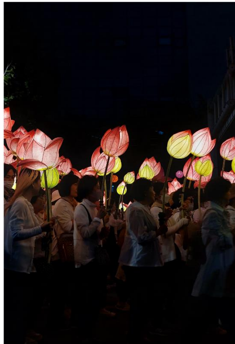
Obrázek 18: Jontunghoe v Soulu, zdroj: vlastní fotografie, 2023