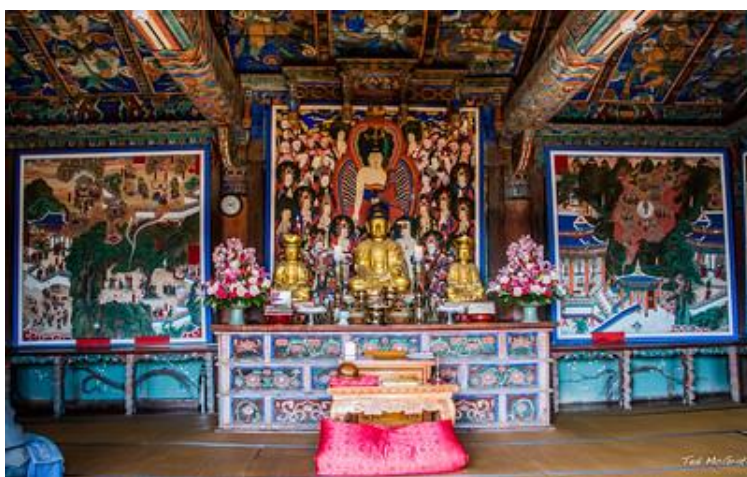
Obrázek 11: Svatyně DOUNGŽON

Tato síň pochází z roku 1602. Považuje se za hlavní chrámovou síň chrámu Pomosa a patří mezi korejské poklady (#424). K této svatyni vede řada schodů, které jsou zdobené kamennými lvy. Vnější stěny haly vybledly, ale stále je viditelný obraz bílého tygra na pravé straně svatyně. Pokud jde o interiér, je krásně zdobený a spočívá na hlavním oltáři. Je zde trojice soch, kdy v jejich středu dominuje Buddha současnosti Shakyamuni, po jeho levici je Buddha budoucnosti Maitreya a po jeho pravici Buddha minulosti Dipamkara. Tyto dřevěné sochy pocházejí z doby kolem roku 1661 a také se považují za korejský poklad (#1526) (선찰대본사 금정총림 범어사, 2020).