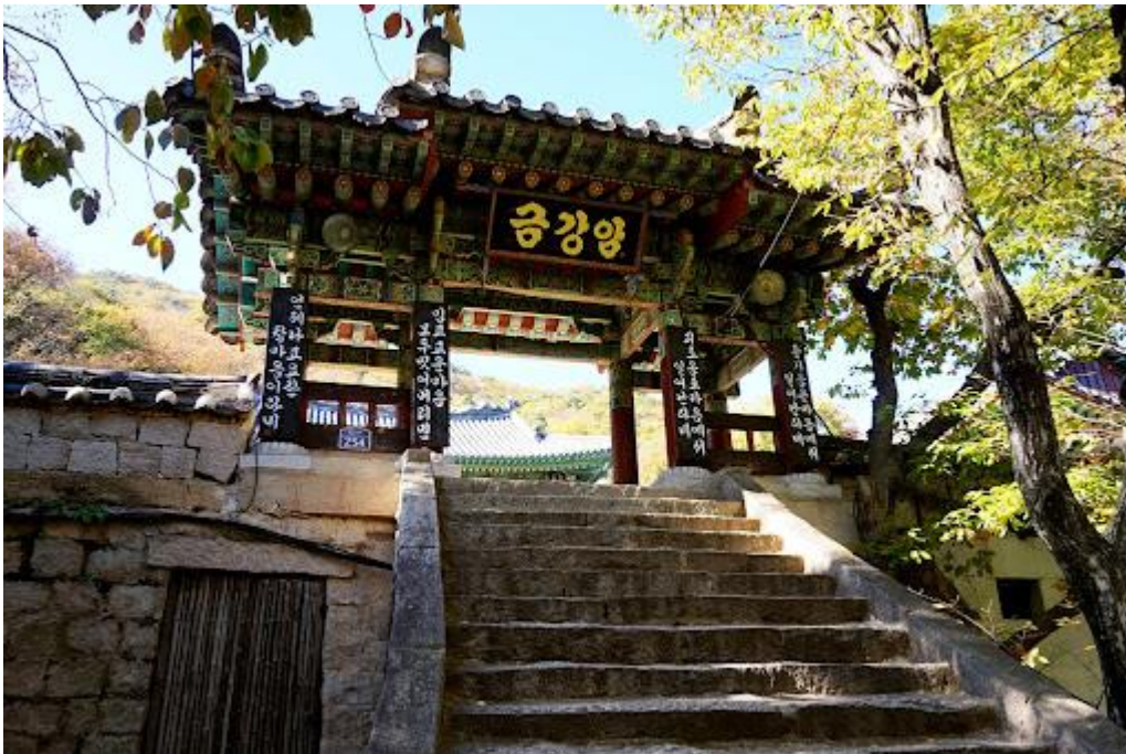
Obrázek 13: Poustevna Kumgangam

Poustevna Kumgangam - 금강암- Diamantová poustevna , je dostatečně velká, aby mohla být samostatným chrámem. Kdyby nebyla připojena k chrámu Pomosa, tak by byla pravděpodobně mnohem slavnější, než už je. Nachází se v krásném přírodním prostředí asi tři sta metrů po kamenném schodišti. Poustevna je domovem několika krásných chrámových svatyní. Součástí těchto svatyní je i poměrně unikátní jeskynní svatyně (Dale's Korean Temple Adventures, 2021).