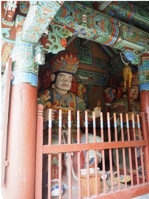
Obrázek 4: Král západu Virupaksa

Král západu se jmenuje Virupaksa ( Gwangmok čonwang - 광목천왕 ) a význam jeho jména je „ten, který vše vidí“. V jedné ruce drží draka nebo hada, kteří symbolizují neustálou změnu. V druhé ruce drží perlu. Ta představuje věčné principy, které se nikdy nemění. Král západu nás tedy učí, jak následovat věčné principy a zároveň se přizpůsobovat neustále se měnícím okolnostem současného světa.