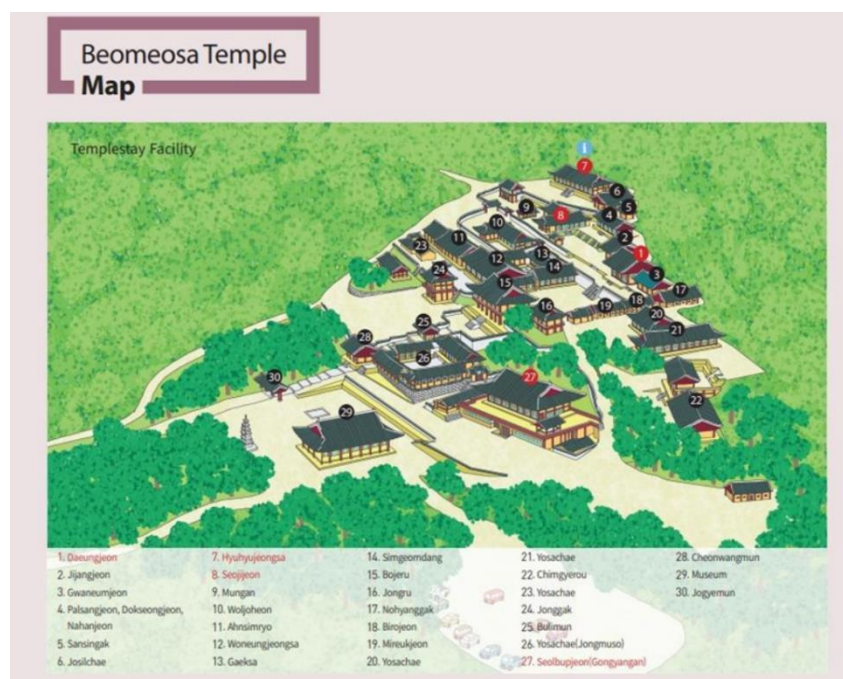
Obrázek 1: Rozložení chrámu Pomosa

Chrámový komplex Pomosa má rozsáhlou plochu a skládá se z několika hlavních budov a struktur. Každá z těchto částí chrámu má svou vlastní důležitou roli v duchovní praxi a rituálech buddhismu.