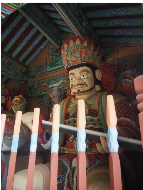
Obrázek 6: Král jihu Virudhaka, zdroj: vlastní fotografie, 2023

Jižní král se jmenuje Virudhaka ( Džungdžang čonwang - 증장천왕) a význam jeho jména je „pokrok“. Drží meč, ale neznamená to, že by rád bojoval. Meč představuje spíše moudrost, která dokáže proříznout nevědomost a roztěkané myšlenky. Symbolizuje touhu každý den rozvíjet svou moudrost, což vyžaduje, abychom studovali a praktikovali správná učení. Král nás učí, jak nebýt líný a hledat pokrok v životě, ať už v naší moudrosti, ctnostech, talentu nebo práci.