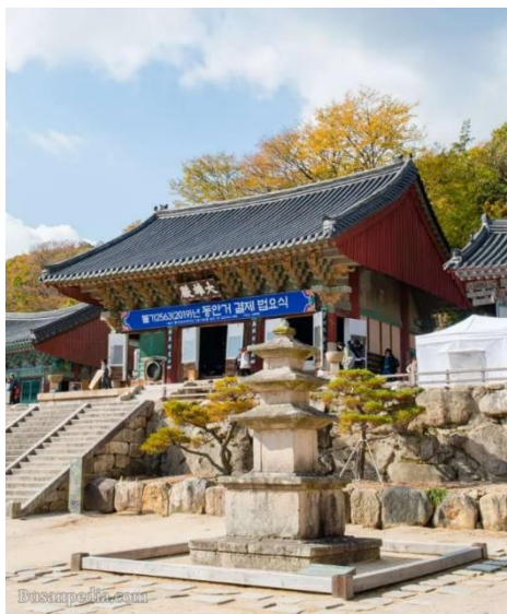
Obrázek 10: Třípatrová kamenná pagoda