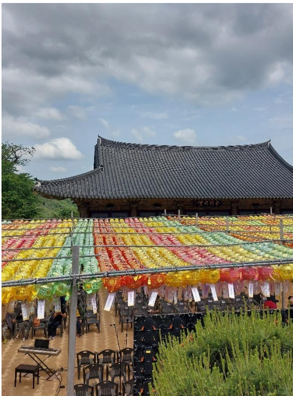
Obrázek 17: Pomosa během oslav Buddhových narozenin, zdroj: vlastní fotografie, 2023

Narození Buddhy se slaví podle lunárního kalendáře a slaví se jako korejský státní svátek. Buddhovy narozeniny jsou v Koreji oblíbeným svátkem a lidovou oslavou a často je slaví i lidé různých náboženských vyznání. Slaví se osmý den čtvrtého lunárního měsíce a v tento den mnoho chrámů poskytuje jídlo a čaj zdarma všem návštěvníkům. Tento svátek je spojen s velkým festivalem lampiónů, který je zapsaný na seznamu UNESCO jako kulturní dědictví. Lotosové lucerny visí v chrámech po celý měsíc a lucerny se věší i v domácnostech a na ulicích.