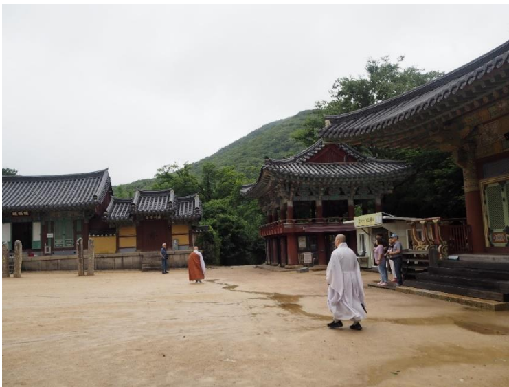
Obrázek 9: Dolní nádvoří, zdroj: vlastní fotografie, 2023

Zvonice, známá též jako Džongnu - 종루, má důležitý význam v buddhistických chrámech. V chrámovém komplexu slouží několika účelům. Tradičně se zvoní v určitých časech, aby se označil běh času, včetně ranních a večerních rituálů, stejně jako v dobu jiných důležitých událostí v chrámu. Dále se využívá k invokaci – vzývání, protože se věří, že zvuk zvonu nese modlitby do nebes. Zvuk zvonu také slouží jako připomínka všímavosti a meditační praxe. Slyšení zvonu může povzbudit praktikující, aby se zastavili, soustředili a vrátili zpět do přítomného okamžiku. V neposlední řadě má samotná zvonice v areálu chrámu symbolický význam. Představuje učení buddhismu šířící se široko daleko a zasahující všechny cítící bytosti poselstvím osvícení a soucitu (Kim, 1994).