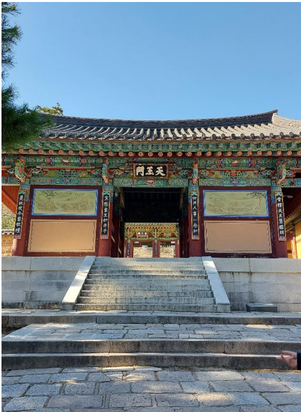
Obrázek 3: Čonwangmun, zdroj: vlastní fotografie, 2023

Druhou branou je brána Čonwangmun - 천왕문- Brána strážných králů . Této bráně dominují čtyři strážní králové čtyř hlavních směrů za účelem ochrany Buddhy-dharmy. Tato brána byla původně postavená v roce 1699, ale 16. prosince 2010 byla tragicky zničena člověkem pracujícím v chrámu, který nebyl spokojený se svým životem. Brána byla do základu vypálena. Tento čin byl naštěstí napraven v létě 2012 přestavbou téměř totožné repliky brány (Kim, 1994).