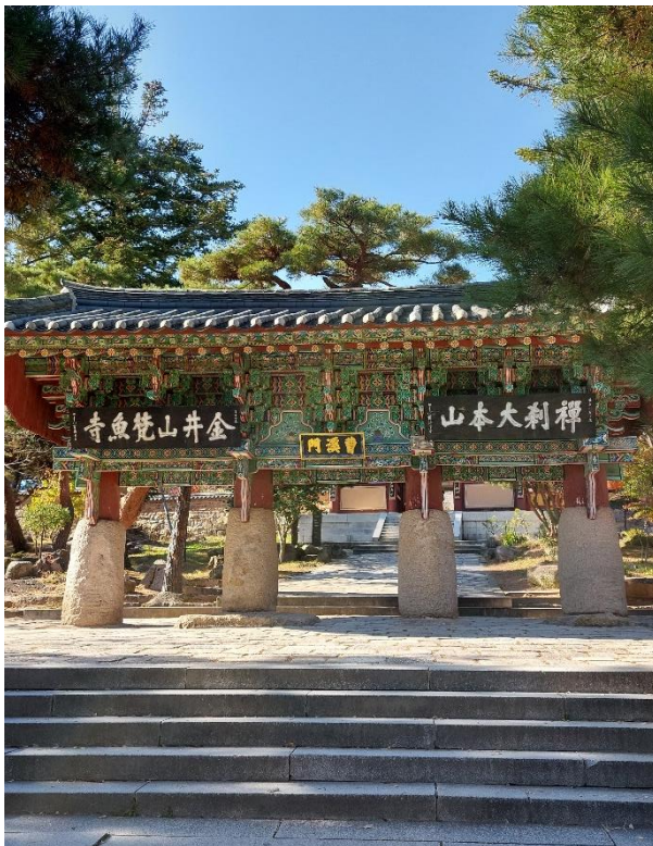
Obrázek 2: Čogjemun, zdroj: vlastní fotografie, 2023

Když se poprvé přiblížíte k chrámu po široké kamenné cestě a kolem sbírky kamenů s vyrytými obrazy, narazíte na první ze čtyř vstupních bran do chrámu. První brána je Ildžumun - 일주문 - Brána jednoho pilíře . Bráně se takto přezdívá, protože při pohledu ze strany vypadá, jako kdyby střechu brány držel pouze jeden sloup. Ve skutečnosti se tato brána nazývá Čogjemun - 조계문, pochází z roku 1614 a je to jeden z pokladů Koreje (#1461) (Kim, 1994).