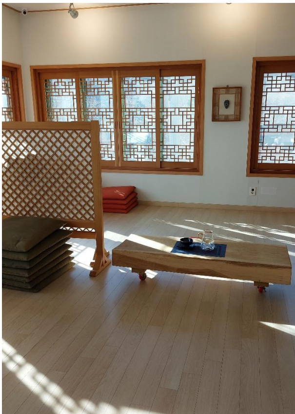
Obrázek 16: Prostory Templestay, 2023

Poslední část programu zahrnovala meditaci, kterou z počátku řídila sama mniška, abychom věděli, jak správně dýchat. Meditace trvala 10 minut. Po meditaci nás mniška uklidnila, že fyzické nepohodlí a nedostatek kontroly nad myslí je pro nezkušené velmi normální. Osobně jsem se dokázala soustředit asi polovinu času, ale poté mi začala vybraná poloha být nepříjemná, takže ve zbytku času jsem se jen snažila zjistit, jak uvolnit nohy. Následně nám byl servírován čaj a bylo nám vysvětleno, jakým způsobem z pití čaje udělat rituál. Během pití čaje jsme měli prostor na otázky směrem k mnišce a dostali jsme hned několik moudrých rad do života, což bylo moc hezké zakončení programu.