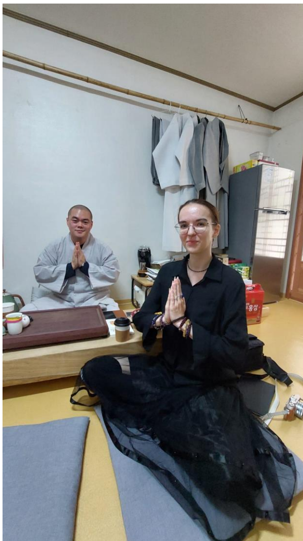
Obrázek 19: Fotografie s mnichem, zdroj: vlastní fotografie, 2023