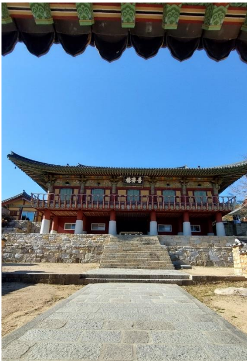
Obrázek 8: Bulimun, zdroj: vlastní fotografie, 2023

Třetí a poslední branou na cestě do chrámu je brána Bulimun - 불이문 - Brána neduality . Termín nedualita znamená střední cestu, která přesahuje relativní dualitu. Není žádný rozdíl mezi bytím a nebytím nebo zrozením a smrtí. Tato brána byla přestavěna, aby se chrám Pomosa přiblížil k původnímu uspořádání chrámu. Nyní zahrnuje masivní pavilon Bodžeru - 보제루, pod kterým lidi procházejí, aby získali vstup na dolní nádvoří. Brána Bulimun i pavilon Bodžerun byly postaveny kolem roku 2015 (Kim, 1994).