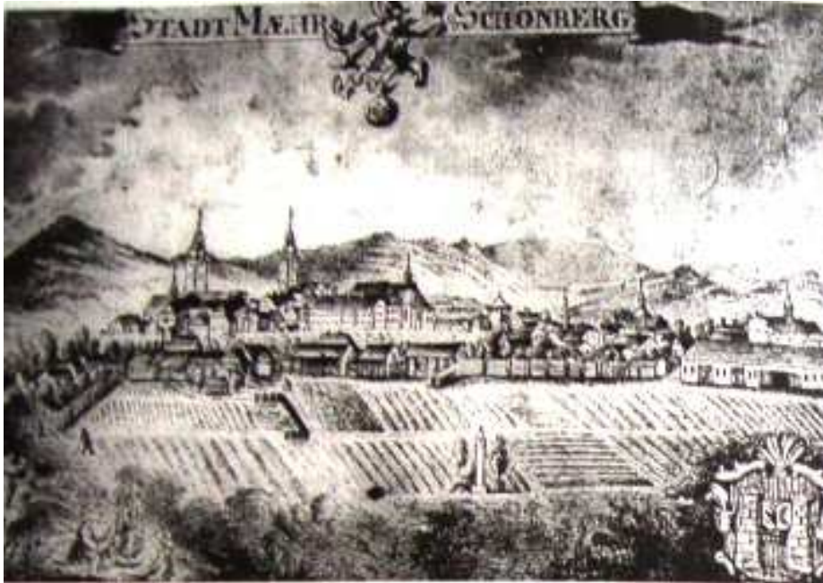
Obrázek 3: Veduta města Šumperka z počátku 18. století.

Zdroj: Spurný František, Cekota Vojtěch, Kouřil Miloš, Šumperský farář a děkan Kryštof Alois Lautner, oběť čarodějnických inkvizičních procesů. Šumperk, 2000, str. 32.