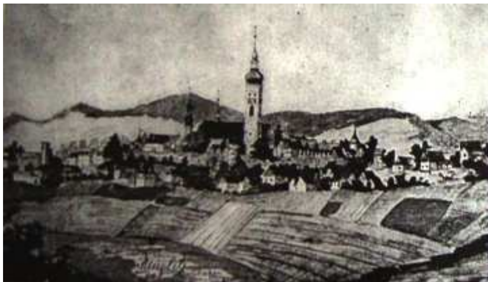
Obrázek 6: Údajná veduta města Mohelnice ze 17. století.