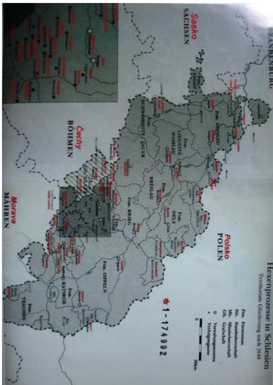
Příloha 3. – Mapa čarodějnických procesů ve Slezsku z roku 1648.