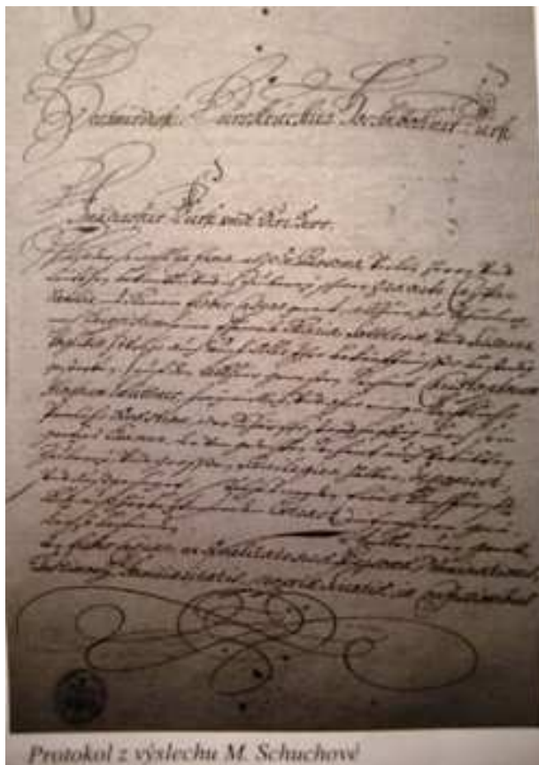
Obrázek 2: Protokol z výslechu M. Schuchové.