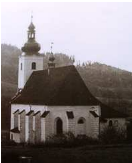
Obrázek 1: sobotínský kostel, ze kterého vernířovická žebračka ukradla sv. hostii.