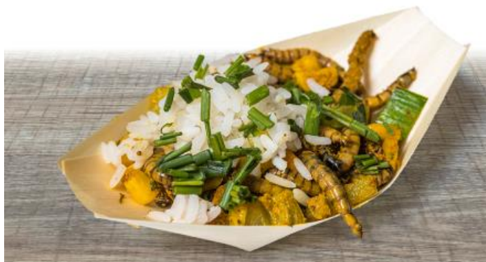
Obrázek č. 8. Pokrm připravený z celých zástupců hmyzu