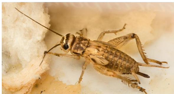
Obrázek č. 3. Cvrček domácí ( Acheta domestica ) [foto]. In Naturfoto [online]. [staženo 2023-02-15].

Dostupné z: https://www.naturfoto.cz/cvrcek-domaci-fotografie-14201.html