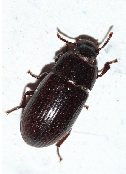
Obrázek č. 4. Potemník stájový ( Alphitobius diaperinus) [foto].

Potemník stájový ( Alphitobius diaperinus ) je druhem hmyzu, který může být po schválení žádosti podané firmou Ynsect NL B. V. uveden na trh Evropské unie. Se schvalovacím procesem se pojí prováděcí nařízení komise EU 2023/58 ze dne 5. ledna 2023, kterým se povoluje uvedení zmrazených, kašovitých, sušených a práškových forem larev potemníky stájového. Firma požádala, aby výše zmiňované formy zpracování larev potemníka moučného byly používány jako složky potravin potravinářských výrobků a aby byly ve formě prášku přidávány do doplňků stravy pro běžnou populaci. Podnik rovněž požádal Komisi Evropské unie o ochranu dat a vědeckých údajů, které se pojí s postupy zpracování hmyzu (Nařízení EU 2023/58).