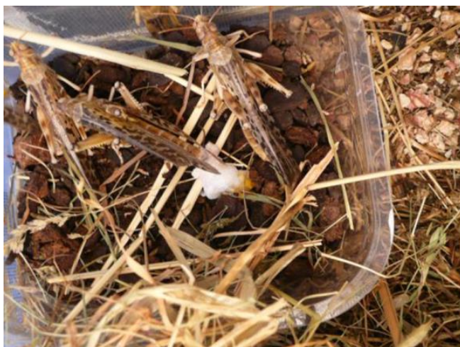
Obrázek č. 7. Domácí chov saranče všežravé ( Schistocerca gregaria ) In: Jak na hmyz [online]. [staženo: 2023-03-20]. Dostupné: http://www.jaknahmyz.cz/sarance