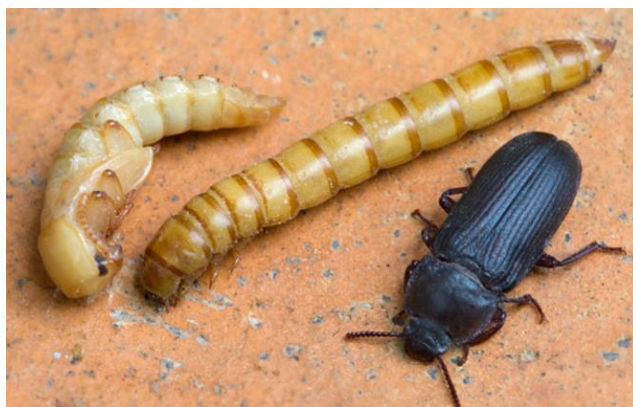
Obrázek č. 5. Vývojové stádium potemníka moučného ( Tenebrio molitor)

Jedná se o zástupce hmyzu, který prošel schvalovacím procesem č. 2021/882. Byl schválen Evropskou komisí dne 1. června 2021. na žádost společností SAS EAP Group. Společnost požádala o ochranu dat se zabezpečením informací na produkt sušených larev potemníka moučného. Pouze společnost SAS EAP Group může tuto novou potravinu uvádět na trh, a to do té doby, než bude ochrana dat a informací ukončena 22. 6. 2026. Do tohoto data může firma uvádět na trh celé Evropské unie moučného červa jako novou povolenou potravinu v souladu s podmínkami prováděcí nařízení Komise (Nařízení EU č. 2021/882). Ostatní podniky mohou od firmy SAS EAP Group produkty moučného červa kupovat a využívat je při výrobě vlastních produktů. Avšak mohou být zpracovány pouze tak, aby vyhovovaly specifickým údajům, které jsou předepsány v seznamu Evropské unie (Ministerstvo zemědělství, 2023).