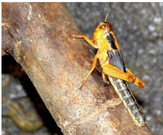
Obrázek č. 6. Saranče stěhovavá [foto]. In ZOO Chleby [online]. Upraveno [staženo 2023-02-15]. Dostupné z: https://www.zoochleby.cz/sarance-stehovava-6268/