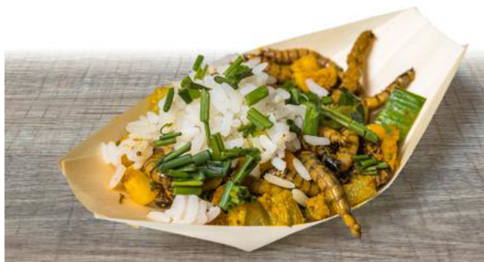
Obrázek č. 8. Pokrm připravený z celých zástupců hmyzu [foto].