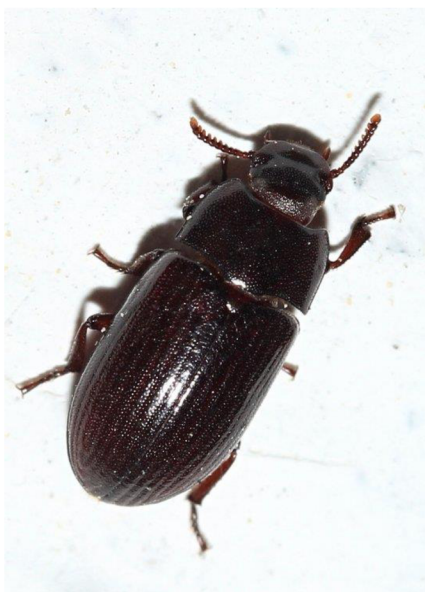
Obrázek č. 4. Potemník stájový ( Alphitobius diaperinus)

Potemník stájový ( Alphitobius diaperinus ) je druhem hmyzu, který může být po schválení žádosti podané firmou Ynsect NL B. V. uveden na trh Evropské unie. Se schvalovacím procesem se pojí prováděcí nařízení komise EU 2023/58 ze dne 5. ledna 2023, kterým se povoluje uvedení zmrazených, kašovitých, sušených a práškových forem larev potměnky stájového. Firma požádala, aby výše zmiňované formy zpracování larev potměníka moučného byly používány jako složky potravin potravinářských výrobků a aby byly ve formě prášku přidávány do doplňků stravy pro běžnou populaci. Podnik rovněž požádal Komisi Evropské unie o ochranu dat a vědeckých údajů, které se pojí s postupy zpracování hmyzu (Nařízení EU 2023/58).