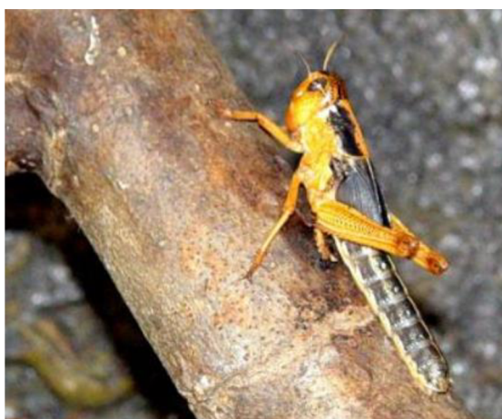
Obrázek č. 6. Saranče stěhovavá