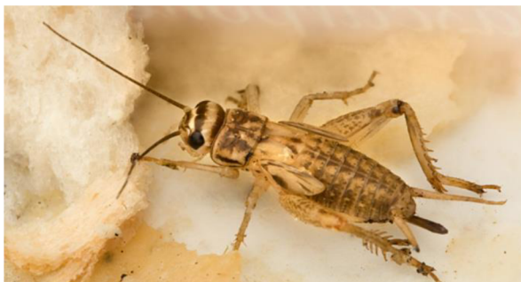
Obrázek č. 3. Cvrček domácí ( Acheta domestica)

Tento hmyzí zástupce prošel taktéž schválením Evropské komise. Společnost Fair Insects BV předložila 28. prosince 2018 Komisi EU nařízení č. 2015/2283 s žádostí o uvedení zmrazených, sušených a práškových forem Acheta domestica na trh unie jako novou potravinu. Dne 10. 2. 2022 byla žádost přijata jako Prováděcí nařízení Komise Evropské unie č. 2022/188. Společnost taktéž žádala o ochranu dat, která platí do 3. 3. 2027 (Ministerstvo zemědělství, 2023).