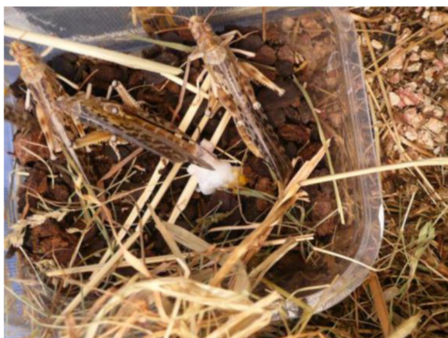
Obrázek č. 7. Domácí chov saranče všežravé ( Schistocerca gregaria ) In: Jak na hmyz [online]. [staženo: 2023-03-20]. Dostupné: http://www.jaknahmyz.cz/sarance