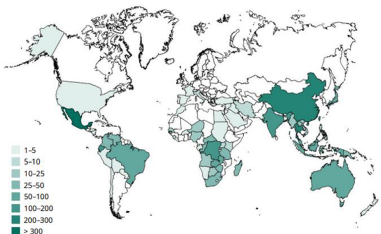
Obrázek č. 1. Zaznamenaný počet konzumovaných druhů hmyzu podle zemí [foto]. In: Fao.org [online]. Upraveno [cit. 2023-02-02]. Dostupné z: https://www.fao.org/3/i3253e/i3253e.pdf

Obrázek 1 znázorňuje míru konzumace jedlých druhů hmyzu podle jednotlivých států v celosvětovém měřítku. Státy jako je například Mexiko a Čína patří v oblasti počtu konzumovaných druhů hmyzu na první příčky, kdy hodnota přesahuje 300 druhů konzumovaného hmyzu. Na mapě jsou zvýrazněny tmavě zelenou barvou. Státy vyznačené bílou barvou, jako je například Kanada, Rusko a velká část evropských států představují opak v počtu konzumovaných druhů hmyzu. Hmyz se zde vůbec nekonzumuje nebo pouze v malé míře, což čítá 1-5 druhů hmyzu.