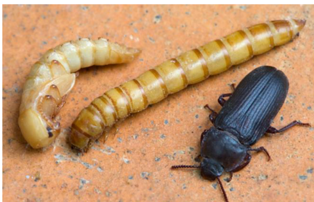
Obrázek č. 5. Vývojové stádium potemníka moučného ( Tenebrio molitor)

Jedná se o zástupce hmyzu, který prošel schvalovacím procesem č. 2021/882. Byl schválen Evropskou komisí dne 1. června 2021. na žádost společností SAS EAP Group. Společnost požádala o ochranu dat se zabezpečením informací na produkt sušených larev potemníka moučného. Pouze společnost SAS EAP Group může tuto novou potravinu uvádět na trh, a to do té doby, než bude ochrana dat a informací ukončena 22. 6. 2026. Do tohoto data může firma uvádět na trh celé Evropské unie moučného červa jako novou povolenou potravinu v souladu s podmínkami prováděcí nařízení Komise (Nařízení EU č. 2021/882). Ostatní podniky mohou od firmy SAS EAP Group produkty moučného červa kupovat a využívat je při výrobě vlastních produktů. Avšak mohou být zpracovány pouze tak, aby vyhovovaly specifickým údajům, které jsou předepsány v seznamu Evropské unie (Ministerstvo zemědělství, 2023).