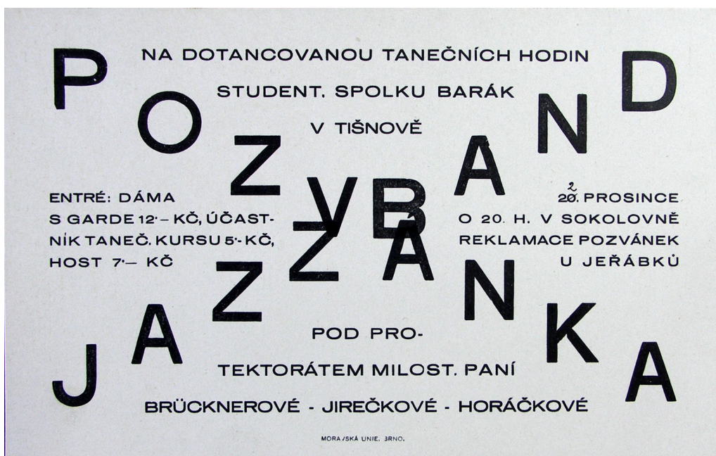
Obr. 6: Pozvánka na dotancovanou tanečních hodin

SOkA Brno-venkov, Fond G-58 Barák, spolek studentstva na Tišnovsku, i. č. 14.