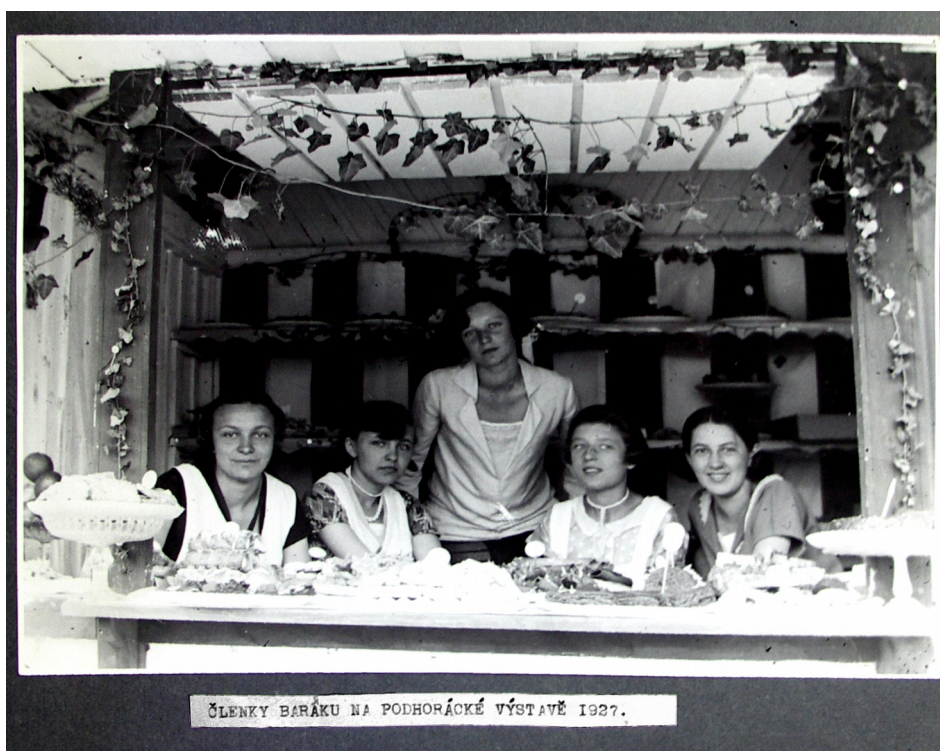
Obr. 4: Členky Baráku na Podhorácké výstavě 1927