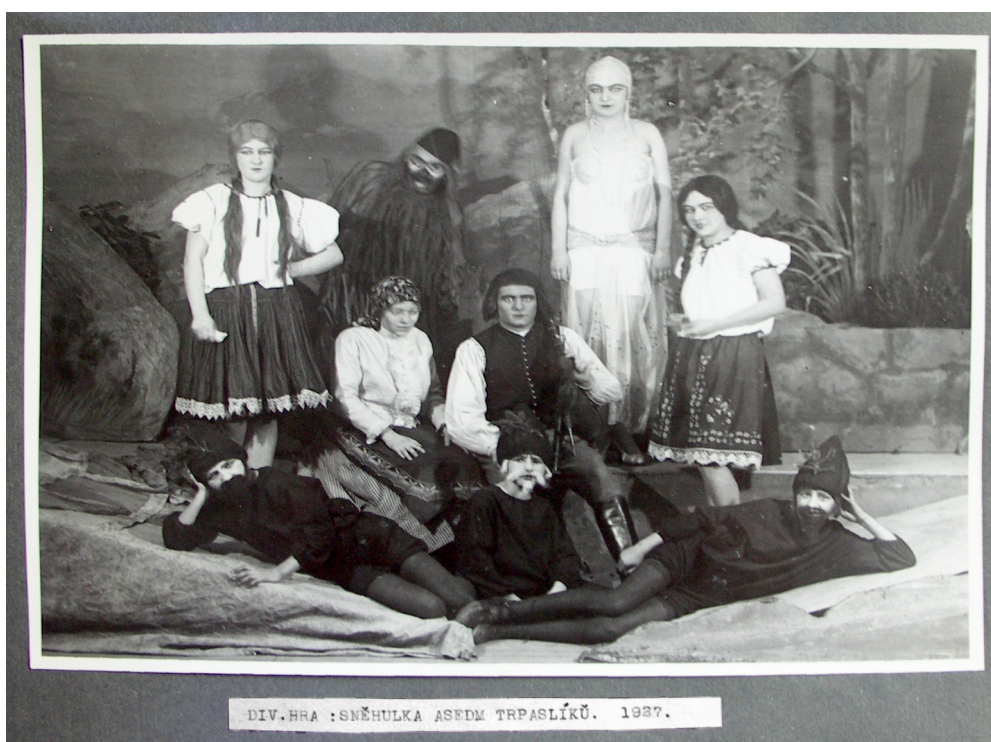
Obr. 5 Divadelní představení Sněhurka a sedm trpaslíků (r. 1927)

SOkA Brno-venkov, Fond G-58 Barák, spolek studentstva na Tišnovsku, i. č.15, list č.1.