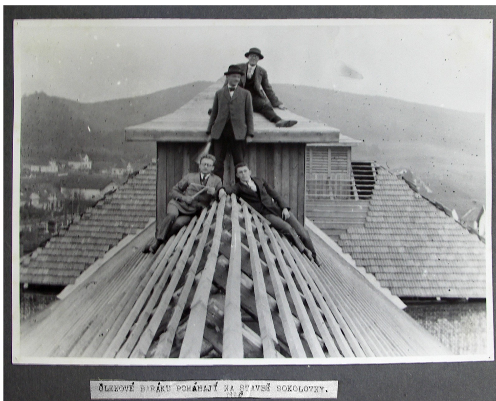
Obr. 7: „Členové Baráku pomáhají na stavbě Sokolovny“