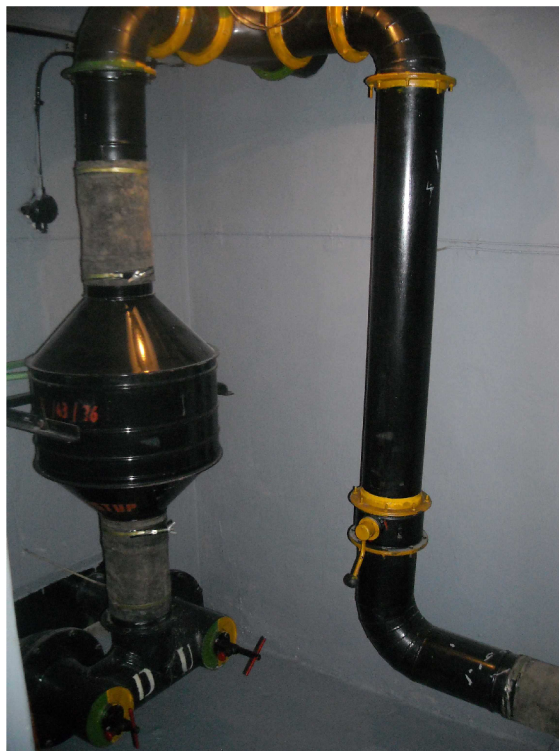
Obrázek 3, hrubý prachový filtr