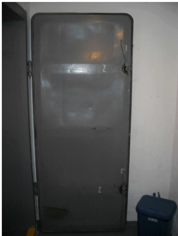
Obrázek 2, tlakově plynotěsné dveře STOÚ