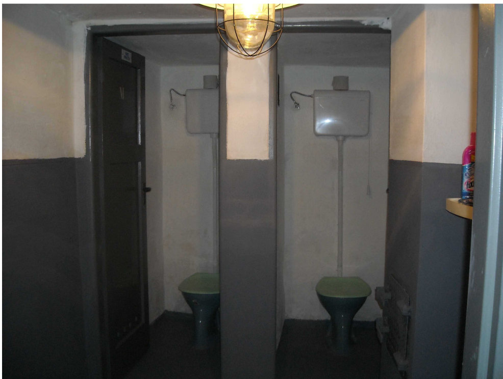
Obrázek 6, sociální zařízení STOÚ