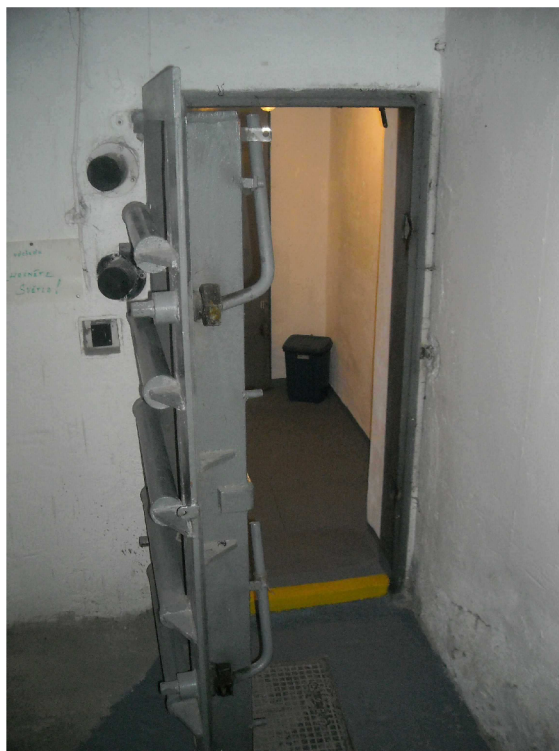
Obrázek 1, vchod do STOÚ – tlakově odolné dveře

Fotografie autora práce byly pořízeny a použity se souhlasem pracovníků oddělení Ochrany obyvatelstva MČ Brno-sever dne 24.2.2010.