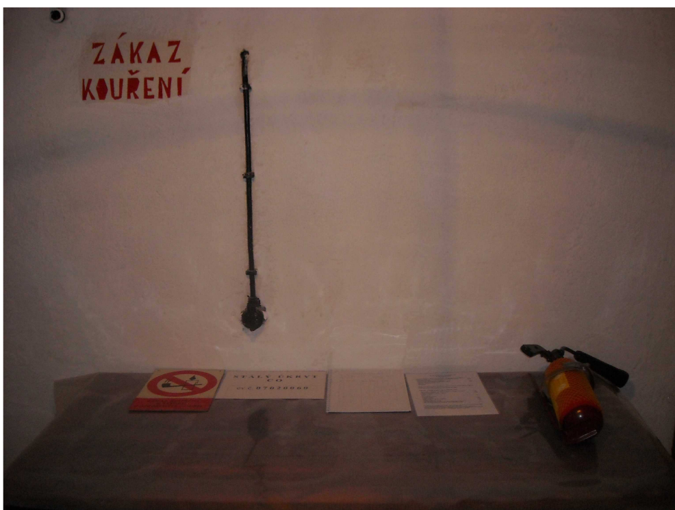
Obrázek 5, stůl velitele v místnosti KD