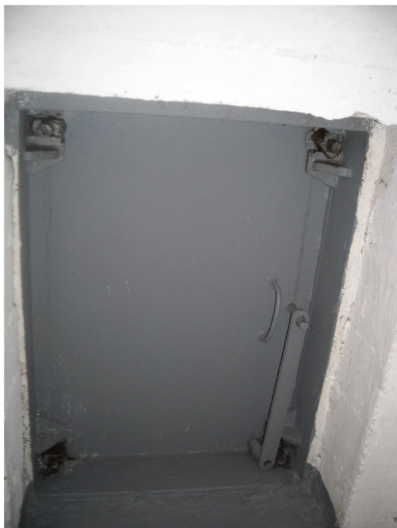
Obrázek 8, nouzový výlez STOÚ