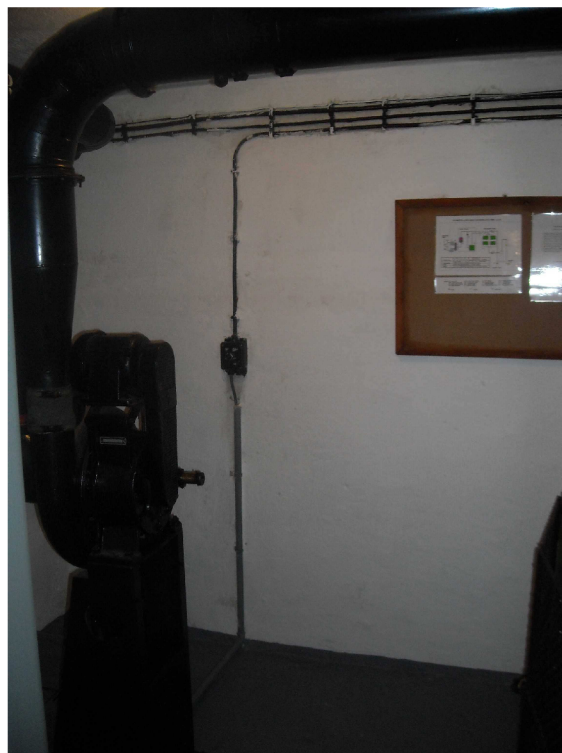
Obrázek 9, pohled do místnosti s FVZ