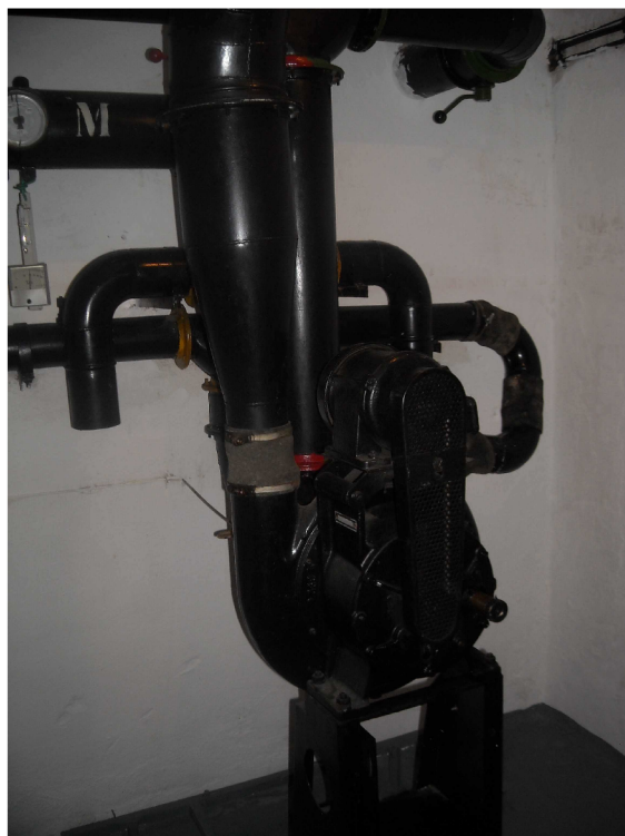
Obrázek 10, detail FVZ