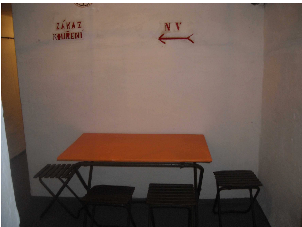
Obrázek 7, prostor pro ukryvané osoby