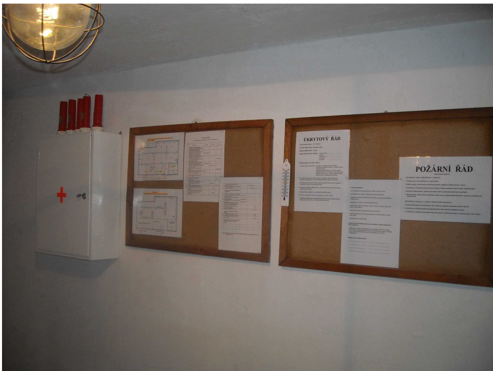
Obrázek 4, dokumentace v místnosti KD