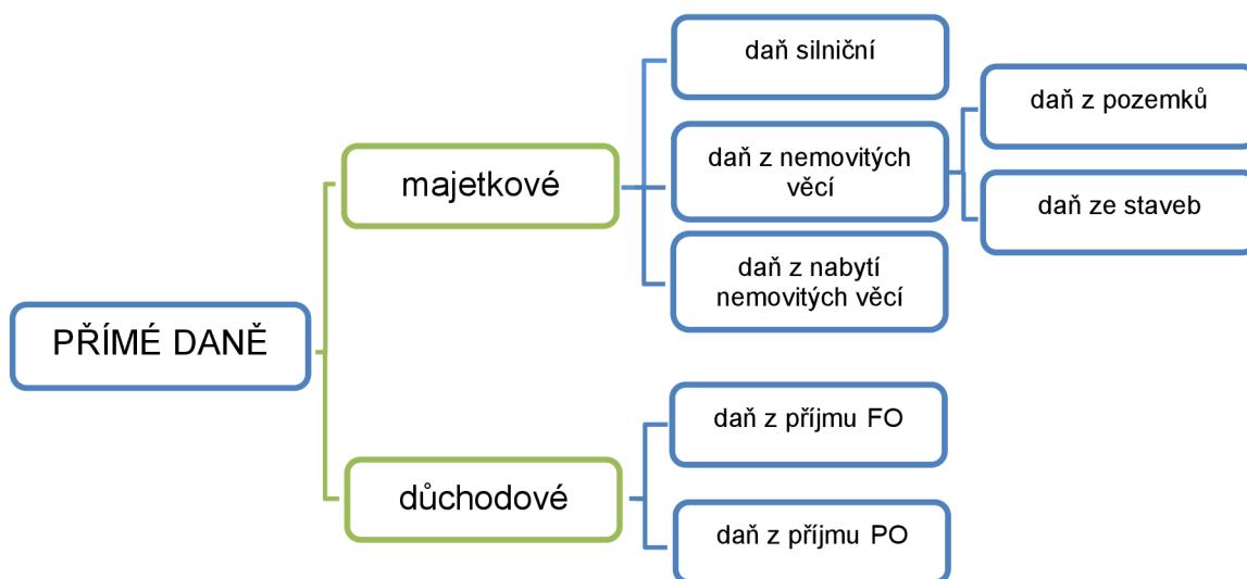
Obrázek č. 1 – Daňová soustava přímých daní

Přímé daně dělíme na důchodové a majetkové. Do kategorie majetkových daní řadíme daň silniční, daň z nemovitých věcí a daň z nabytí nemovitých věcí. Do kategorie důchodových daní řadíme daň z příjmu fyzických a právnických osob. Členění přímých daní je znázorněno na obrázku č. 1.