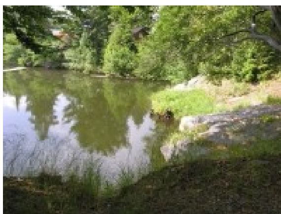
Obrázek 13. Lom Dalov

Původně hluboký lom na břidlici asi 20 km severně od Olomouce. Nyní je téměř úplně zatopený. V jeho okolí se nachází chatová oblast, takže v létě jej místní obyvatelé i ostatní návštěvníci často využívají. Je vhodný ke koupání.