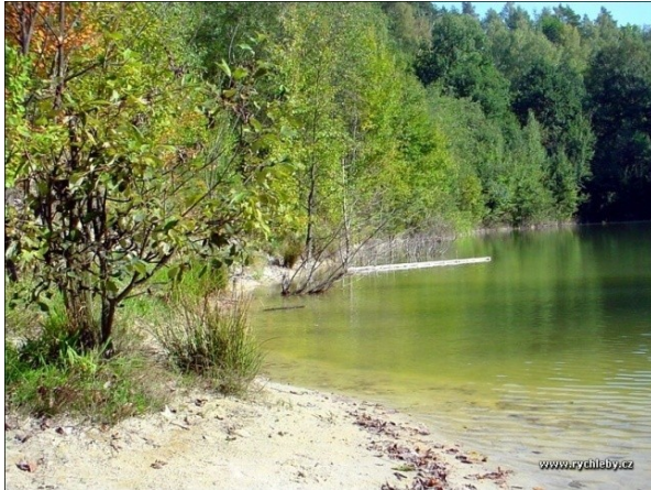
Obrázek 16. Kaolinka