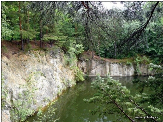
Obrázek 20. Roklina

má lom díky vysokým stěnám problematický přístup k vodě. V lomu byl zaznamenán výskyt raka říčního a malých ryb. Výskyt raka je tedy známkou velké čistoty vody.