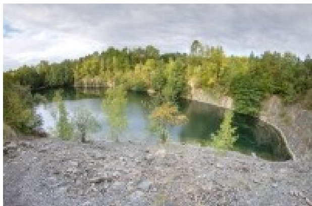
Obrázek 4. Kamenolom Olšovec

Na okraji vesnice Olšovce nedaleko Přerova se u lesa nachází bývalý lom na pokrývačské břidlice. Od silnice je dobře přístupný krátkým vylámaným úvozem. Západní břeh je strmý, na východním lze vystoupat na lomovou etáž a tam si odpočinout nebo z ní na několika místech sejít k vodě. Koupání je zde povoleno, táboření nikoli. Setkáme se i s jiným názvem – Přední skála.