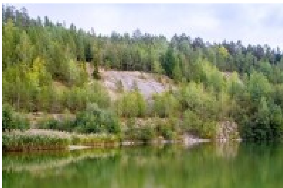
Obrázek 10. Lom u Nové Vsi

Lom v Nové Vsi u Litovle sloužil k těžbě drob. Po ukončení těžby zde vzniklo 280 metrů dlouhé jezero, které je dnes využíváno ke koupání. Jeho travnaté pláže udržuje přes léto obec, návštěvníci budou příjemně překvapeni i tím, že je zde možnost občerstvení. Nejlepší přístup je právě od Nové Vsi.