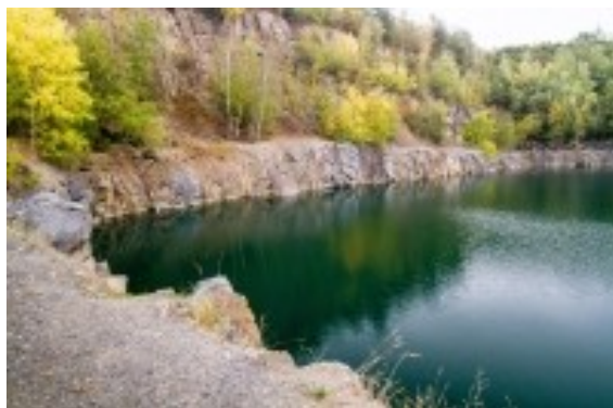
Obrázek 6. Lom Výkleky

Zatopený kamenolom ve Výklekách tvoří součást rozsáhlejšího pásma lomů, které slouží k dobývání kvalitních drob. V okolí se sice ještě těží, ale koupání a potápění je zde povoleno. Jezero má hloubku až sedm metrů a bývá příjemně čisté. V létě zde bývá mnoho lidí. Nad lomem je velké parkoviště a v sezóně tu stává i stánek s občerstvením. Vstup do lomu i do vody jsou na vlastní nebezpečí a táboření zde zatím není povoleno. V minulosti byla evidována utonutí a značným nebezpečím pro plavce mohou být padající kameny ze skal do vody.