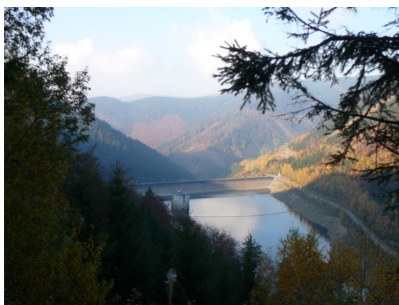
Obrázek 2. Dlouhé stráně – Dolní nádrž

Dlouhé Stráně jsou tvořeny dvěma nádržemi Horní a Dolní. Dolní slouží jako vodní nádrž pro Horní. Dolní nádrž protéká řeka Divoká Desná. Horní i dolní nádrž slouží jako přečerpávací vodní elektrárny. Z hlediska turismu je to poměrně zajímavý cíl. K nádrži je možné se dostat na kole, autobusem či autem na zvláštní povolení. Další možností jak se dostat k vodnímu dílu je využití lanovky z Kout nad Desnou a z horní stanice jít pěšky k Horní nádrži. Okolo nádrže je asfaltová cesta kde není dovoleno jezdit na kole, koloběžkách a ani na bruslích. Nedá se zde sportovat, ani rybařit. Ale i přes tyto zákazy je to místo zajímavé a stojí za to, jej navštívit.