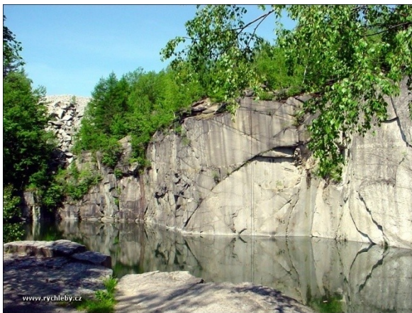
Obrázek 17. Rampa

Jeden z dominantních a často navštěvovaných lomů v Černé Vodě, jehož hlavní zvláštností je naříznutá vysoká kolmá stěna. Na první křižovatce (směrem od Žulové) odbočíme vpravo a po červeném značení dojdeme až k lomu.