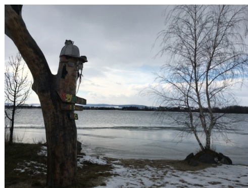
Obrázek 9. Náklo