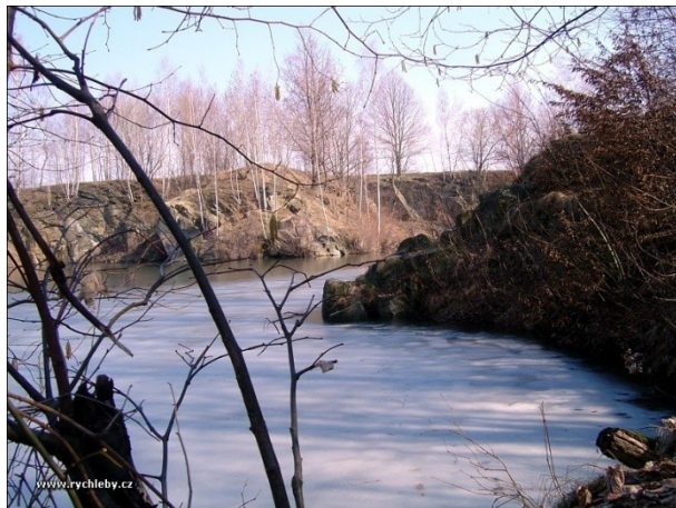
Obrázek 18. Vaněk

Jeden z neznámějších žulových lomů v kraji. V letních dnech zde bývá mnoho návštěvníků. Jedná se o krásný lom schovaný v terénu. Lom najdeme po pravé straně cesty z Žulové směr na Javorník.