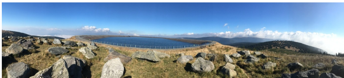
Obrázek 3. Dlouhé stráně – Horní nádrž