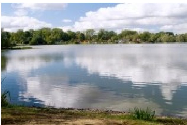
Obrázek 11. Hustopečské jezero

Štěrkopísky uložené v okolí řeky Bečvy se těžily na celé řadě míst. Někde těžba ještě probíhá, jinde již skončila a vzniklé vodní plochy slouží rybářům i k rekreaci. Plochou nejrozsáhlejší jezera leží v jižním sousedství Milotic. Jezer je celkem pět, ale jsou od sebe oddělena úzkými šíjemi, což umožňuje považovat je za jeden celek. Největší rekreační zázemí včetně restaurace a travnatých pláží je na východní straně areálu. Na ostatních místech jde spíše o menší pláže skryté mezi stromy. Na protějším břehu Bečvy, kde leží několik dalších menších jezer, byla v roce 2013 vyhlášena přírodní památka Hustopeče – Štěrkáč.