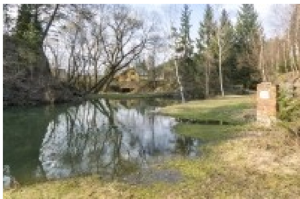
Obrázek 7. Lom Baldovec

Koupání je zde povoleno na vlastní nebezpečí. Maximální hloubka lomového jezera je kolem 7 m, viditelnost ve vodě je velmi malá – i tak ale bývá občas využíván potápěči.