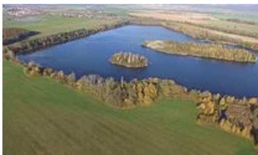
Obrázek 22. Chomoutovské jezero

Jak uvádí server věnující se ochraně přírody a chráněným lokalitám www.ochranaprirody.cz , je kvůli vyrušování hnízdících ptáků na Chomoutovském jezeře zákaz koupání a vodních sportů (využívajících různých plavidel), vyjma těch, které získaly odůvodněnou výjimku z tohoto zákazu. Území trpí rovněž velkým množstvím nelegálních skládek, které jsou zde zakázány. I zde se přes zákazy v letních měsících setkáme s lidmi, kteří je bez ostychu porušují.