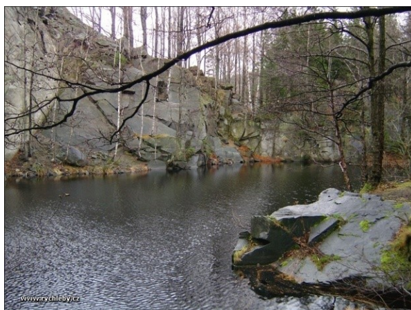
Obrázek 15. Brankopy

Lom nacházející se východně od obce Vápenná, téměř na samém vršku kopce Žulový vrch (dříve Brankope – 718 m.n.m.), podle něhož se nazýval i samotný lom. K lomu se nejlépe dostaneme po modré turistické značce z Vápenné (cca 4,5 km). Nad lomem se nachází od roku 1965 trepská osada Stříbrná pavučina.