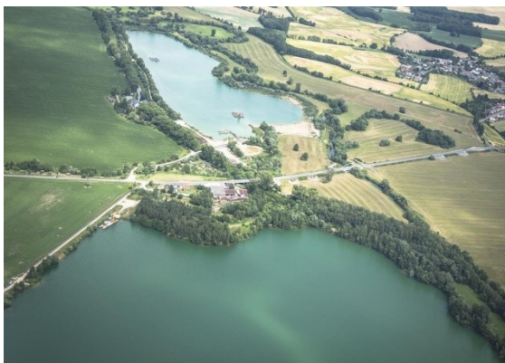
Obrázek 21. Mohelnická jezera

Na informačním webu www.regionmohelnicko.cz je možné nalézt velké množství informací o celém regionu a mimo jiné i o Mohelnických jezerech. Jezera nalezneme mezi Moravičany a Mohelnicí. Tvoří ji dvě jezera, a to Mohelnický bagr a Moravičanské jezero (90 ha). Obě jezera se vyznačují průzračnou vodou. Čistotu vody můžeme přiřknout i tomu, že podloží je písek a dochází pomocí písku k filtraci vody. V blízkosti jezer lze i kempovat neboť poblíž Moravičan je menší kemp. Okolo jezer jsou především na travnaté plochy. I zde je koupání na vlastní nebezpečí. Jednu zajímavost také zmiňuje server regionmohelnicko.cz. Touto zajímavostí je, že Moravičanské jezero je důležitým ornitologickým místem s pravidelným monitorováním hnízdícího ptactva a že celkový zjištěný počet 70 hnízdících druhů ptáků je dokladem ornitologické důležitosti této přírodní rezervace.