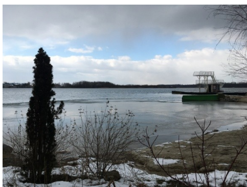
Obrázek 8. Náklo

Problémem zde často bývá parkování. Je zde placené parkoviště, ale některým návštěvníkům se platit nechce, proto auta nechávají nevhodně zaparkovaná podél silnice, která je v těsné blízkosti pískovny. Pro zájemce z Olomouce je možné využít autobusové linky či kola. Vzdálenost od Olomouce je asi 10 Km. Náklo je také populární rybářskou lokalitou.