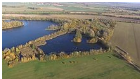
Obrázek 23. Chomoutovské jezero