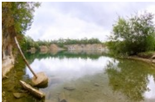
Obrázek 5. Opatovický lom

pod obcí, od cesty u čističky. Vstup je uzavřen závorou a oficiálně se sem stále nesmí a není zde vhodné místo ani pro parkování.