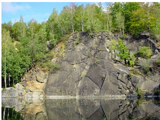
Obrázek 19. Vycpálek

Hned u vstupu k lomu najdeme pomník s podobiznou zakladatele Jana Vycpálka. Lom zabírá téměř celý prostor kopce, který se tyčí nad vodou. Lom nalezneme u obce Vápenná po levé straně silnice ve směru k osadě Zelená Hora.