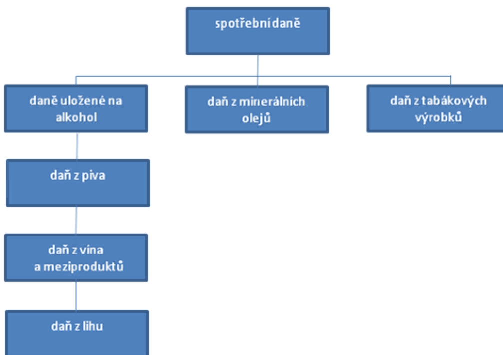
Obrázek 1: Spotřební daně 45

Historicky patří spotřební daně k daním nejstarším a po celou dobu své existence představovaly velký zdroj příjmů pro státní pokladnu. Společně s daní z přidané hodnoty jsou řazeny mezi nepřímé daně, avšak svým pojetím se tyto daně značně liší, neboť povinnost daň přiznat a zaplatit vzniká v okamžiku uvedení do volného daňového oběhu. Jedná se tedy o daně, které se uplatňují pouze jednou. Spotřební daně jsou zároveň součástí daně pro výpočet daně z přidané hodnoty a to jejich ekonomický dopad ještě zvyšuje. Cílem státu je zatížit prodej nebo spotřebu malé skupiny výrobků a tím dosáhnout přínosu pro státní rozpočet. V rámci Evropské unie jsou harmonizovány spotřební daně jako daně z přidané hodnoty. Ve směrnici Evropské unie je přesně stanoveno, co je předmětem spotřební daně a co lze od spotřební daně osvobodit. Pro jednotlivé skupiny zboží jsou zároveň také stanoveny minimální sazby daně, což musí i Česká republika splňovat 44 .