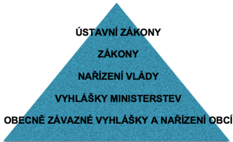
Obrázek 2 - Postavení právních předpisů obcí v právním řádu ČR