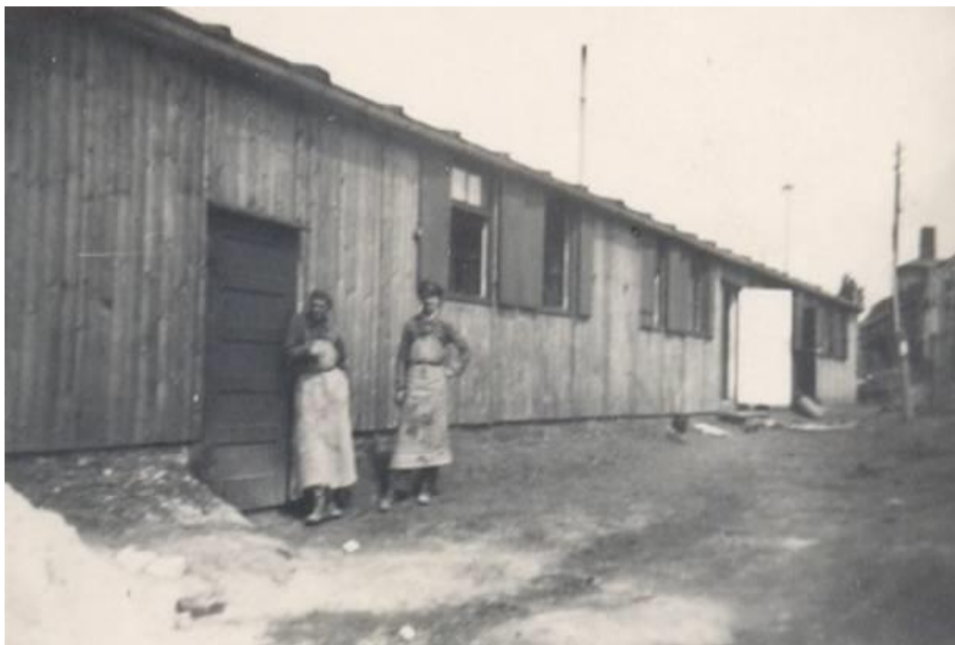
Příloha I: Stavba pomníku obětem nacismu v Bernarticích