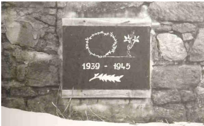
Obrázek 1: Památník obětem 1. a 2. světové války (Rtyně v Podkrkonoší)

Příloha J: Dřívější označení hrobu čtyř židovských obětí tábora na hřbitově v Bernarticích