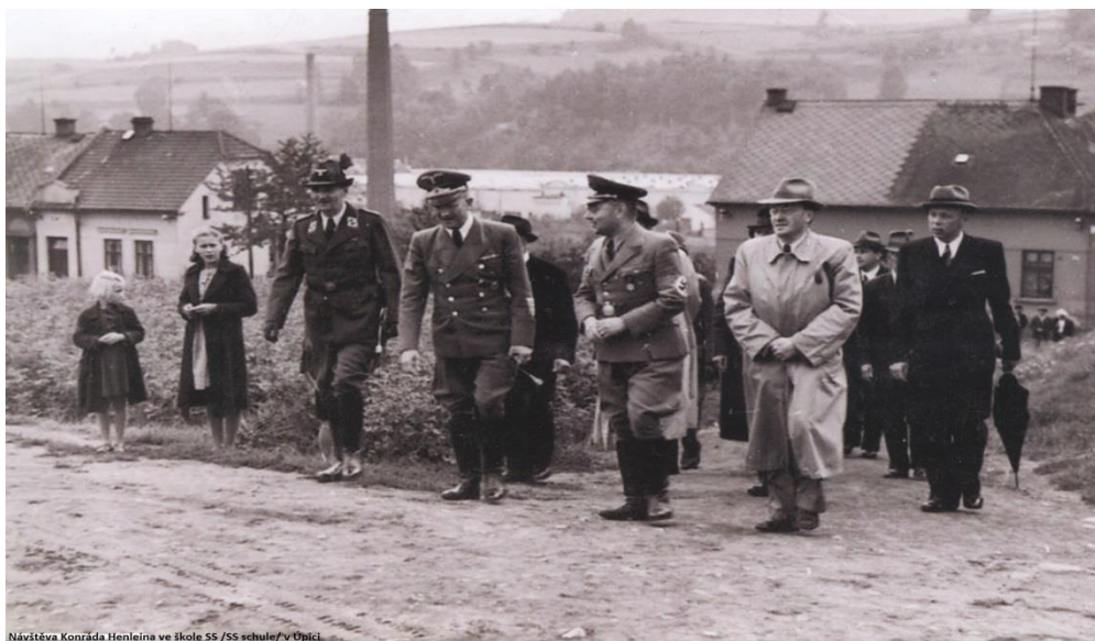
Návštěva Konrada Henleina ve škole SS /SS schule/ v Úpici