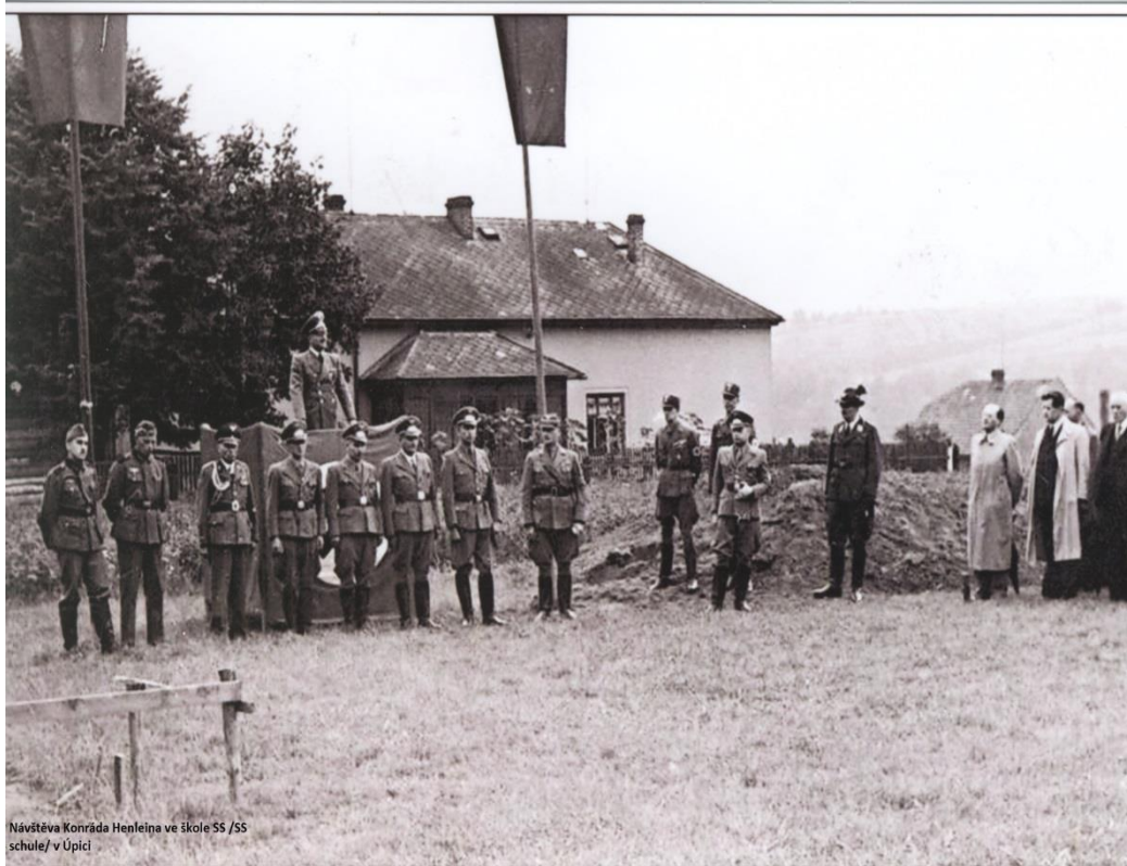
Návštěva Konrada Henleina ve škole SS /SS schule/ v Úpici