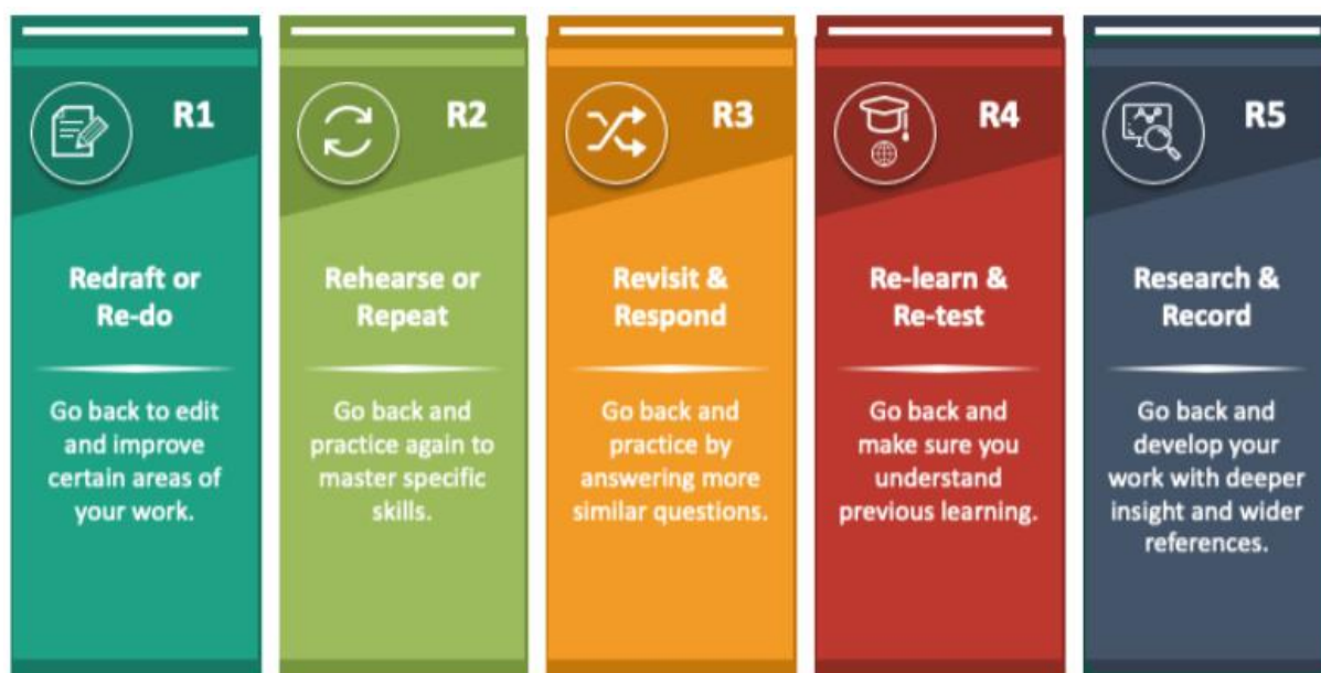
Obrázek č. 2: Pět typů zpětné vazby - R's feedback