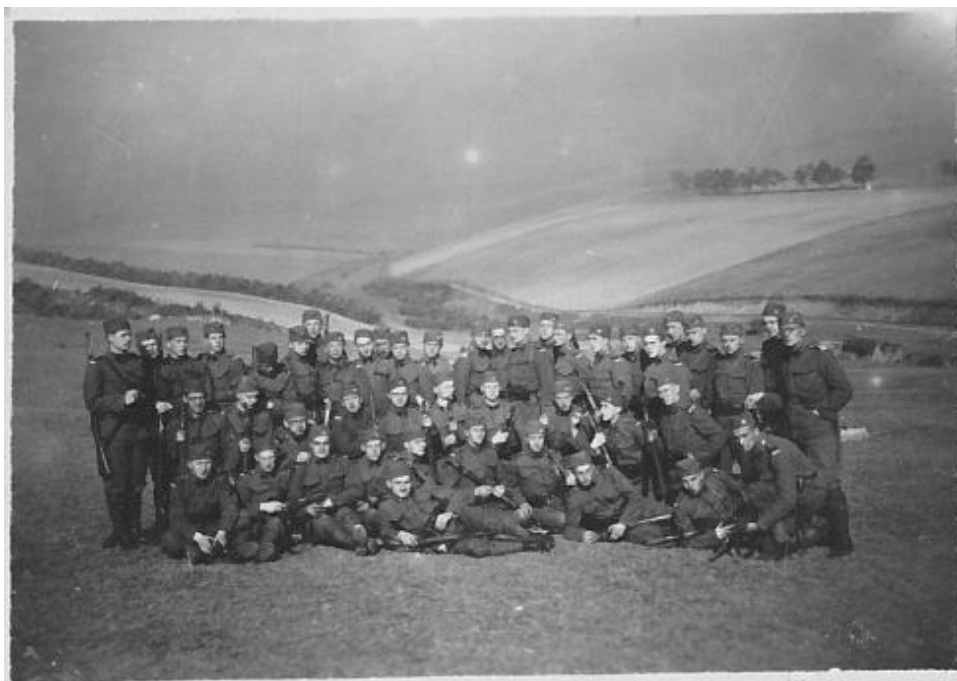
Obr. č. 1: Lopaurova rota během cvičení pro důstojníky v Košicích. Fotografie pravděpodobně pochází z roku 1931.