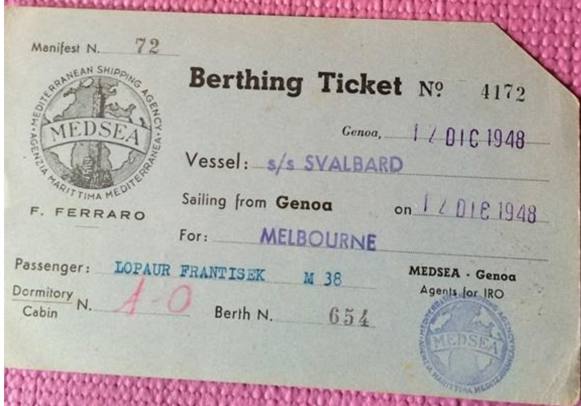
Obr. č. 9: Lístky z parníku přepravující oba manžele z Itálie do Austrálie na přelomu let 1948 a 1949. In: Memoáry Olgy Lopaurové, sedmá část.