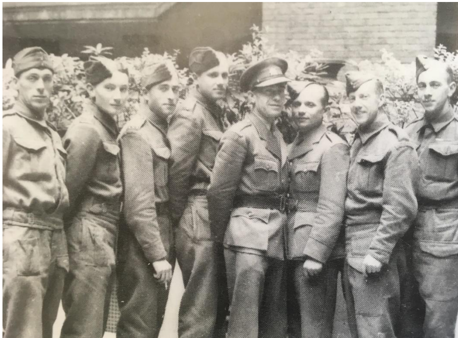
Obr. č. 6: Tatáž fotografie, avšak z profilu účastníků kurzu. ČVANČARA, J.: Anthropoid , s. 150.