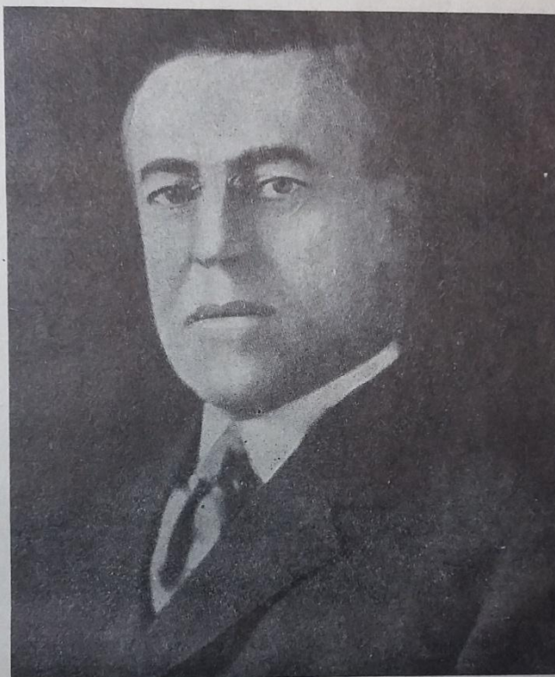
Obr. 75. Woodrow Wilson. Tento oduševnělý portrét prozrazuje učenca. Wilson, původně profesor práva a historie, dovedl však uplatnit své vysoké ideály i v činné politice a zapsal se tak nesmazatelně do dějin lidstva.

Bolševická vláda, zejména komisař zahraničních věcí Lev Trockij, vyzývala od počátku bojující státy k příměří. Nenalézájíc však ohlasu u států dohodových, uzavřela sama s ústředními