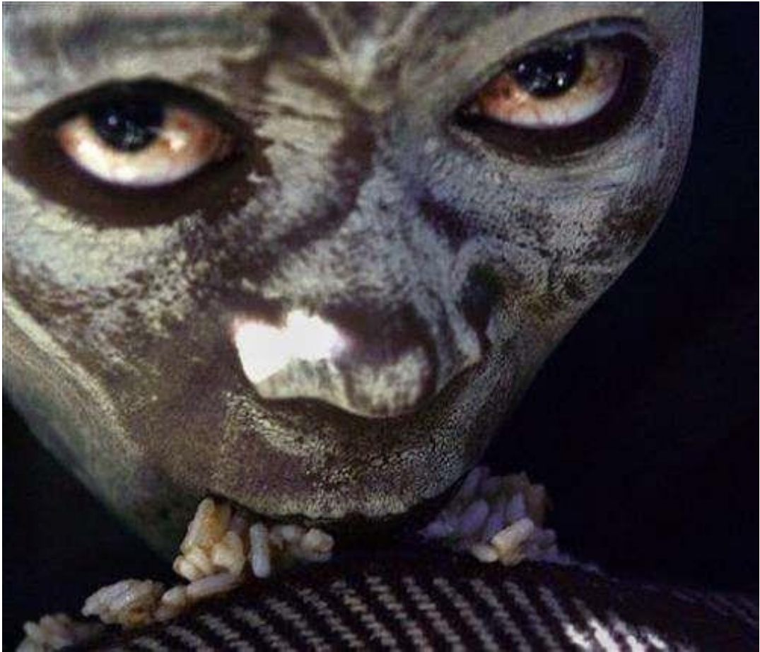
Obrázek 1: V liminaritě jsou si všichni rovni. 51