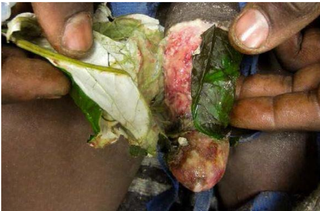
Obrázek 18: Mírný zánět pod tradičním bylinným zábalem