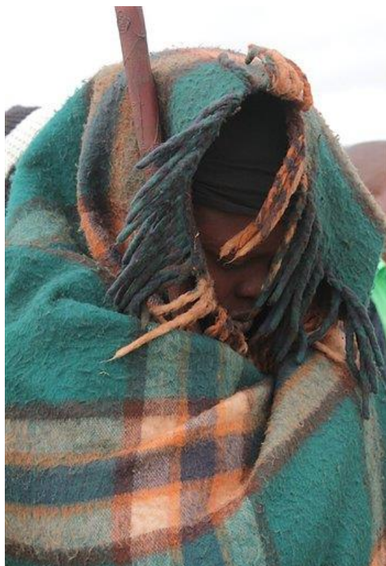
Obrázek 4: Bombatha Mandela 54