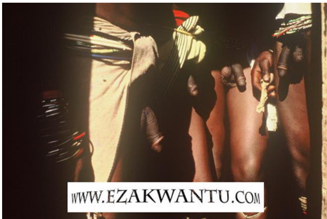
Obrázek 10: Ukázka úspěšně zhojených penisů