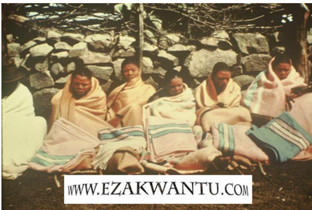
Obrázek 9: Inicianti v rámci hojení a „přerodu“ v muže. Jasně zřetelné prvky communitas