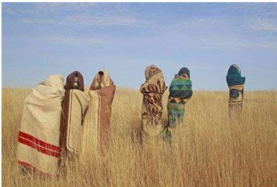
Obrázek 3: Záběry pořízeny 30. 7. 2013 v oblasti Qunu, odkud pocházel Nelson Mandela 53