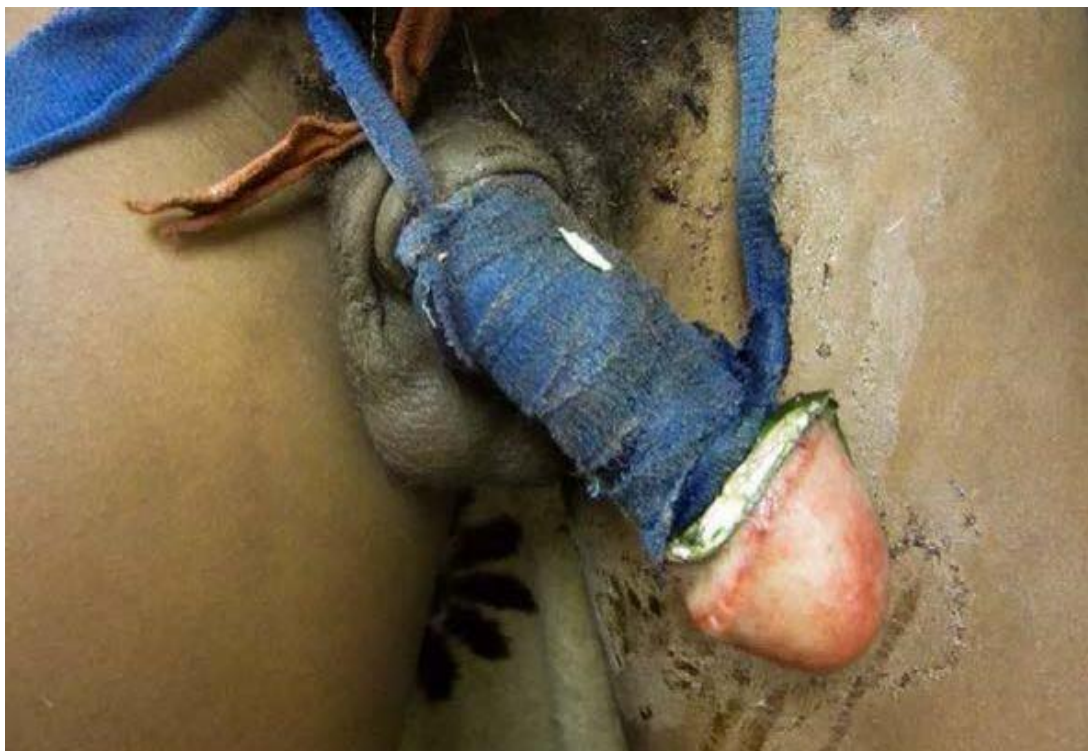
Obrázek 12: Ukázka špatně ošetřené rány