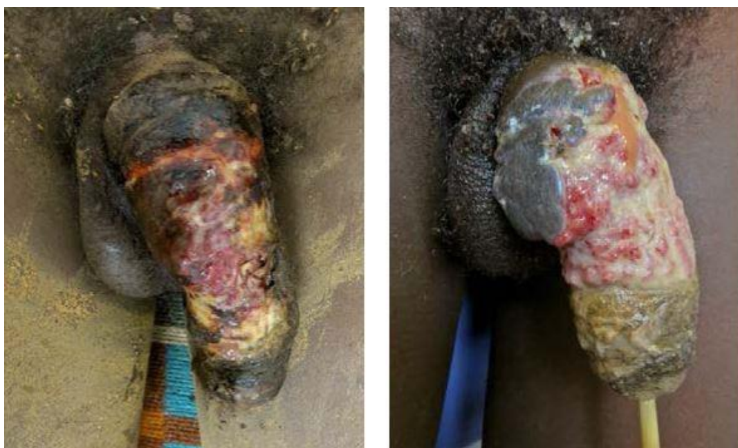
Wet gangrene of the penis. Day 15 and 22; lost penis eventually.