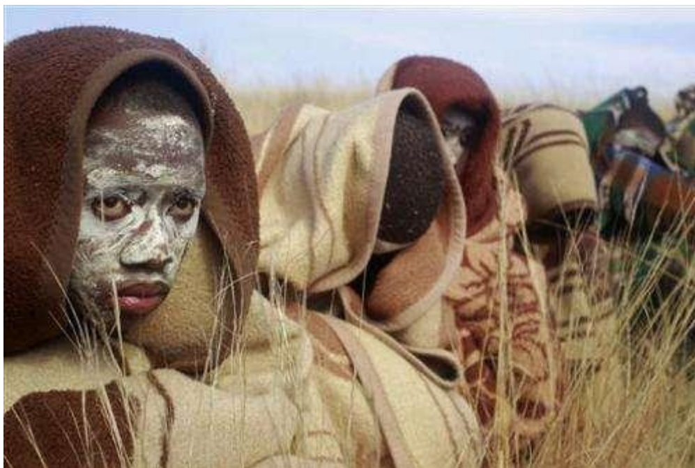
Obrázek 2: Inicianti zachyceni v průběhu iniciačního procesu. Záběry byly pořizeny 30. 7. 2013 v oblasti Qunu, odkud pocházel Nelson Mandela 52