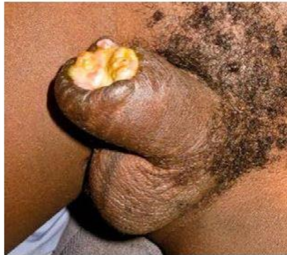
Loss of the glans following dry gangrene, caused by tight bandaging. Day 16, 37, and 52.

Obrázek 13: Názorná ukázka suché gangrény zapříčiněné příliš pevným obvázáním. Jako důsledek iniciant přišel o žalud penisu