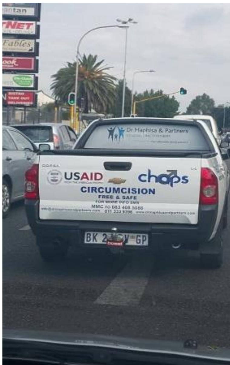
Obrázek 19: Reklama na lékařsky vedenou obřízku