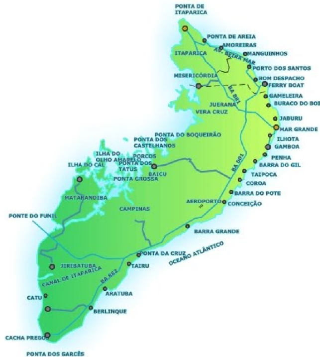
Figura 1: Mapa da Ilha de Itaparica 6