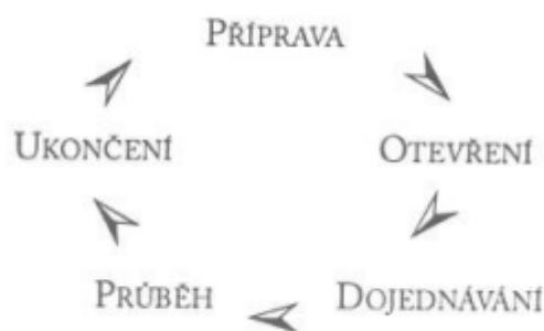
Obrázek 4 Fáze rozhovoru (Úlehla, 2004, s. 122).

pracovníka, jinými slovy zakázku, jenž vymezuje konkrétní oblast a cíl spolupráce. Velice důležité je cíl dobře formulovat. Cíl má jmenovat začátek něčeho, má se týkat toho, co nastane, musí být malý, konkrétní, realistický, pro klienta významný, jeho dosažení ho musí stát úsilí. Další fáze se označuje jako průběh rozhovoru. Jeho podstatou je udržení užitečných pracovních vztahů a práce na vyřešení problému. Do fáze ukončení rozhovoru patří ověření úspěchu a zhodnocení společné práce (Úlehla, 2004, s. 15).