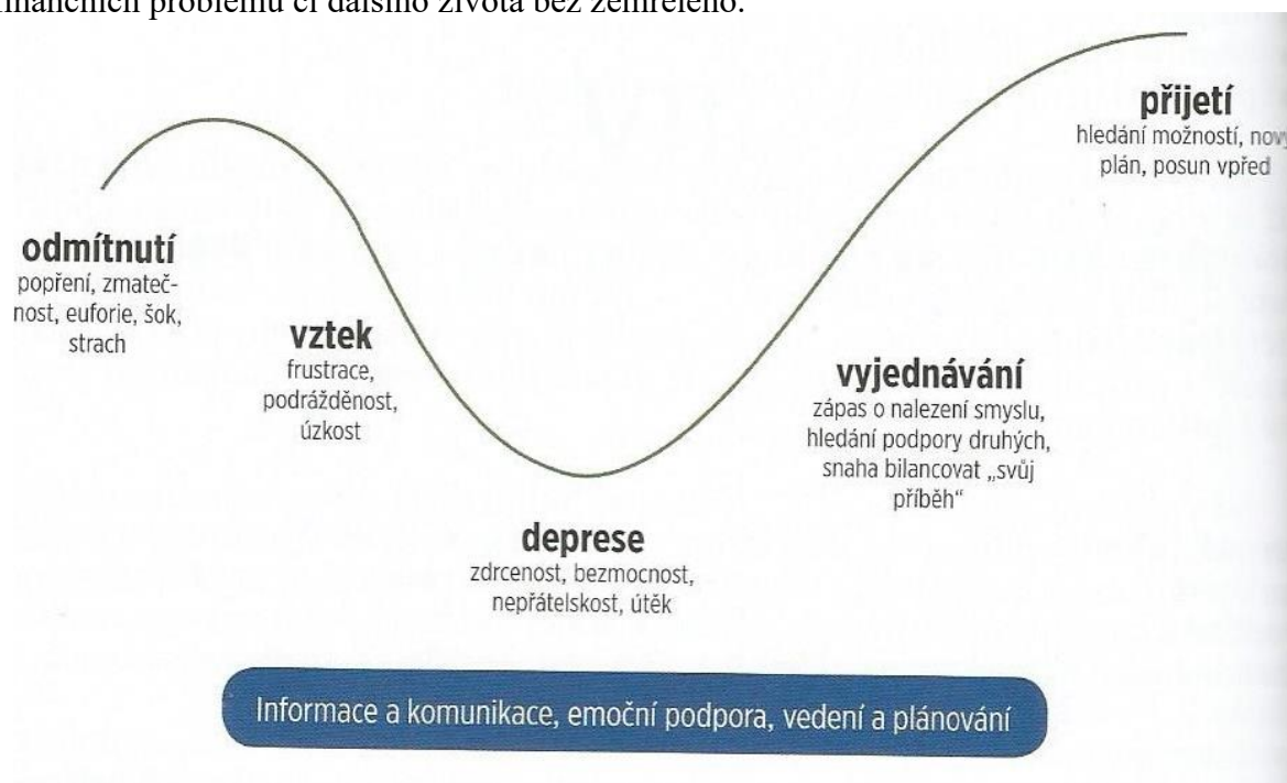
Obrázek 2 Trajektorie vyrovnávání - model pěti stádií vyrovnávání se se skutečností smrtelného onemocnění. Elizabeth Kübler-Rossová v roce 1969 vytvořila tento model na základě svojí zkušenosti s více než pěti sty pacienty (Kabelka, 2018, s. 283 – 284).

V tomto období pacient a jeho nejbližší prochází pěti fázemi, které popsala MuDr. Elizabeth Kübler – Rossová. Každá fáze se projevuje jinak a je nutné tedy měnit přístup péče. Fáze nemusí zachovávat ustálený sled. Často se některé fáze vracejí, střídají a mohou se i v jednom dni prolínat. Fáze nemají stejnou délku a někdy může některá fáze zcela chybět. Umírající i rodina se mohou nacházet současně v odlišných fázích. Cílem je sjednotit obě strany a dovést je ke smíření (Matoušek, Koláčková, Kodymová, 2005, s. 198). Kromě zmíněných fází mohou příbuzné provázet další psychosociální aspekty při doprovázení umírajícího. Často mají obavy z jeho psychického a fyzického utrpení, obavy z vlastního selhání, nebo pocit viny, protože mu nedokáží pomoci. Mají obavy z pohledu na zemřelého, z organizace pohřbu, z finančních problémů či dalšího života bez zemřelého.