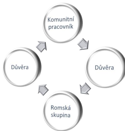
Obrázek 4 - Důvěra