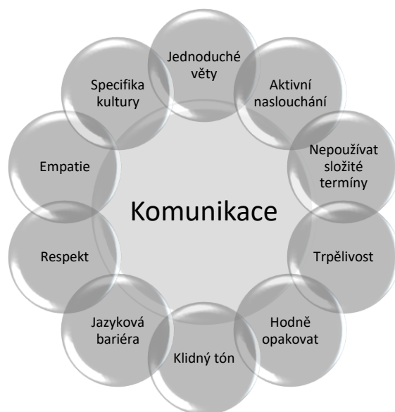
Obrázek 3- Komunikace