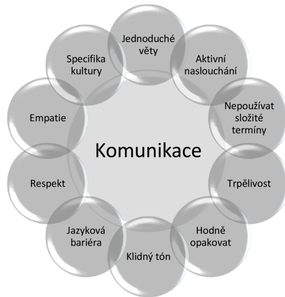
Obrázek 3- Komunikace