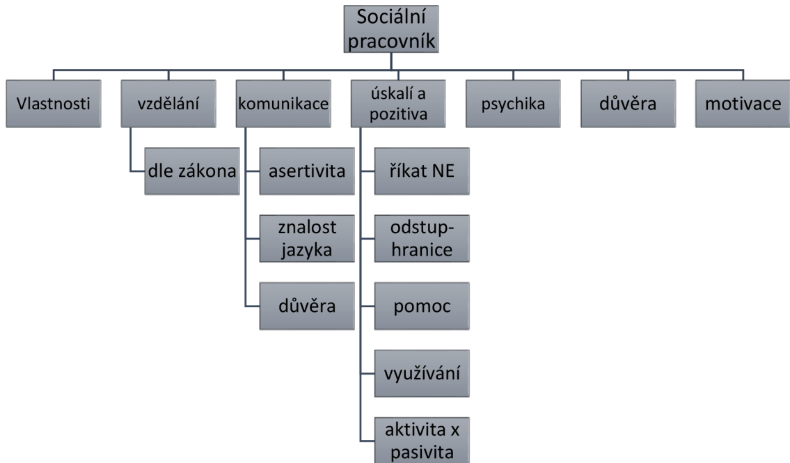
Obrázek 1 – Sociální pracovník

Zaměřuji na sociální pracovníky, jaké mají mít dovednosti a zjišťuji, co by měl sociální pracovník znát, umět a ovládat, aby mohl pracovat s touto cílovou skupinou.