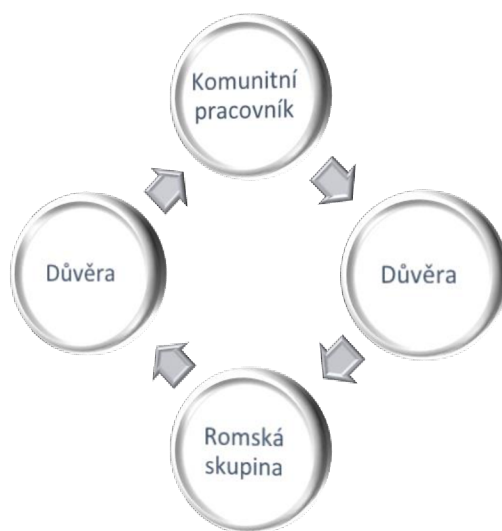
Obrázek 4 - Důvěra