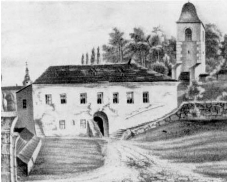
Obrázek 2: Bratrská škola ve Fulneku

Zdroj: http://www.zsbrandysno.cz/ Bratrská škola ve Fulneku