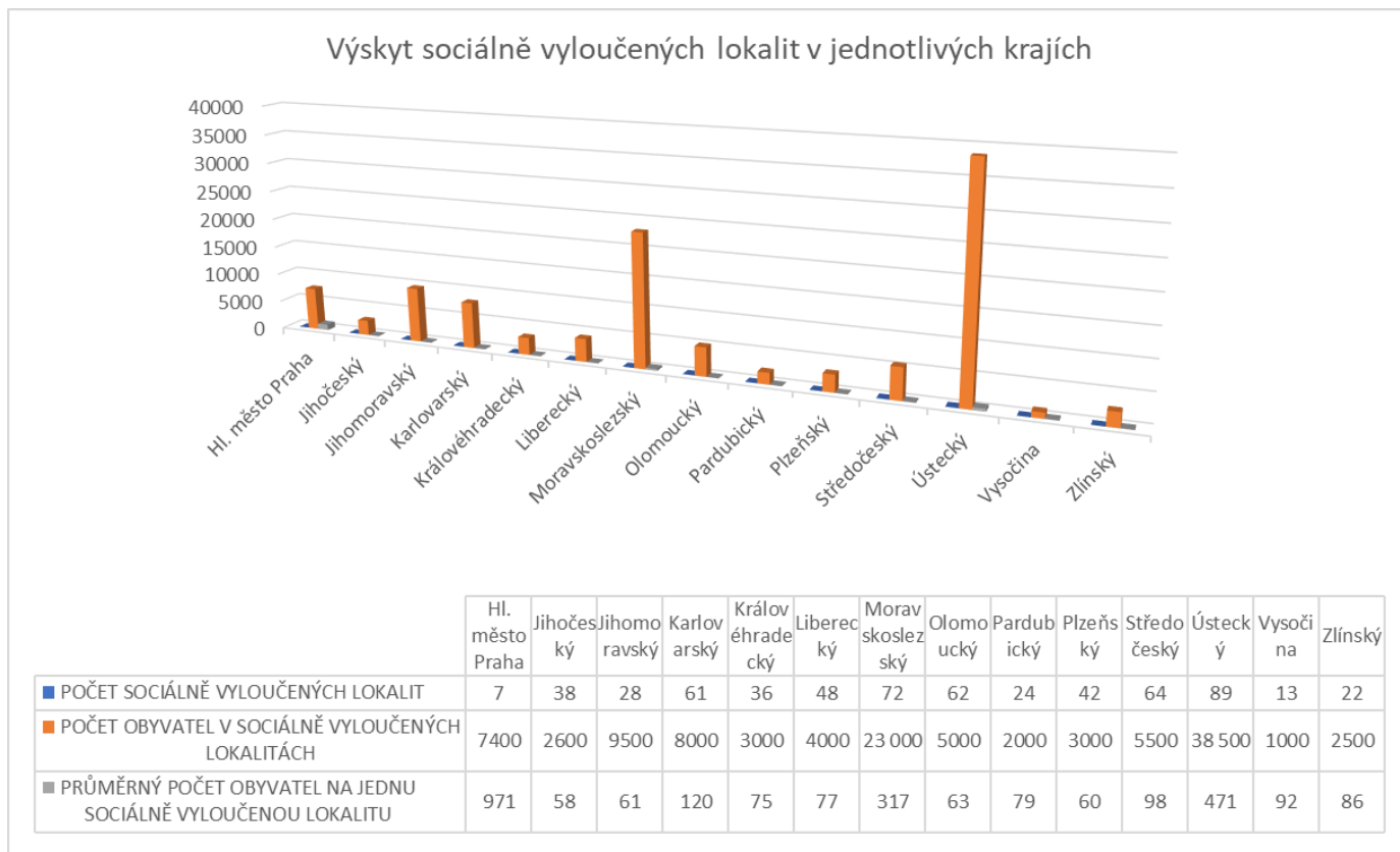
Obrázek 6: Výskyt sociálně vyloučených lokalit dle krajů

https://www.esfcr.cz/mapa-svl-2015/www/index9ba9.html?page=3