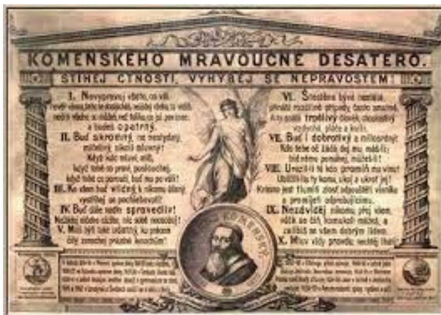
Obrázek 3: Komenského mravoučné desatero