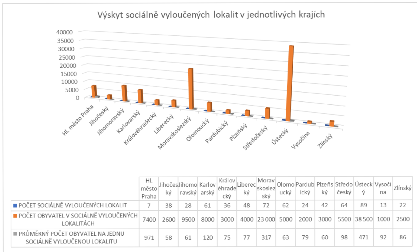
Obrázek 6: Výskyt sociálně vyloučených lokalit dle krajů

https://www.esfcr.cz/mapa-svl-2015/www/index9ba9.html?page=3