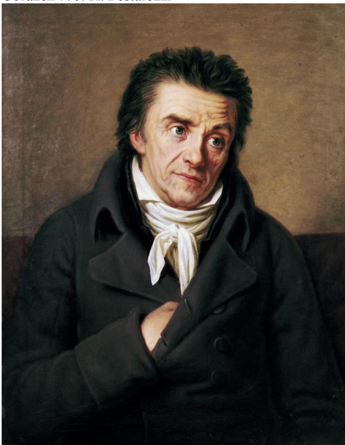
Obrázek 5: J. H. Pestalozzi

/www.myartprints.cz/a/schoener-georg-friedrich/portret-johann-heinrich .