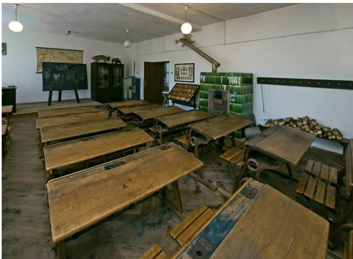
Obrázek 4: Dobová škola ve skanzenu Zubrnice