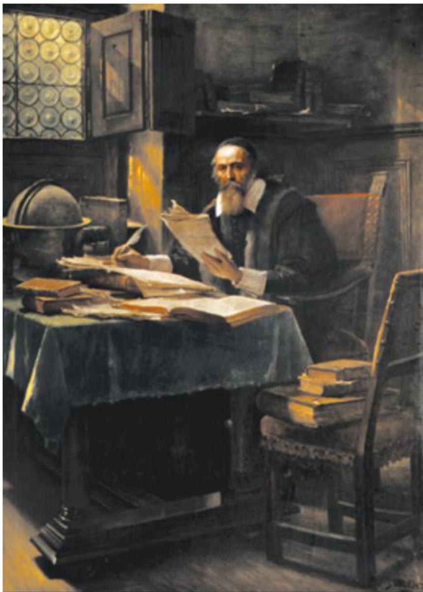
Obrázek 1: J. A. Komenský

Zdroj: Brožík Václav, J. A. Komenský ve své pracovně v Amsterdamu (1891)