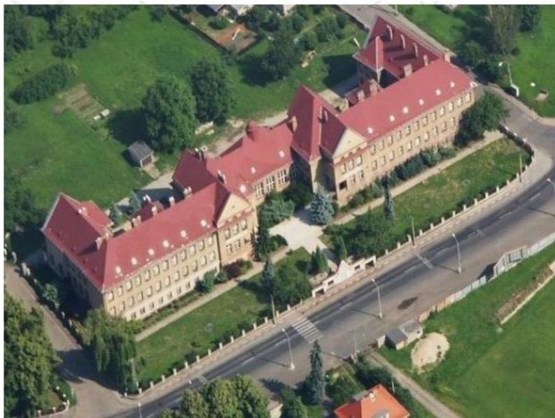
Obrázek 8: ZŠ Trmice