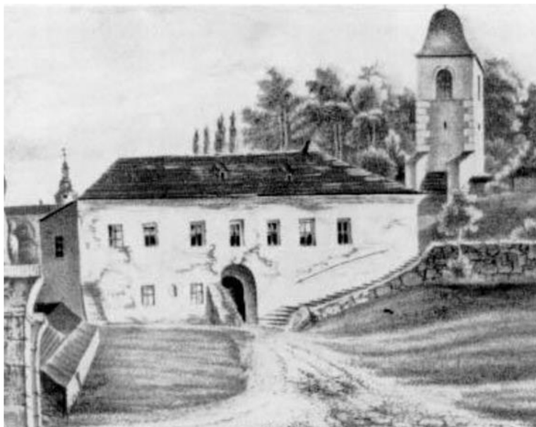
Obrázek 2: Bratrská škola ve Fulneku

Zdroj: http://www.zsbrandysno.cz/ Bratrská škola ve Fulneku