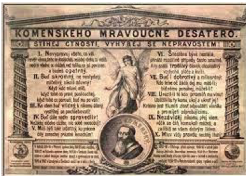
Obrázek 3: Komenského mravoučné desatero