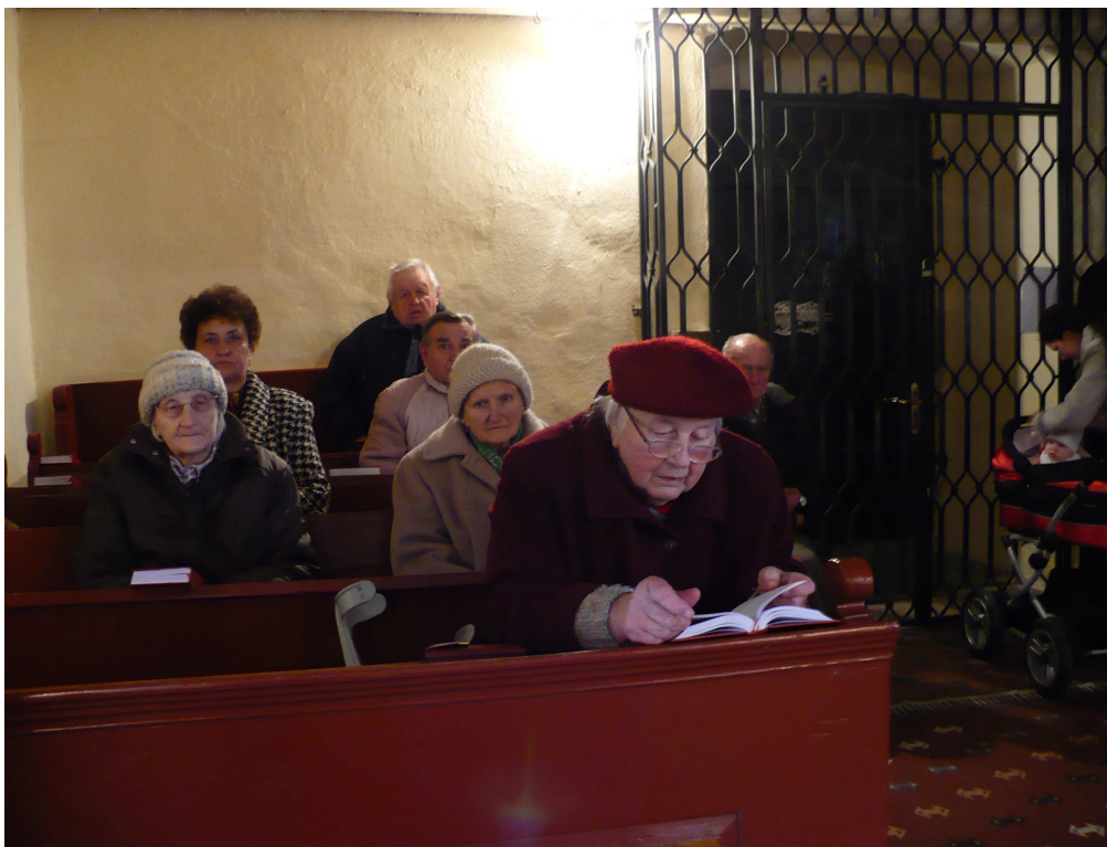
16. Seniorky a pohled na hlavní oltář v kostele sv. Martina ve Střížově