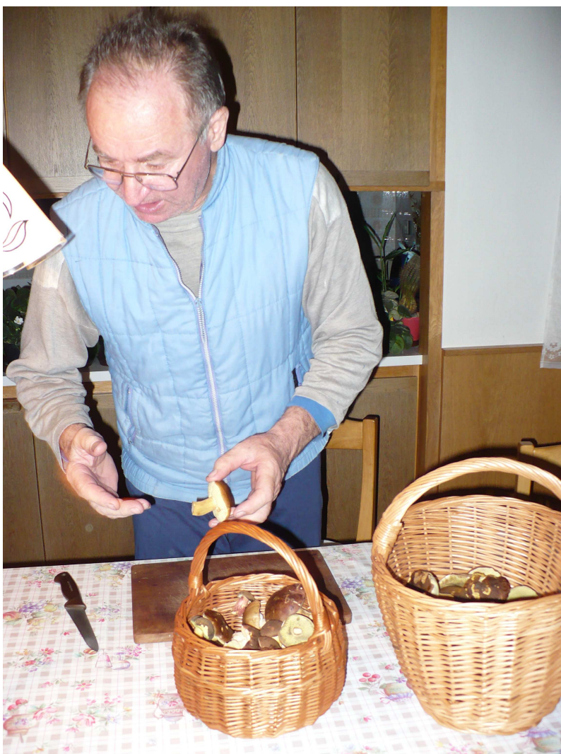
14. Houbaření – častá záliba venkovských seniorů (Římov)