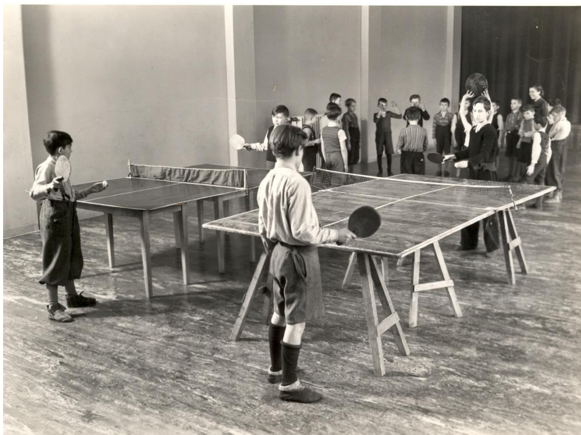
Obrázek 10: Milíčův dům – děti v tělocvičně