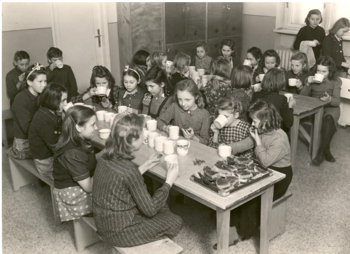
Obrázek 4: Milíčův dům – děti na svačině