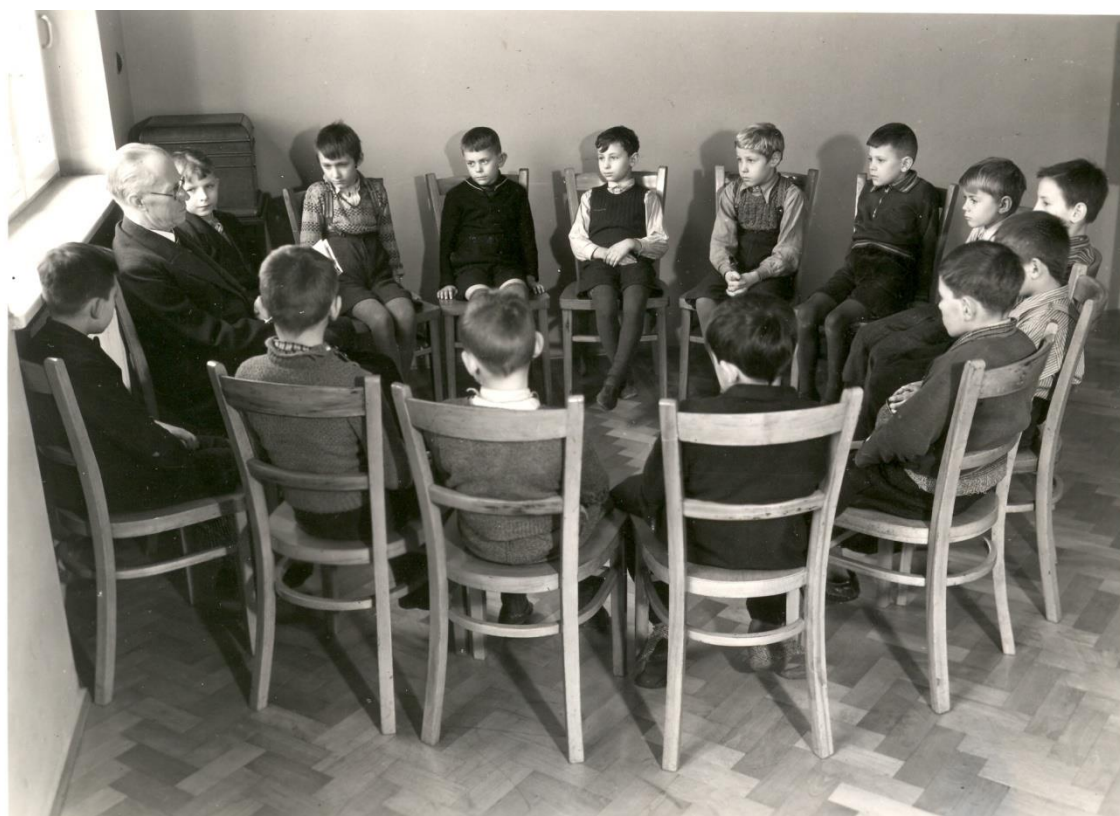
Obrázek 9: Schůzka Vlčků v klubovně F. Krch