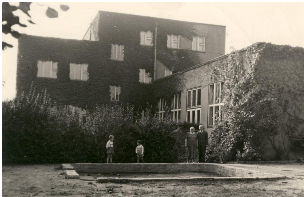
Obrázek 11: Zahrada Milíčova domu