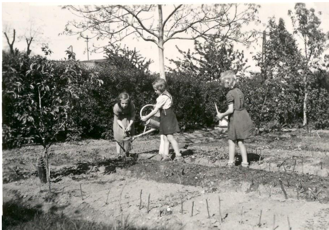
Obrázek 3: Milíčův dům – děti na zahradě