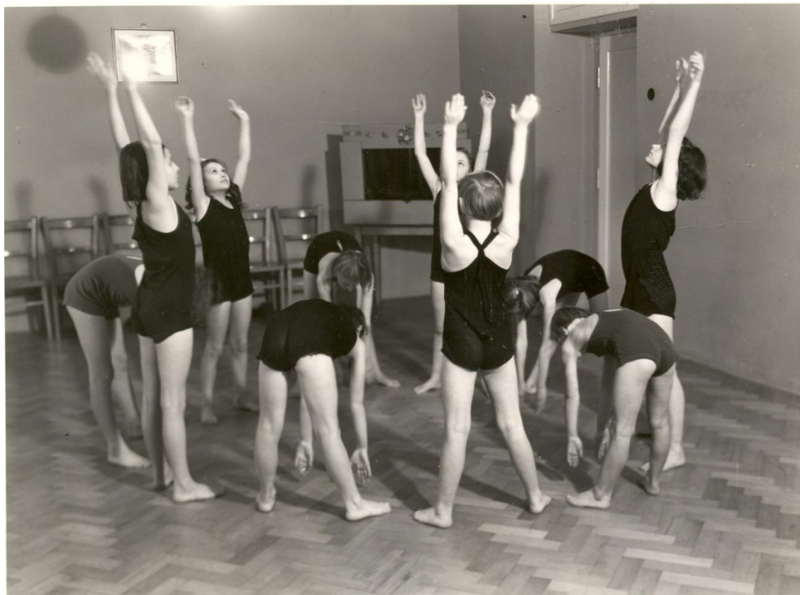
Obrázek 8: Milíčův dům – hudební sál – rytmika