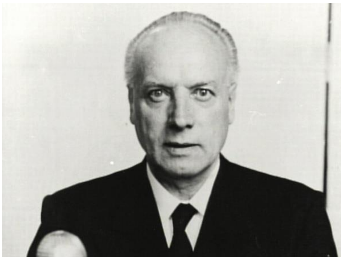
Obrázek 1: Přemysl Pitter