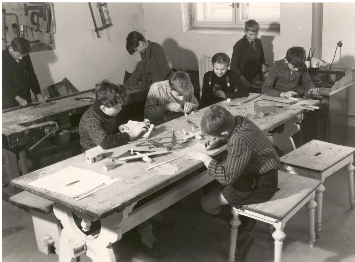
Obrázek 7: Milíčův dům – dílna chlapců